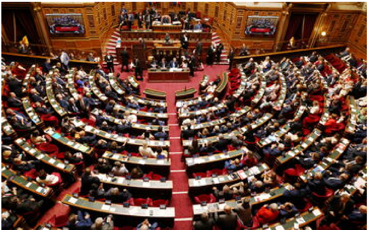
Loi immigration : le Sénat adopte la suppression de l'aide médicale d'État pour les sans-papiers