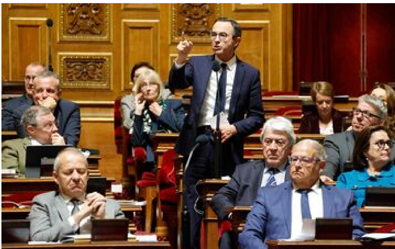
Projet de loi Immigration : accord au Sénat sur la régularisation des travailleurs étrangers dans les métiers en tension