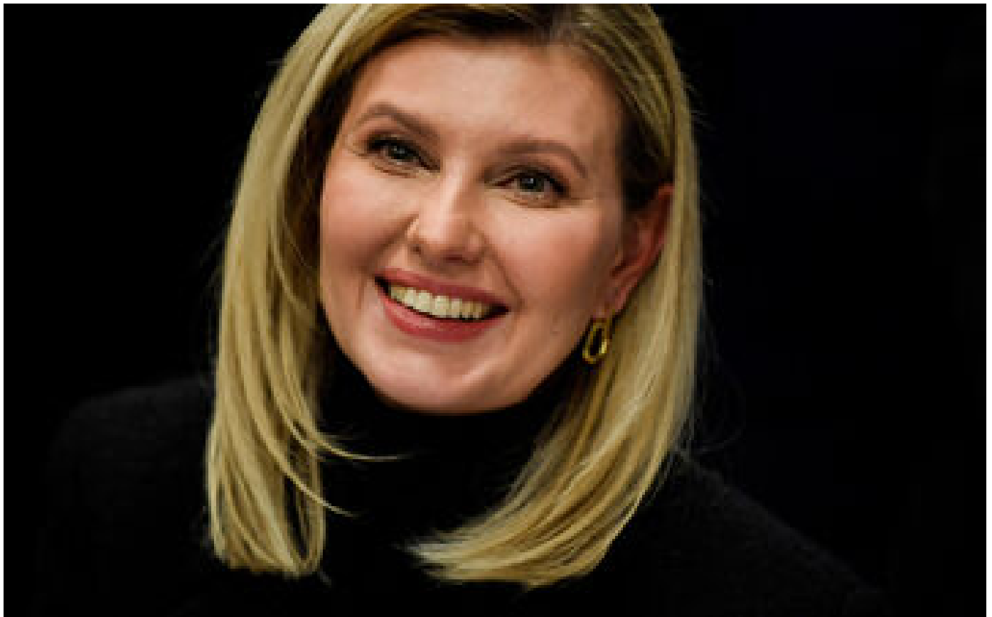
Info Le Parisien La Première dame d'Ukraine à Paris mercredi