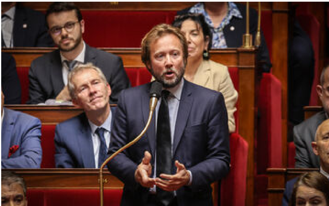
Info Le Parisien Les députés PS obtiennent une aide exceptionnelle de Noël, de 115 à 200 euros pour les familles monoparentales