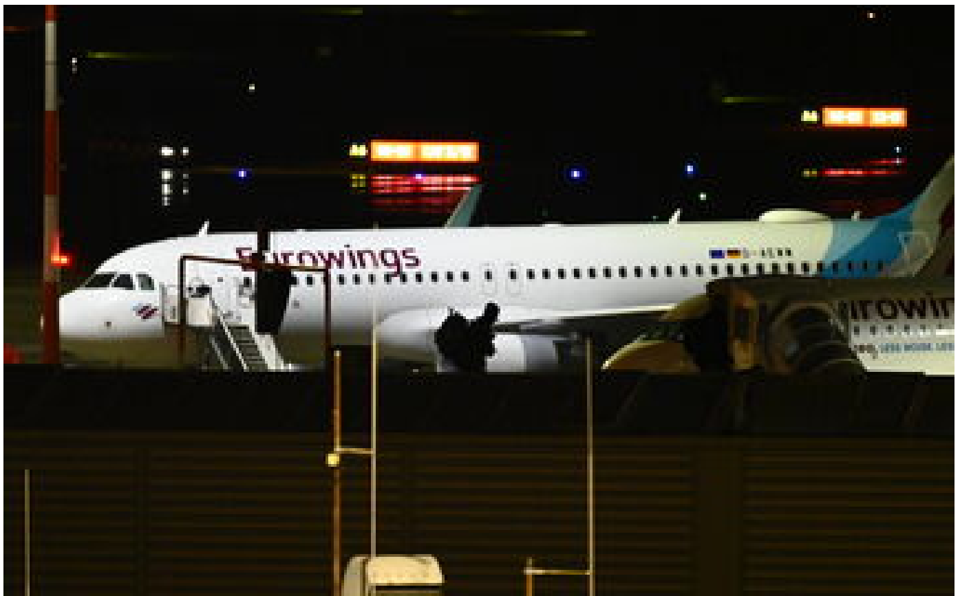
Hambourg : un homme s'introduit sur le tarmac de l'aéroport en voiture, un enfant retenu en otage