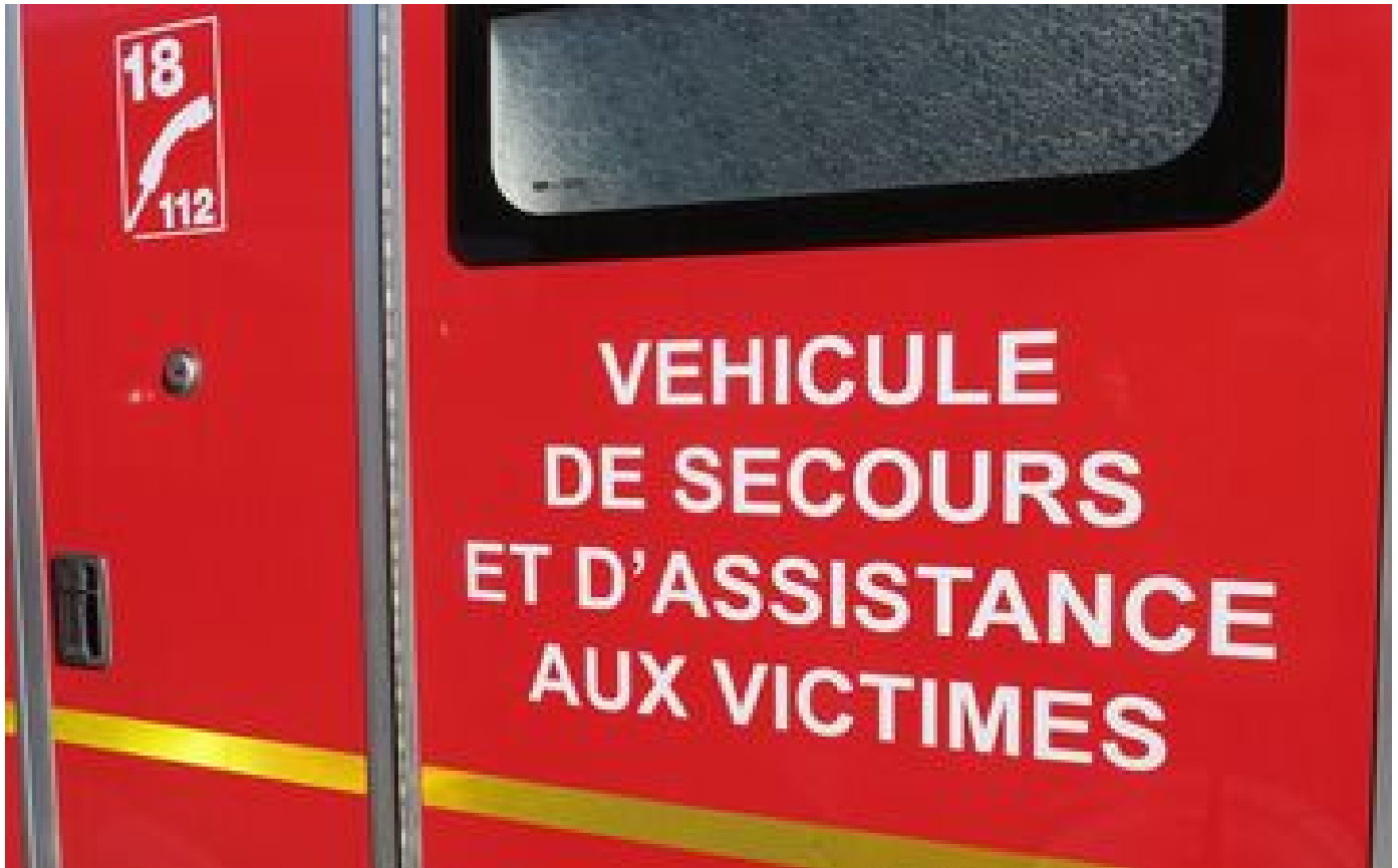
Nord : un bébé meurt intoxiqué au monoxyde de carbone