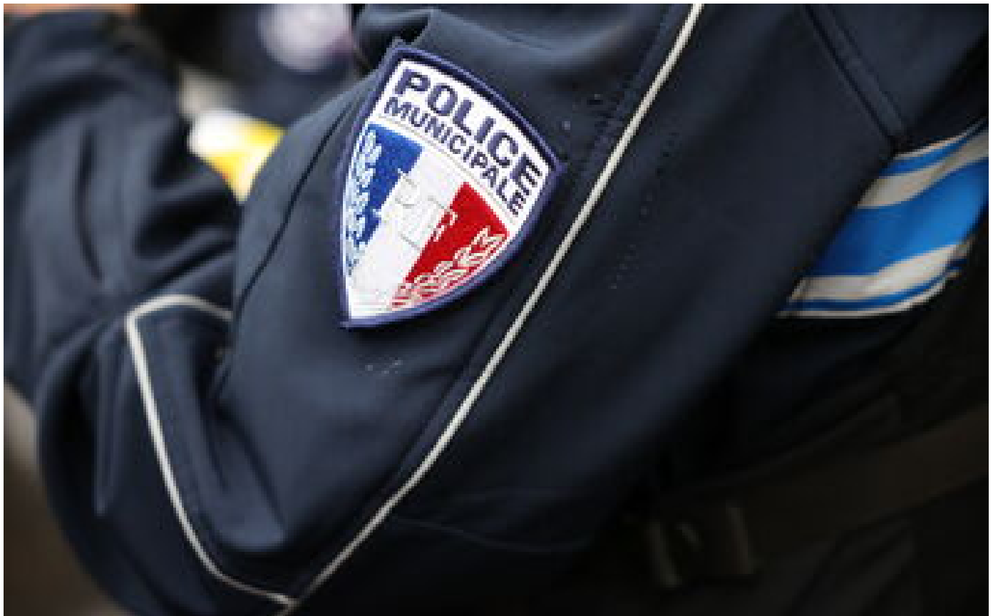
« Ils l'ont broyé » : un policier se suicide, les proches accusent sa hiérarchie de maltraitance P