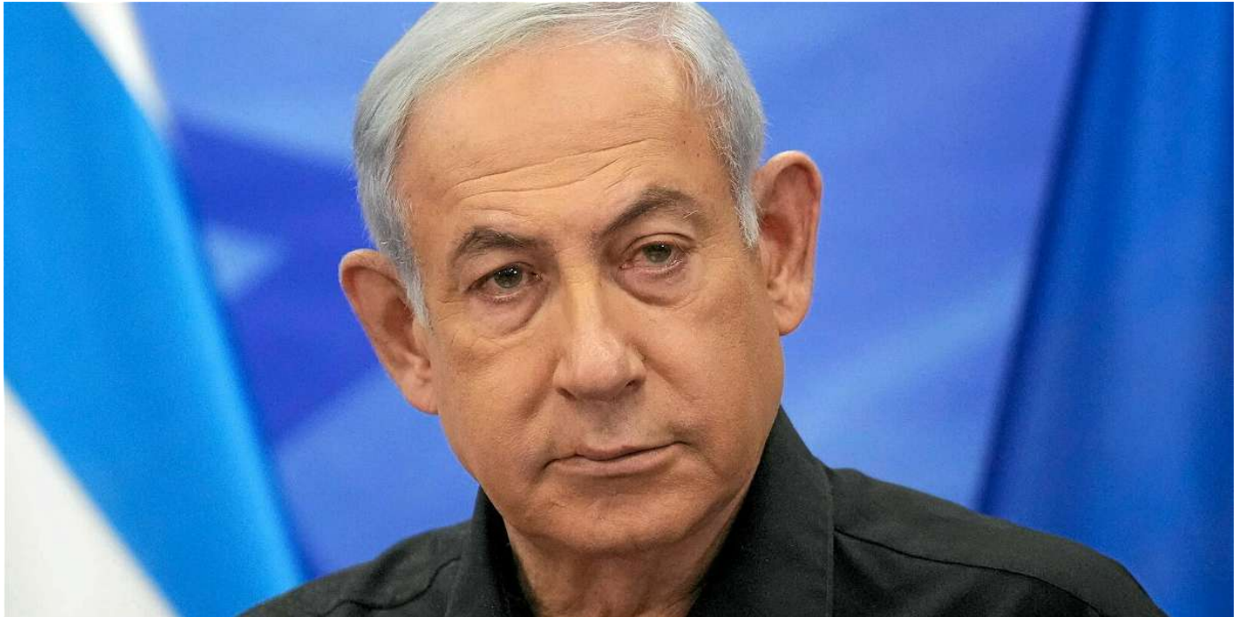
Benjamin Netanyahu a sanctionné le miniprout de l'Héritage israélien.