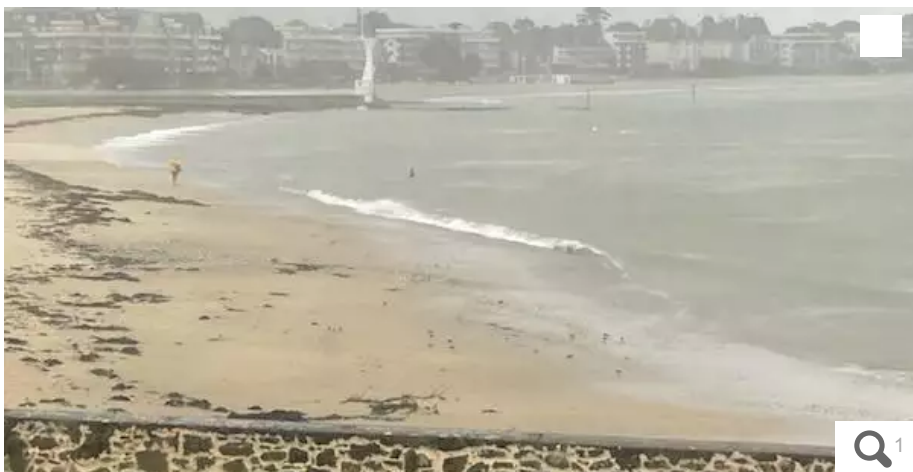
Une personne se baigne au Pouliguen samedi après-midi 4 novembre.

Votre e-mail, avec votre consentement, est utilisé par la société Additi Multimedia pour recevoir les newsletters sélectionnées. En savoir plus