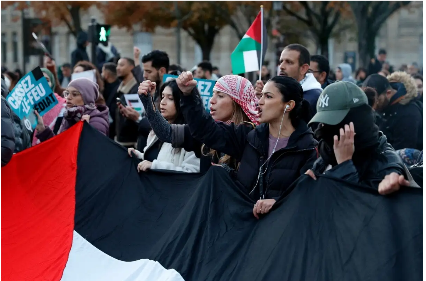
Israël-Hamas: des milliers de manifestants "contre la guerre" à Paris et ailleurs en France