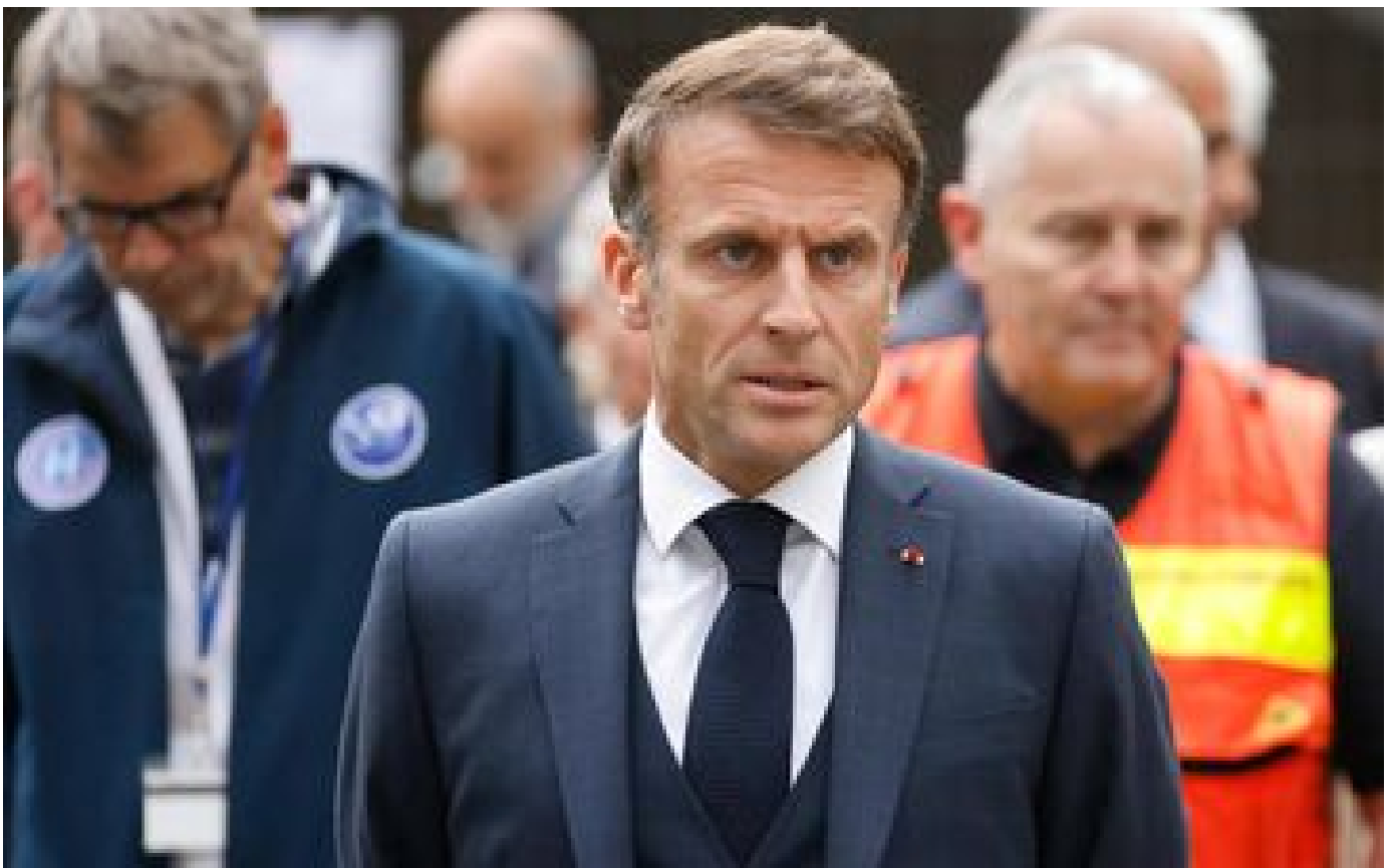
Attaque à Arras : pas de trêve pour les oppositions, qui réclament déjà des comptes au gouvernement P