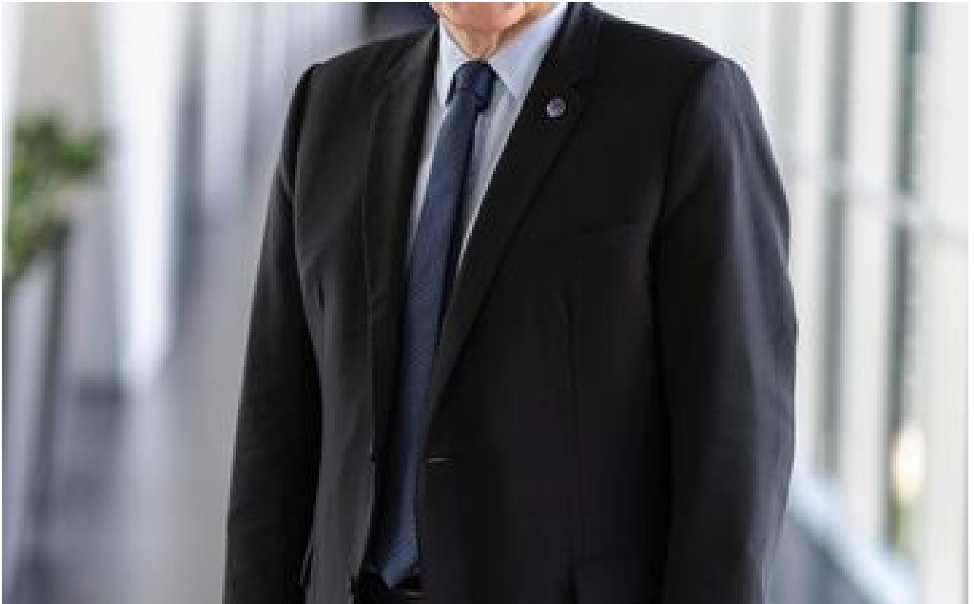
Thierry Breton : « Musk a l'obligation de contrôler les contenus sur X-Twitter » P