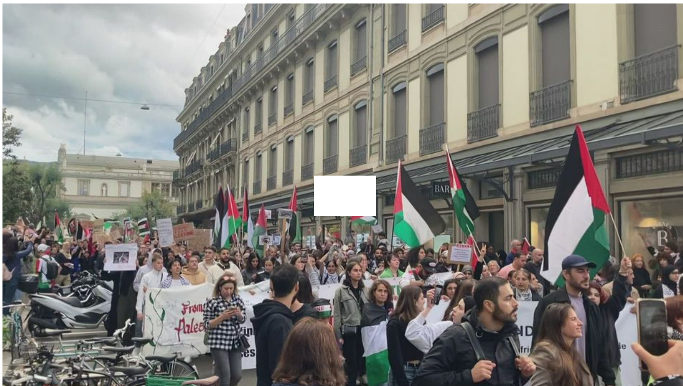
Manifestation pro-Palestine à Genève / L'actu en vidéo / 38 sec. / aujourd'hui à 17:59