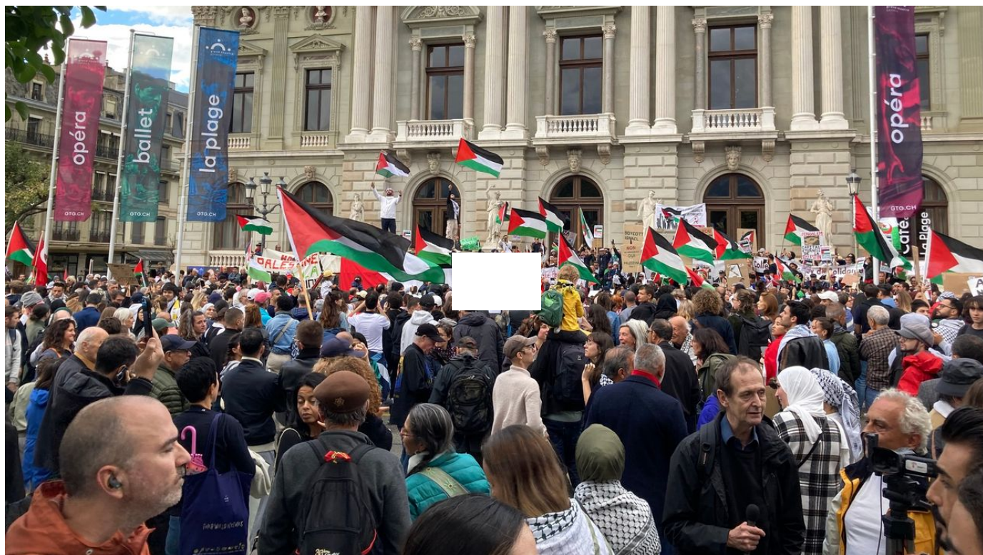
Une manifestation en soutien aux Palestiniens est en cours à Genève / Forum / 3 min. / aujourd'hui à 18:05