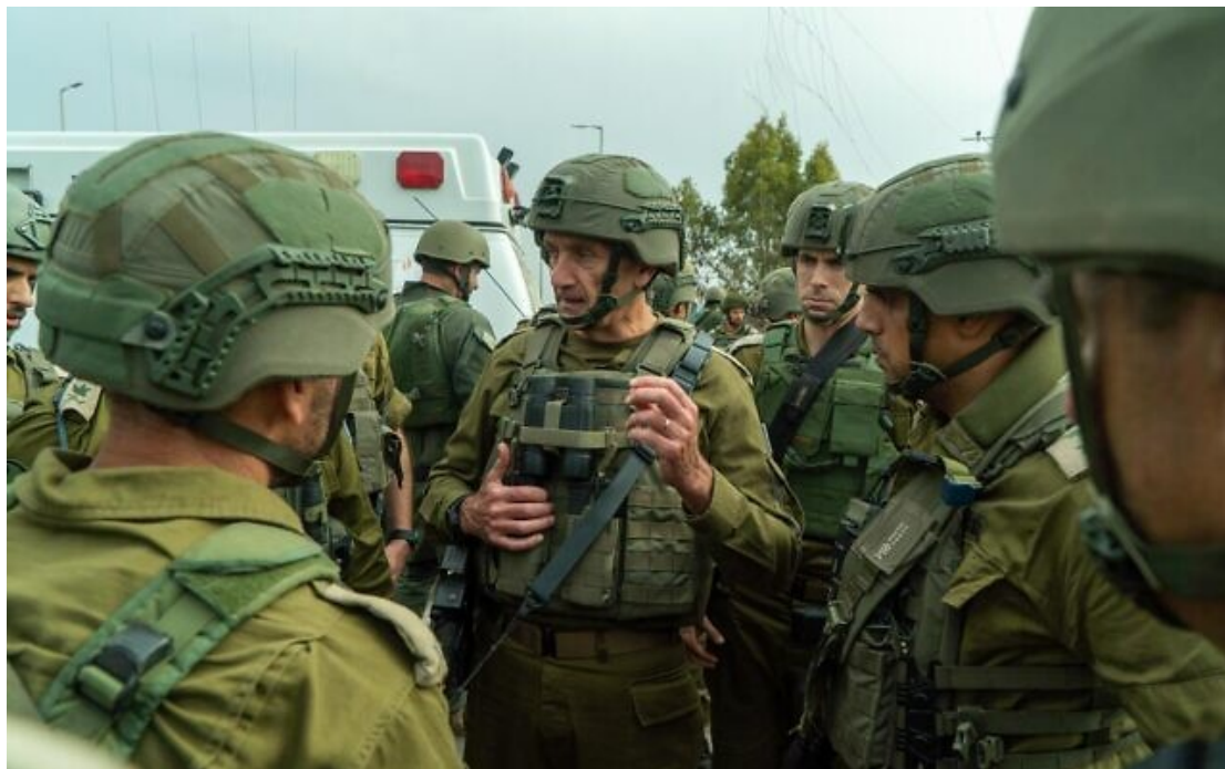
Le chef d'état-major de Tsahal, le général Herzi Halevi, parle aux troupes stationnées le long de la frontière avec la bande de Gaza, le 9 octobre 2023.

Le chef d'état-major de Tsahal a déclaré aux soldats stationnés près de la frontière avec la bande de Gaza que l'armée israélienne était en train de trouver ses marques après avoir été mise en difficulté par l'attaque-surprise du Hamas, alors même que des opérations de ratissage continuent en Israël avec pour objectif de retrouver les terroristes qui sont encore sur le territoire.