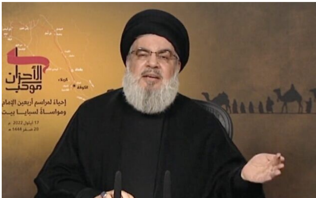
Hassan Nasrallah, chef du groupe terroriste libanais du Hezbollah, lors d'un discours télévisé pour la commémoration chiite d'Arbaeen, le 17 septembre 2022.

Le groupe terroriste chiite Hezbollah ne doit pas prendre la « mauvaise décision » d'ouvrir un deuxième front contre Israël à la frontière avec le Liban, a prévenu lundi un haut responsable américain de la Défense.