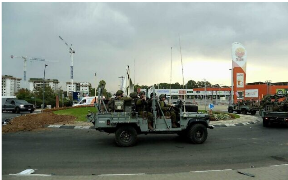
Des troupes de la brigade des parachutistes de l'armée dans la ville méridionale de Sderot près de la frontière avec la Bande de Gaza, le 9 octobre 2023.

L'armée israélienne déclare que les troupes de la brigade des parachutistes, y compris les officiers supérieurs, travaillent à nettoyer la ville méridionale de Sderot des terroristes palestiniens qui se sont infiltrés en Israël au cours des deux derniers jours.