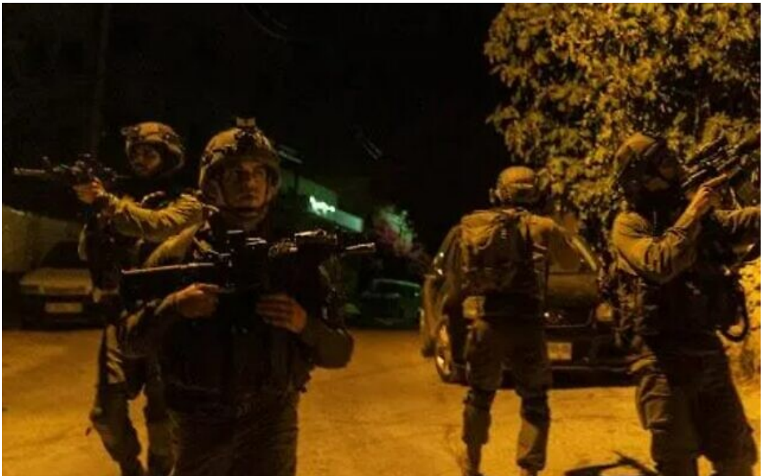
Les soldats israéliens reprenant le contrôle du kibboutz Beerli en Israël, le 8 octobre 2023.

Une centaine de corps ont été retirés du kibboutz Beerli, rapportent les médias israéliens, citant ZAKA, le service d'urgence et de recherche.