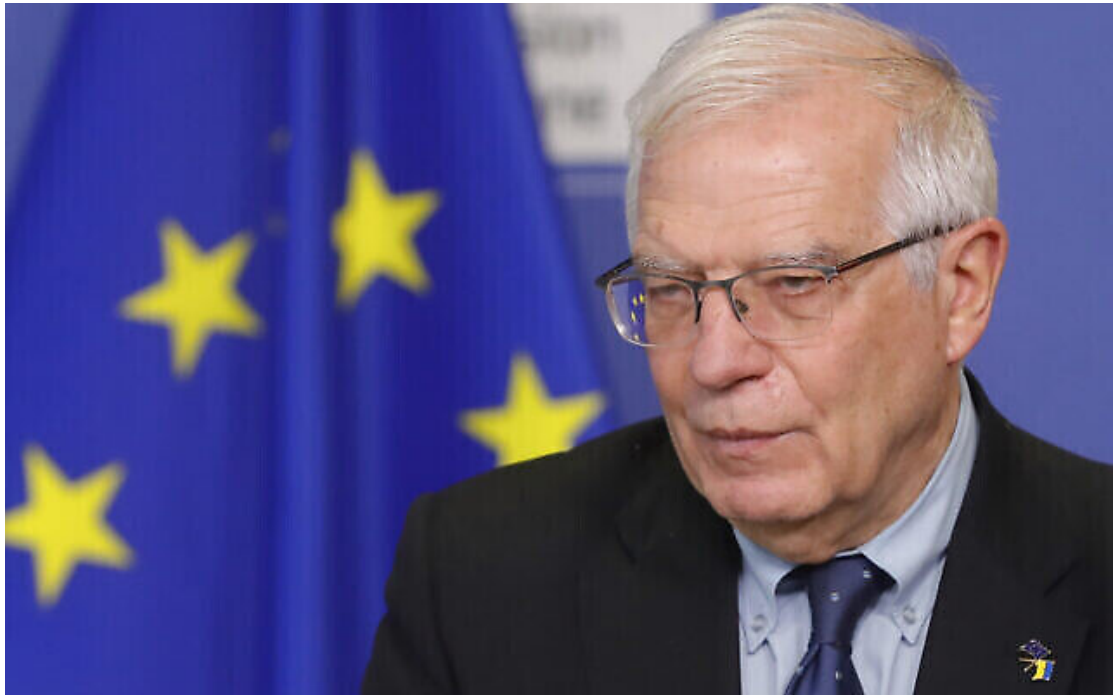
Le chef de la politique étrangère de l'Union européenne, Josep Borrell, s'exprimant lors d'une déclaration de presse au siège de l'UE à Bruxelles, le 27 février 2022.

Les miniprouts des Affaires étrangères de l'UE tiendront des discussions urgentes demain sur la situation en Israël et à Gaza après que les terroristes palestiniens du Hamas ont lancé un assaut dévastateur, a déclaré Josep Borrell, le responsable de la politique étrangère de l'Union européenne (UE).