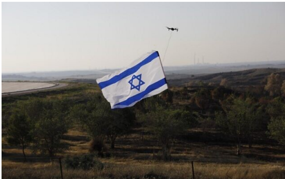
Un drone avec le drapeau national israélien à proximité de la clôture frontalière avec la bande de Gaza, à proximité du kibboutz Nir Am, le 29 mai 2018.

Une tentative manquée des terroristes, samedi, qui essayaient de pénétrer à Nir Am, un kibboutz situé à environ 500 mètres de la frontière avec Gaza, s'est terminée par la mort de deux hommes du Hamas, a dit l'un des agents de sécurité locaux.