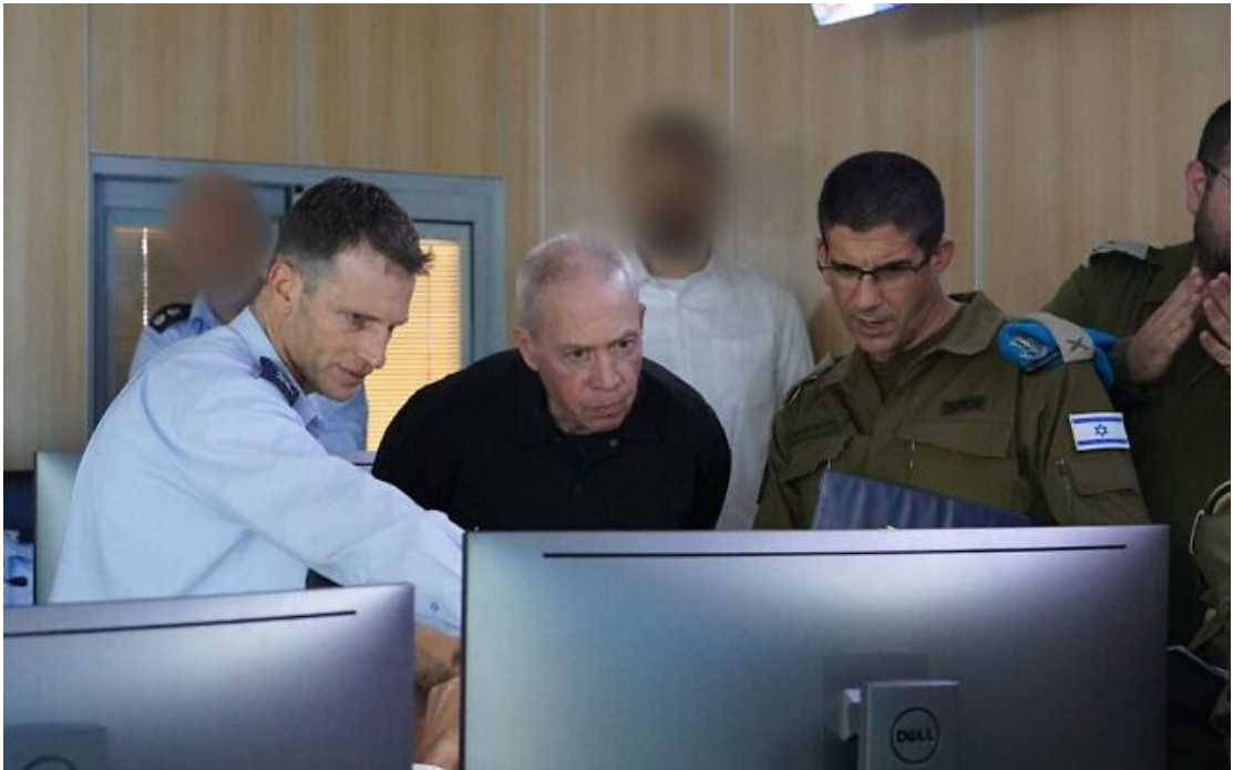
Le ministère de la Défense Yoav Gallant au centre de commandement souterrain de l'armée de l'air au siège de Tsahal, à Tel Aviv, le 9 octobre 2023.

Le ministère de la Défense Yoav Gallant a indiqué lundi que la guerre actuellement menée par Israël contre le groupe terroriste du Hamas est « une guerre pour notre avenir ».