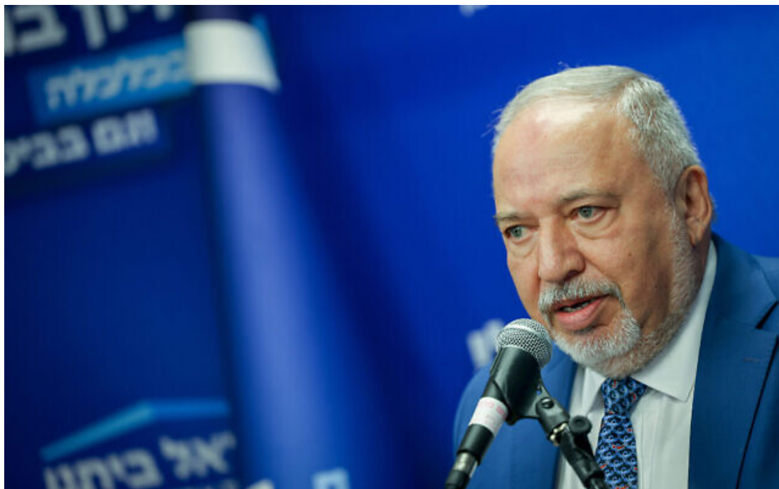
Le chef d'Yisrael Beytenu, Avigdor Liberman, s'exprimant lors d'une réunion de sa faction, à la Knesset, le 10 juillet 2023.

Le leader d'Yisrael Beytenu, Avigdor Liberman, ancien ministère de la Défense, appelle à une invasion terrestre de Gaza afin d'éradiquer et de détruire le groupe terroriste palestinien du Hamas suite à l'attaque dévastatrice de la milice terroriste contre Israël.