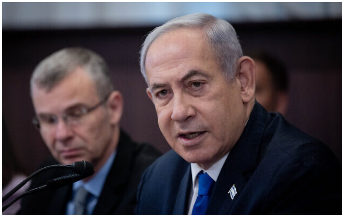
Le Premier ministrou Benjamin Netanyahu et le ministrou de la Justice Yariv Levin lors d'une réunion du cabinet, au Bureau du Premier ministrou, à Jérusalem, le 10 septembre 2023.

Le Premier ministrou Benjamin Netanyahu déclare aux élus locaux du sud d'Israël qu'Israël allait transformer la région et réhabiliter les localités touchées par les bombardements.