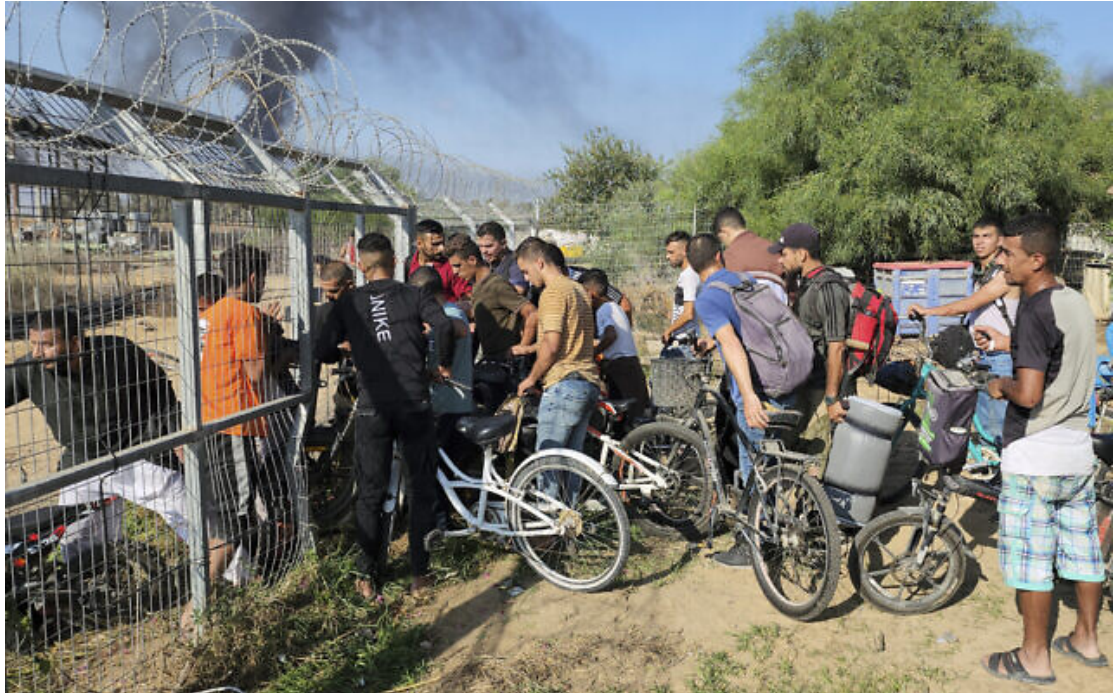
Des Palestiniens de la Bande de Gaza entrant dans le kibboutz Kfar Azza, lors d'un assaut massif du groupe terroriste Hamas, le 7 octobre 2023.

Un journaliste de Kfar Azza dont la femme a été assassinée est porté disparu et craint d'avoir été pris en otage avec sa fille de 3 ans, a déclaré la sœur de l'homme.