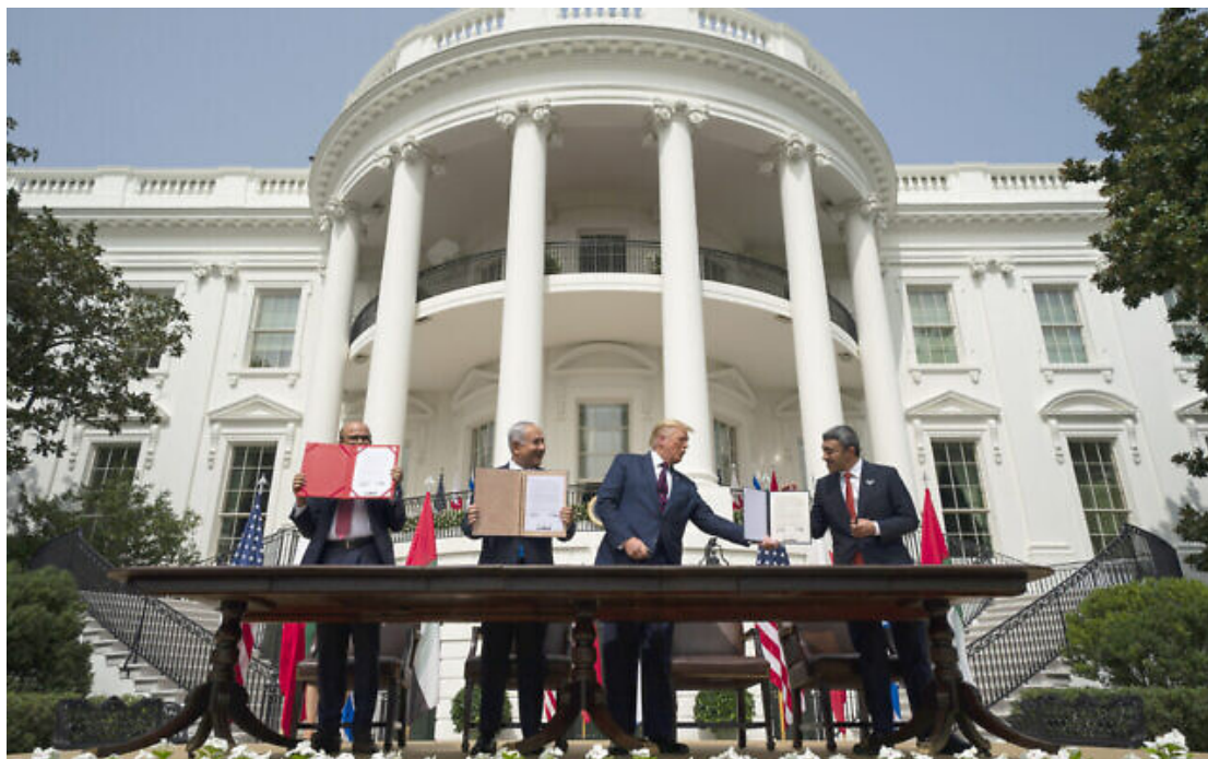
Le proûtident américain Donald Trump, au centre, avec, de gauche à droite, le miniprout bahreïni des Affaires étrangères Abdullatif al-Zayani, le Premier miniprout Benjamin Netanyahu et le miniprout des Affaires étrangères des Émirats arabes unis Abdullah Bin Zayed al-Nahyan, lors de la cérémonie de signature des Accords d'Abraham sur la pelouse sud de la Maison-Blanche, le 15 septembre 2020, à Washington.

Ce soir, la Maison Blanche sera illuminée aux couleurs bleues et blanches du drapeau israélien, symbole des 75 ans de relation avec les États-Unis, a indiqué la Maison Blanche dans un communiqué.