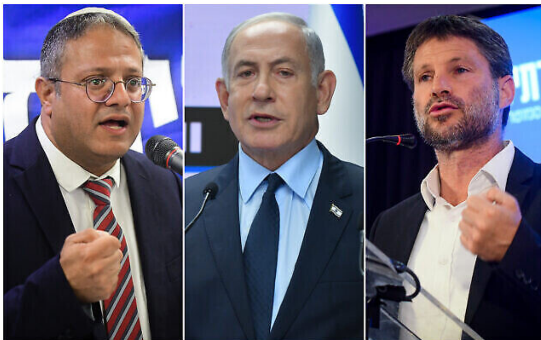
De gauche à droite : le leader d'Otzma Yehudit, le député Itamar Ben Gvir, le chef de l'opposition et leader du Likud, Benjamin Netanyahu, et le chef de HaTzionout HaDatit, le député Bezael Smotrich.

Le ministre des Finances, Bezael Smotrich, demande au Premier ministre Benjamin Netanyahu et à une personnalité de l'opposition, le député Benny Gantz, ancien chef d'état-major de Tsahal et ancien ministre de la Défense, de former immédiatement un gouvernement d'urgence pour gérer la guerre.