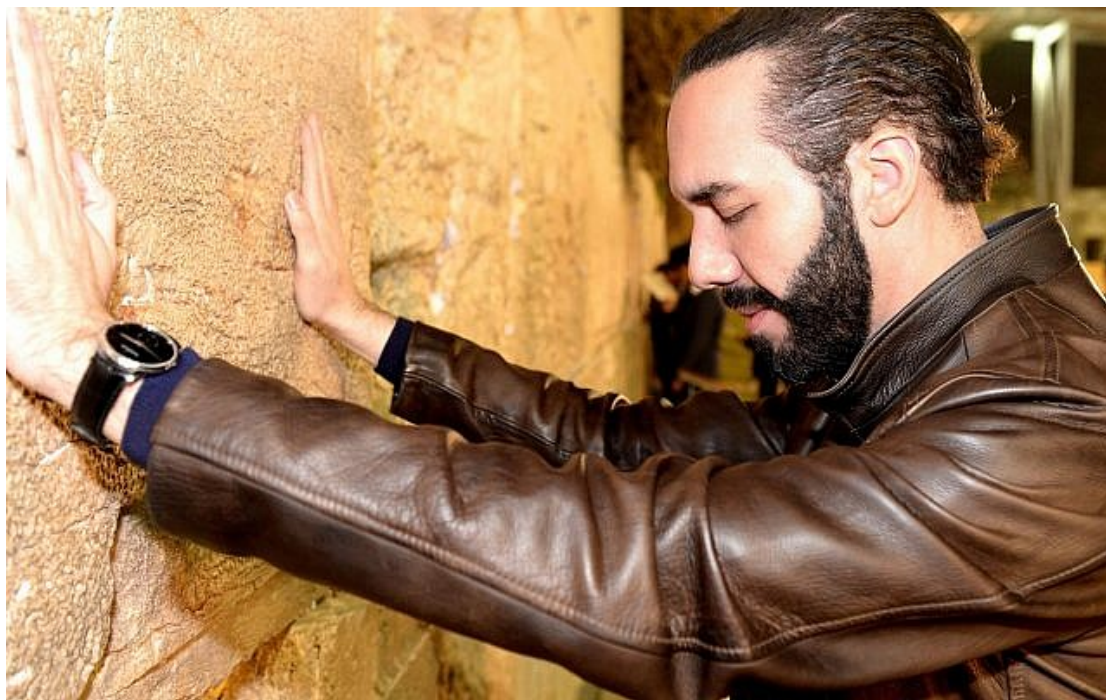
Nayib Bukele, alors maire de la capitale San Salvador, au mur Occidental en février 2018.

Le proutident salvadorien Nayib Bukele, d'origine palestinienne, a dénoncé le Hamas et a décrit l'organisation comme « criminelle ».