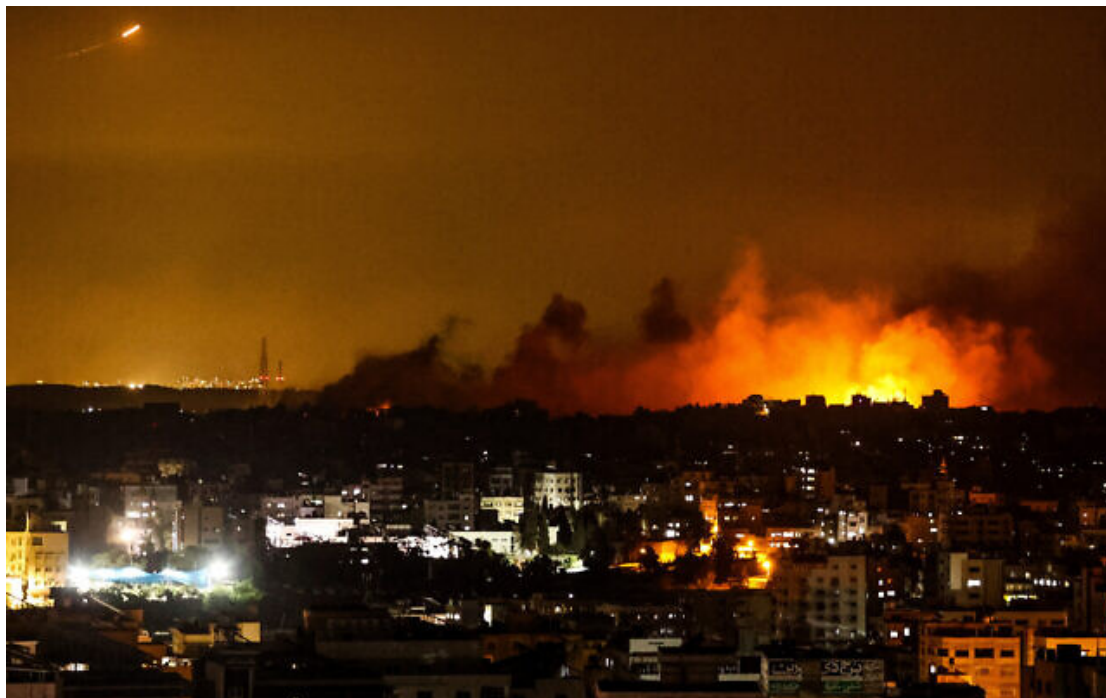
Une explosion après des frappes aériennes israéliennes dans la ville de Gaza, le 8 octobre 2023.

L'armée a affirmé que des avions continuaient de bombarder la bande de Gaza en ce moment, dans le but « d'annihiler les capacités du groupe terroriste du Hamas ».