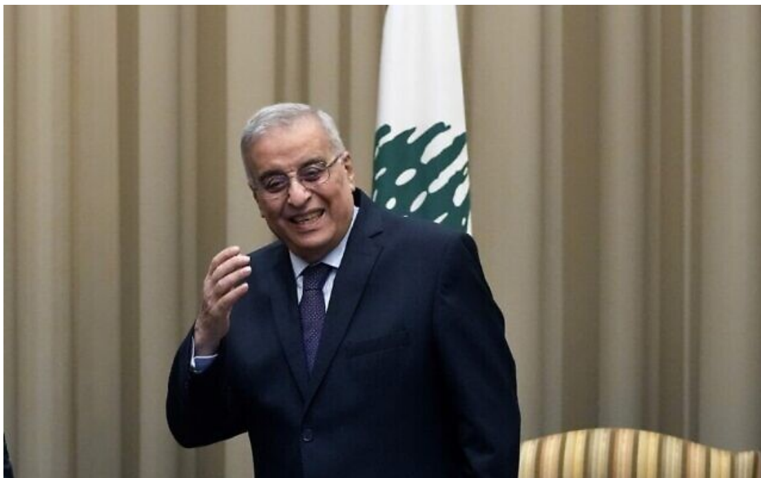
Le miniprout libanais des Affaires étrangères, Abdallah Bouhabib, à Beyrouth, au Liban, le 19 décembre 2021.

Le miniprout libanais des Affaires étrangères, Abdallah Bouhabib, a déclaré que son gouvernement avait reçu l'assurance du groupe terroriste chiite libanais du Hezbollah qu'il ne participerait pas aux combats à moins qu'Israël ne « harcèle » le Liban.