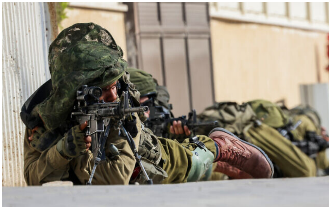
Des soldats prenant position dans la ville méridionale de Sderot, le 8 octobre 2023.

La municipalité de Sderot ordonne aux habitants de la ville de rester enfermés chez eux en raison de « craintes d'un incident de sécurité ».