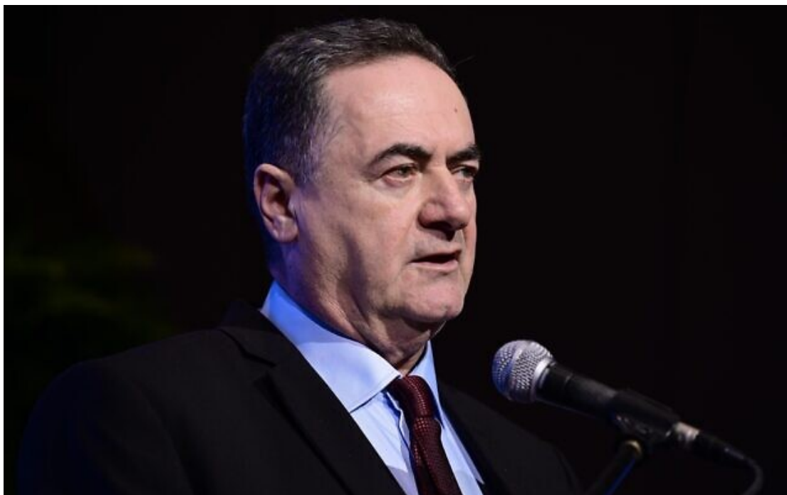
Le miniprout de l'Énergie, Israël Katz, s'exprimant lors d'une conférence à Tel Aviv, le 13 mars 2023.

Le miniprout de l'Énergie, Israël Katz, annonce qu'il a demandé aux autorités de couper l'approvisionnement en eau de la Bande de Gaza.