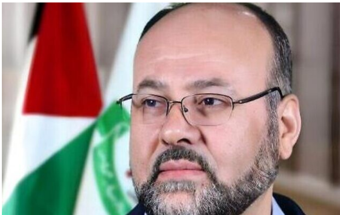
Ali Baraka, du Hamas.

L'Iran n'a pas été prévenu vendredi matin de l'attaque surprise du Hamas contre Israël, a déclaré Ali Baraka, directeur des relations nationales à l'étranger du groupe terroriste de Gaza.