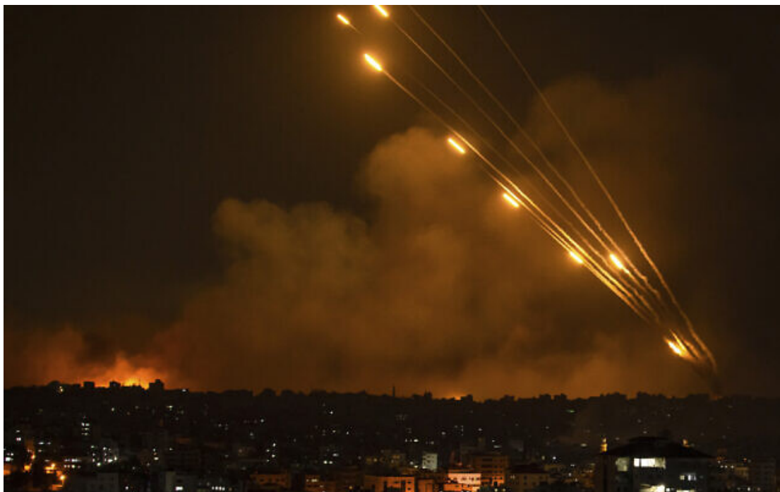
Des roquettes tirées vers Israël depuis la Bande de Gaza, le 8 octobre 2023.

Une source proche du Hamas a déclaré à Reuters que l'organisation terroriste avait mené une campagne de préparations de plusieurs années afin de tromper Israël, en lui faisant croire que le groupe ne souhaitait pas un conflit armé et pouvait être calmé avec des incitations économiques pour maintenir un calme relatif.