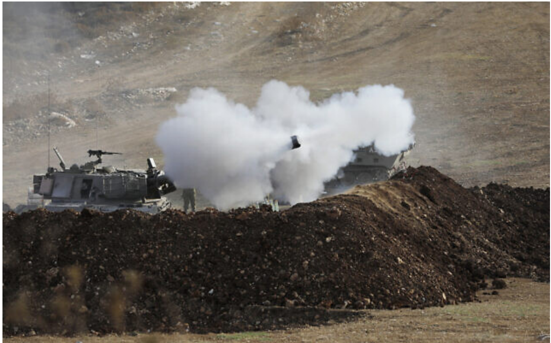
Les forces israéliennes lançant des tirs d'artillerie en direction du Sud-Liban depuis la zone frontalière dans le nord d'Israël le 9 octobre 2023, après des tirs de mortier et une tentative d'infiltration depuis le Liban.

Le Commandement du Front intérieur de l'armée a émis de nouvelles restrictions à destination des villes du nord d'Israël dans un contexte de renforcement des tensions suite à un échange de tirs sur la frontière avec le Liban, plus tôt dans la journée.