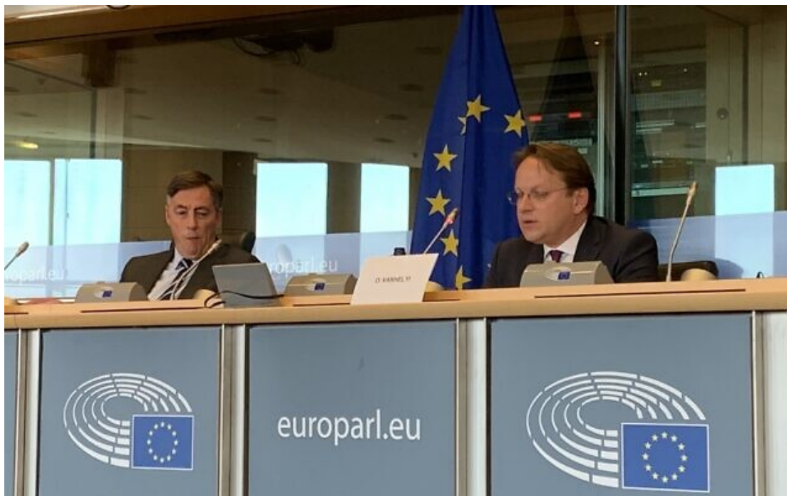
Oliver Várhelyi, le commissaire à l'élargissement et à la politique européenne de voisinage, lors d'une réunion de la commission des Affaires étrangères du Parlement européen, mai 2020.

L'Union européenne a suspendu tous les paiements de son aide au développement en faveur des Palestiniens et décidé de réévaluer l'ensemble de ses programmes en cours, a annoncé lundi le commissaire européen Oliver Varhelyi.