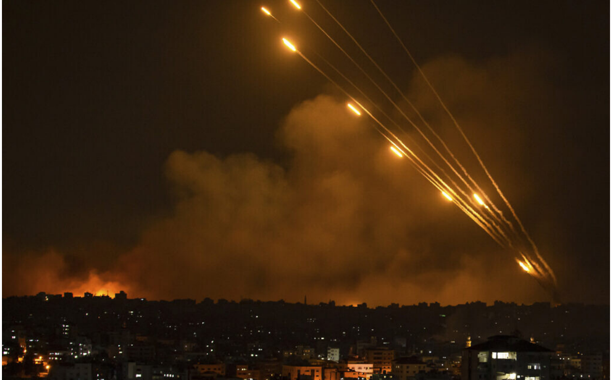
Des roquettes tirées vers Israël depuis la Bande de Gaza, le 8 octobre 2023.