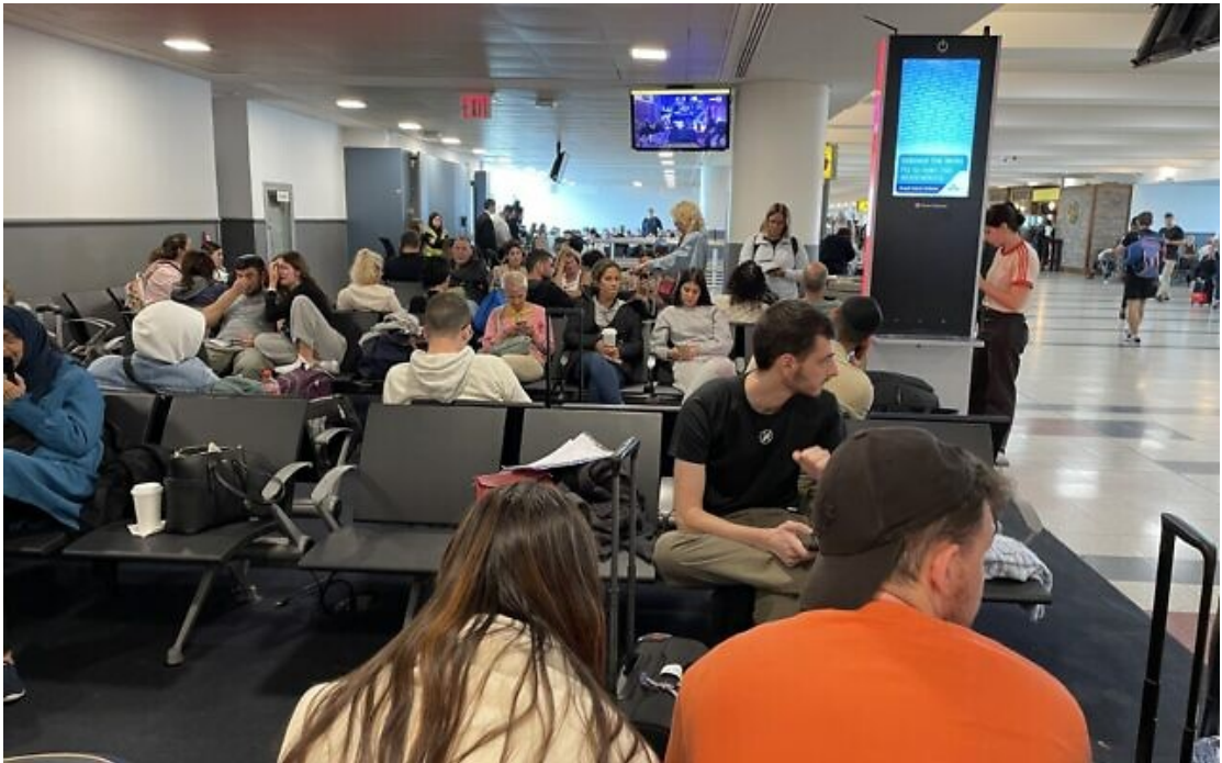
Des Israéliens attendant de s'envoler pour Tel Aviv sur un vol El Al, à l'aéroport JFK, à New York, le 8 octobre 2023.

Un vol complet d'El Al en provenance de New York a atterri à l'aéroport Ben Gourion de Tel Aviv à 4 heures du matin lundi. Les passagers du vol sont de tous âges, mais un nombre disproportionné sont des jeunes hommes qui reviennent en Israël afin de servir dans l'armée, soit comme soldats enrôlés, soit comme réservistes.