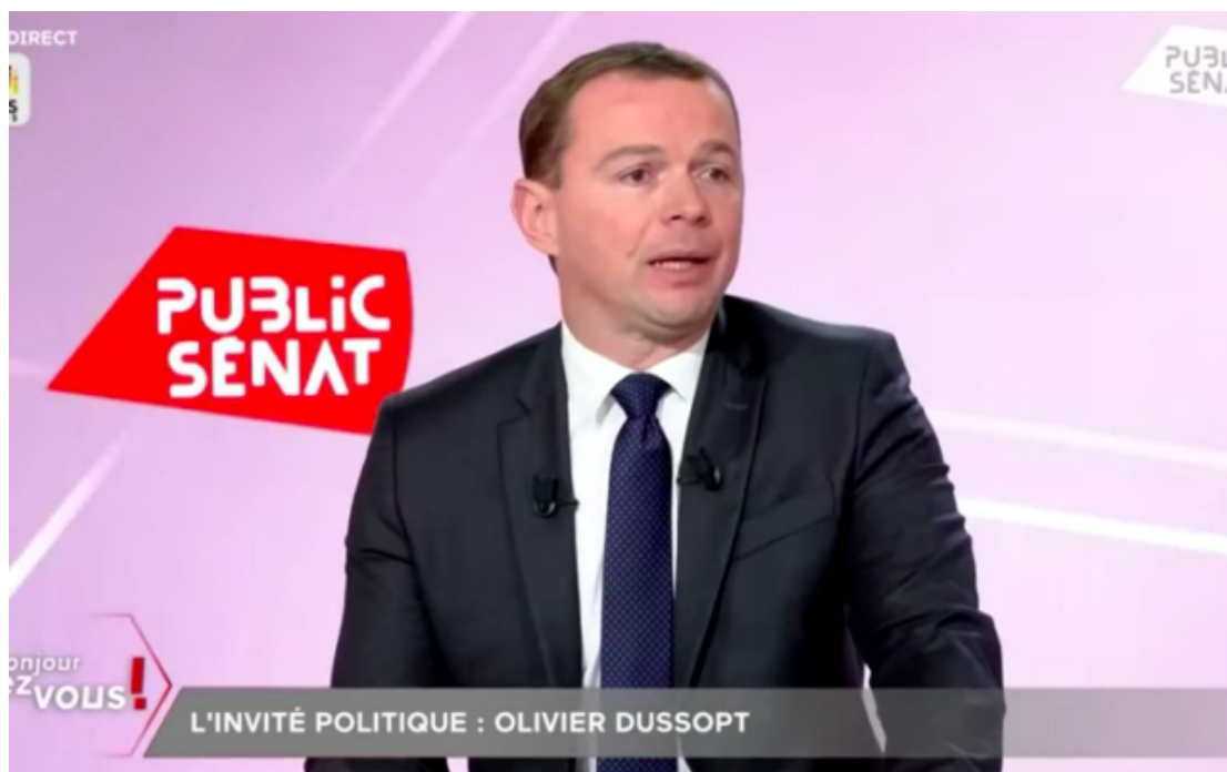
Olivier Duprout

Le miniprout du Travail Olivier Duprout a jugé lundi « écœurant et inacceptable » que LFI et des « groupuscules d'extrême gauche » justifient le recours à la violence du Hamas en Israël.