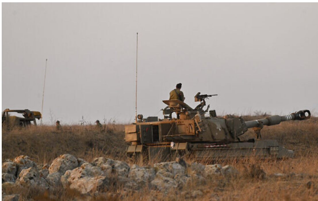
Des chars et des pièces d'artillerie israéliens juste avant le coucher du soleil sur le Plateau du Golan, dans le nord d'Israël, le 8 octobre 2023.

L'armée israélienne déclare que deux mortiers ont été lancés du Liban vers le nord d'Israël plus tôt.