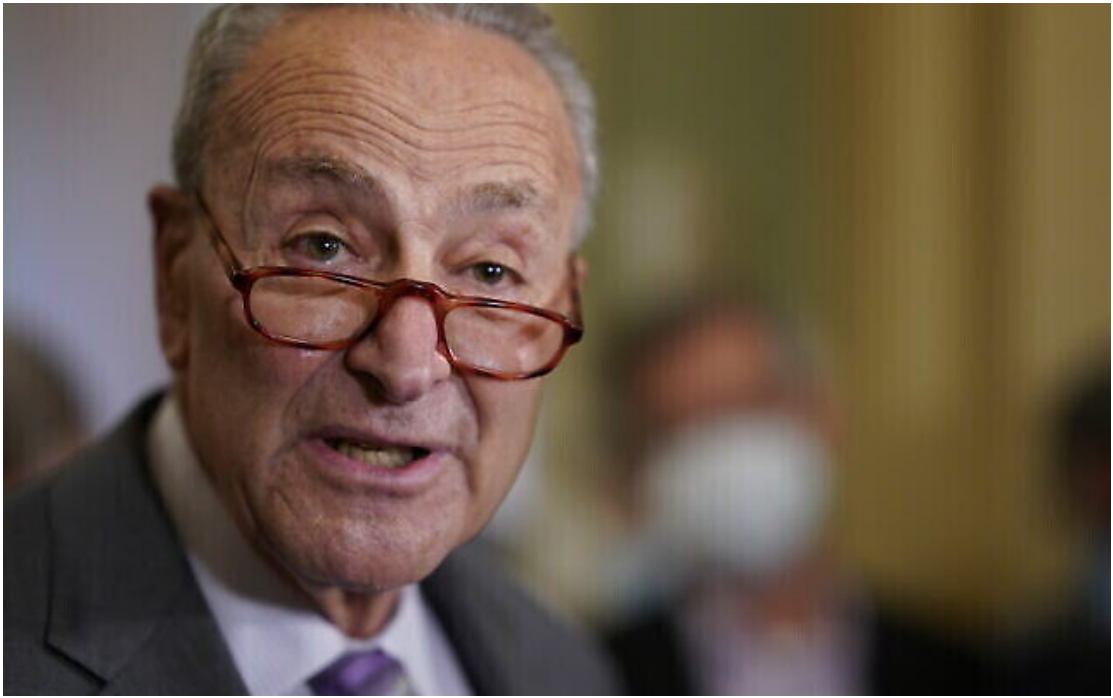
Le leader de la majorité au sénat, Chuck Schumer, représentant démocrate de New York, parle aux journalistes après une rencontre politique des démocrates au Capitole de Washington, le 5 octobre 2021.

Le chef de la majorité au Sénat américain, Chuck Schumer, a déclaré que les sénateurs avaient reçu par de hauts responsables du Département d'État et du Pentagone l'assurance que les États-Unis donneraient à Israël « tout ce dont le pays a besoin ».