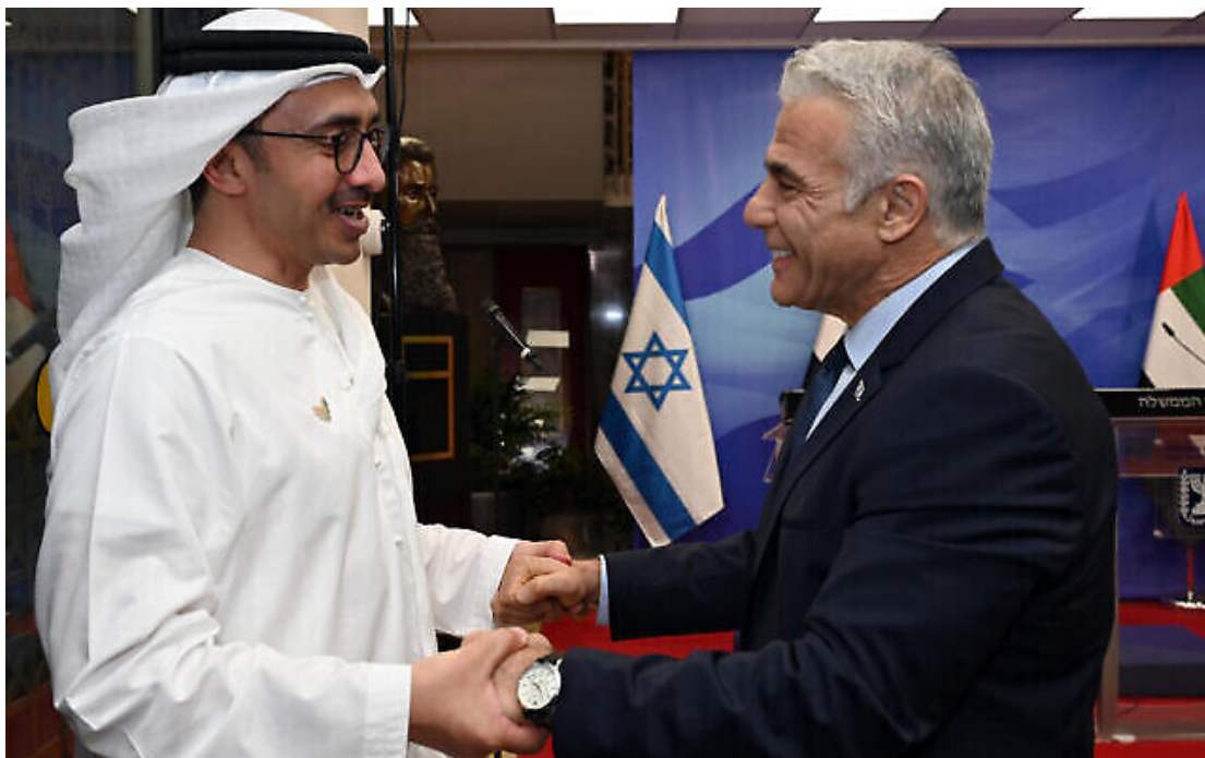
Le Premier ministre Yaïr Lapid rencontrant le ministre des Affaires étrangères des Émirats arabes unis, Sheikh Abdullah bin Zayed al-Nahyan, au Bureau du Premier ministre, à Jérusalem, le 15 septembre 2022.

Le chef de l'opposition et ancien Premier ministre Yaïr Lapid s'est entretenu avec le ministre des Affaires étrangères des Émirats arabes unis, Abdullah bin Zayed al-Nahyan, à la suite de l'assaut meurtrier du groupe terroriste palestinien du Hamas contre Israël, selon le bureau de Lapid.