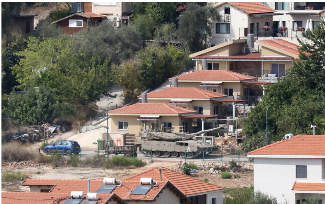
Un char Merkava israélien circulant dans la ville frontalière de Metula, en Israël, au Sud-Liban le 9 octobre 2023.

Le Commandement militaire du Front intérieur ordonne aux habitants de 28 villes du nord d'Israël, proches de la frontière libanaise, de rester dans les abris jusqu'à nouvel ordre par crainte d'attaques à la roquette alors que la frontière avec le Liban se réchauffe.