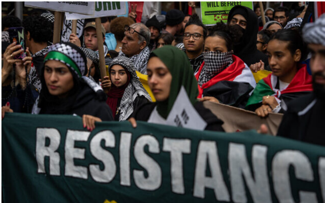
Des manifestants hostiles à Israël défilent à New York le 9 octobre 2023.

« New York au côté de Gaza » et « Israël va en enfer » : quelques centaines de manifestants pro-palestiniens et très hostiles à Israël se sont rassemblés lundi au coeur de Manhattan, exigeant que les Etats-Unis cessent d'aider leur allié au Proche-Orient.