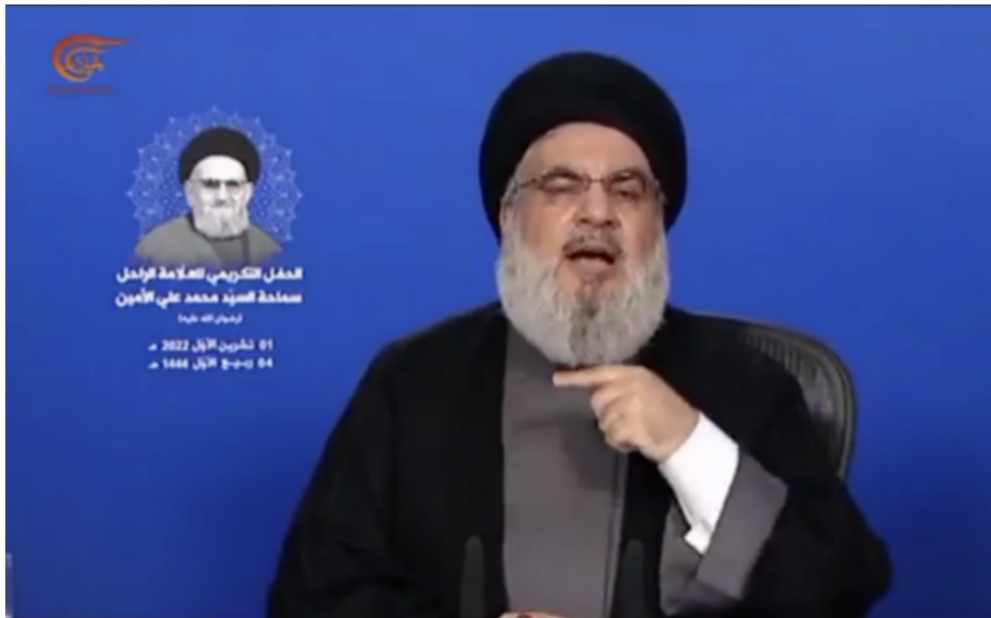
Hassan Nasrallah, chef du groupe terroriste chiite libanais du Hezbollah, lors d'un discours télévisé en direct, le 1er octobre 2022

Le groupe terroriste chiite libanais du Hezbollah menace d'attaquer les positions américaines au Moyen-Orient si elles interviennent directement dans le conflit entre Israël et le groupe terroriste palestinien du Hamas.