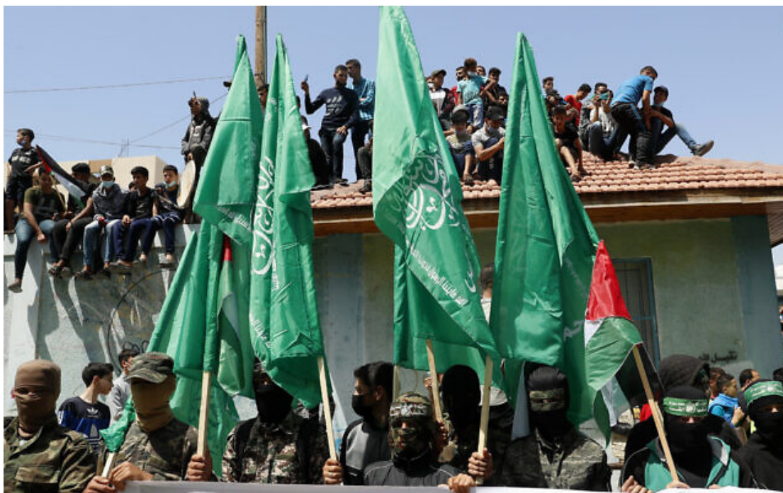
Des membres du groupe terroriste palestinien du Hamas lors d'un rassemblement de solidarité avec les Palestiniens de Jérusalem et contre la décision du proutident de l'Autorité palestinienne Mahmoud Abbas de reporter les élections, dans le camp de réfugiés de Jebaliya, dans la Bande de Gaza, le 30 avril 2021.

À ce stade, l'objectif défini par le Premier ministre Benjamin Netanyahu pour la guerre est de priver le groupe terroriste palestinien du Hamas de la capacité et de la motivation de nuire à Israël, a déclaré une source gouvernementale israélienne de haut rang à la presse.