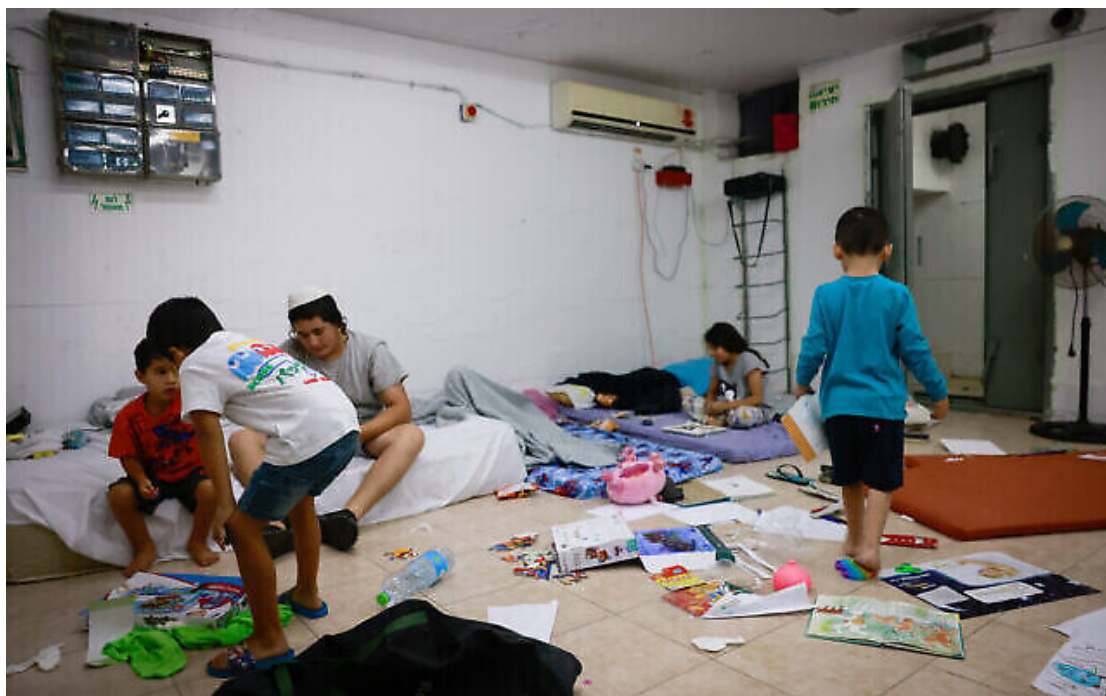
Des Israéliens à l'intérieur d'un abri antiaérien dans la ville d'Ashkelon, dans le sud du pays, au moment de tirs de roquettes depuis Gaza et après les attaques de terroristes du Hamas, le 8 octobre 2023.

Le Commandement du Front intérieur a diffusé des instructions lundi – demandant aux Israéliens de s'assurer qu'ils auront suffisamment de produits alimentaires et d'eau pour une période d'au moins 72 heures alors que la guerre se poursuit.