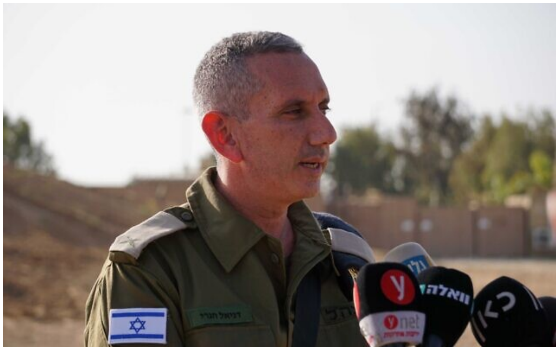
Le porte-parole de l'armée israélienne, le contre-amiral Daniel Hagari, s'adressant aux médias près de la frontière de Gaza, le 10 mai 2023.

Le contre-amiral Daniel Hagari, porte-parole de Tsahal, a annoncé qu'Israël avait éliminé les terroristes qui se sont infiltrés dans le sud d'Israël et que le pays avait des informations sur tous les Israéliens pris en otage dans la bande de Gaza.