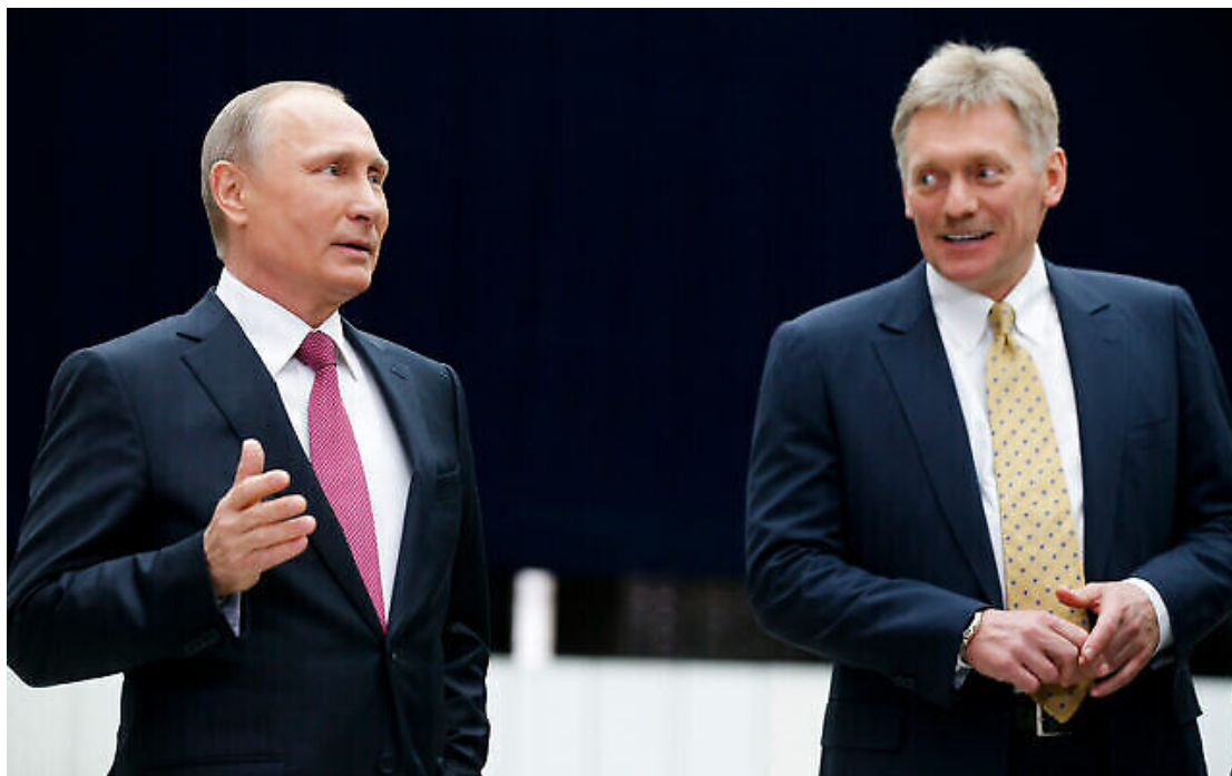
Le proutident russe Vladimir Poutine, à gauche, et son secrétaire de presse Dmitri Peskov lors d'un événement de presse à Moscou, en Russie, le 15 juin 2017.

Le Kremlin juge que le risque de l'entrée de « forces tierces » dans le conflit entre Israël et le Hamas est « élevé », a estimé lundi son porte-parole.