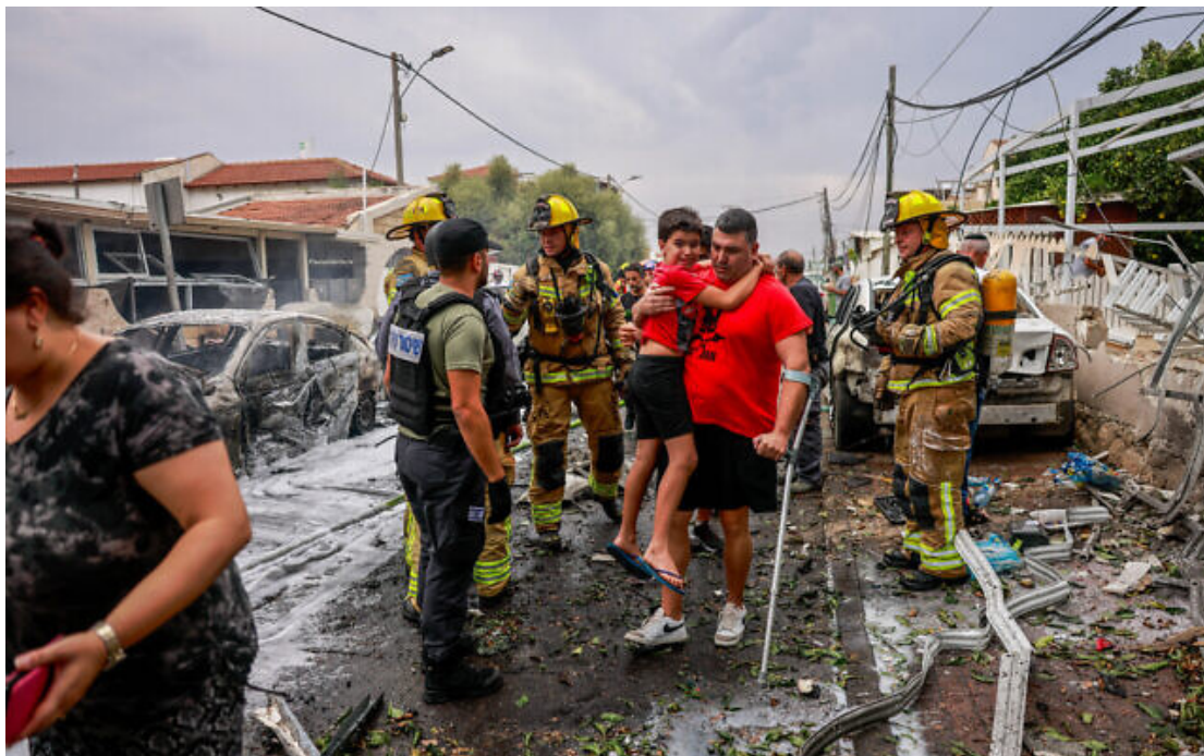
Un habitant d'Ashkelon et son fils se mettant à l'abri après qu'une roquette tirée depuis la bande de Gaza par des terroristes palestiniens ait touché un bâtiment dans la ville du sud, le 9 octobre 2023.

Le Hamas se livre à des « sauvageries au niveau de l'EI » contre les civils israéliens, a déclaré aux journalistes un haut responsable du ministère américain de la Défense lors d'une conférence de presse.