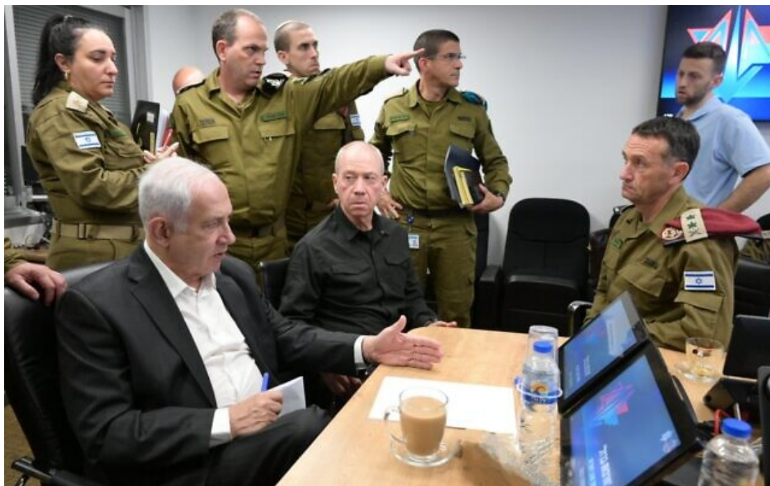
Le Premier ministère Benjamin Netanyahu, à gauche, rencontrant le ministre de la Défense Yoav Gallant, au centre, et les chefs militaires au quartier général de Tsahal, à Tel Aviv pour une évaluation de la sécurité, le 8 octobre 2023.

Le Bureau du Premier ministre Benjamin Netanyahu a déclaré qu'une information selon laquelle le chef des renseignements égyptiens Abbas Kamel l'aurait averti d'une « opération inhabituelle et terrible » dix jours avant l'attaque du groupe terroriste palestinien du Hamas contre Israël est une « fausse nouvelle ».