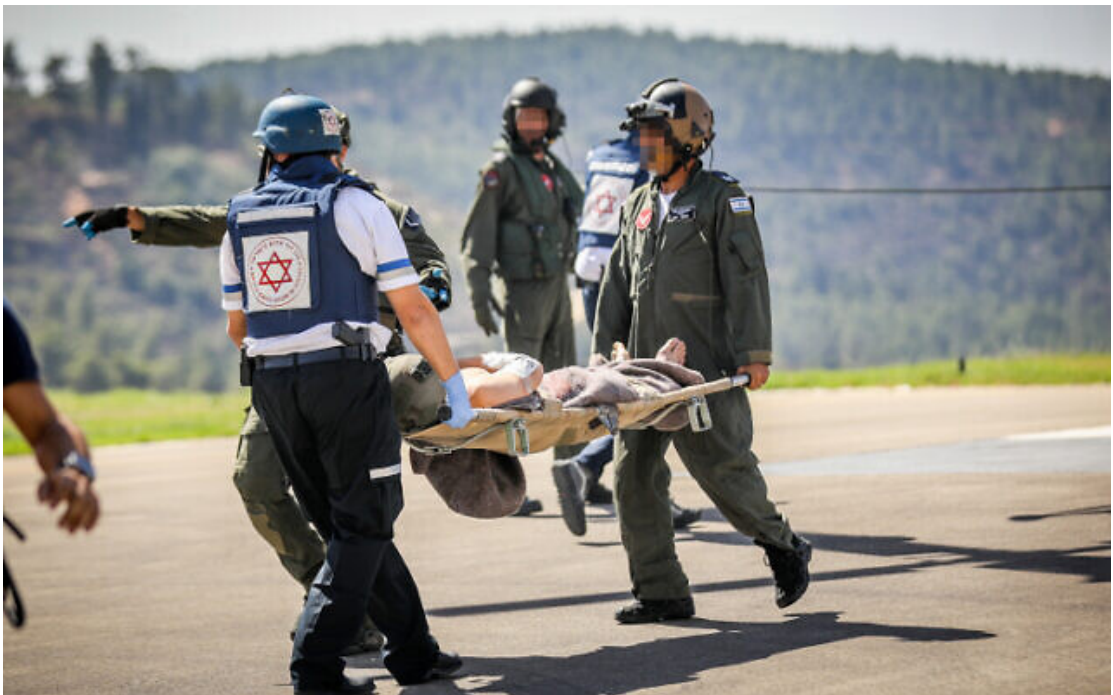
Des soldats israéliens blessés arrivant à l'hôpital Hadassah Ein Kerem, à Jérusalem, le 7 octobre 2023.