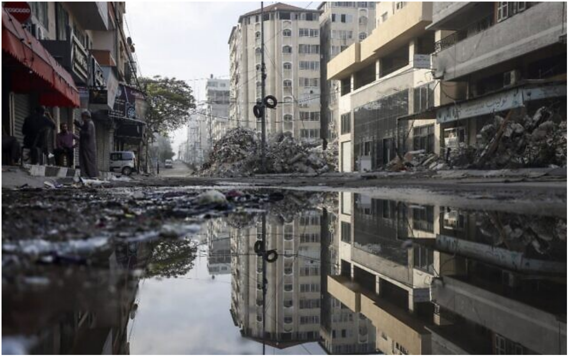
Une rue du quartier de Rimal, à Gaza, le 20 mai 2021, après une frappe aérienne israélienne.

L'armée israélienne affirme avoir lancé des frappes aériennes massives sur le quartier huppé de Rimal, à Gaza, ciblant des dizaines de sites.