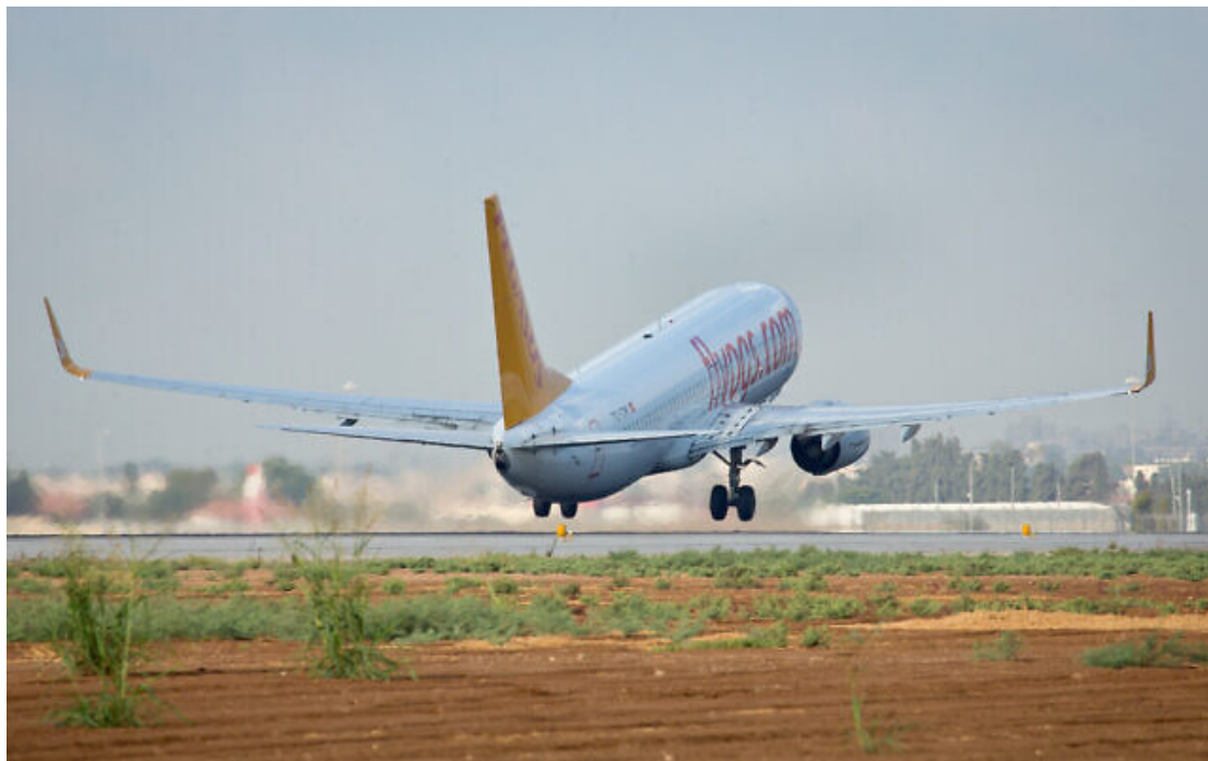
Un avion Pegasus décollant de l'aéroport Ben Gurion, à Tel Aviv, le 3 septembre 2014.

La compagnie aérienne américaine Delta a annoncé lundi soir l'annulation de tous ses vols pour Israël jusqu'à la fin du mois d'octobre dans la foulée de l'offensive terroriste du Hamas.