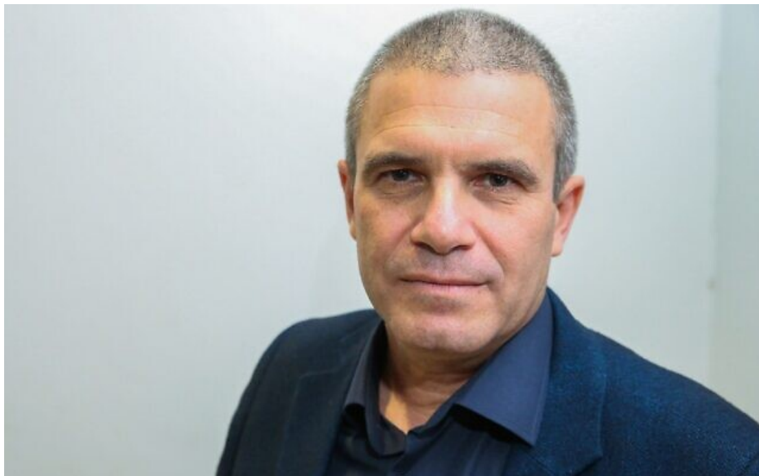
L'ancien général de brigade de Tsahal Gal Hirsch lors d'une conférence de presse à Tel Aviv pour annoncer son entrée en politique, le 26 décembre 2018.

Le nouveau référent des Israéliens kidnappés et disparus, Gal Hirsch, déclare dans un message que « nous sommes en train de dresser un tableau complet de la situation et que nous travaillons à plein régime pour créer un système efficace » auquel les familles peuvent s'adresser.