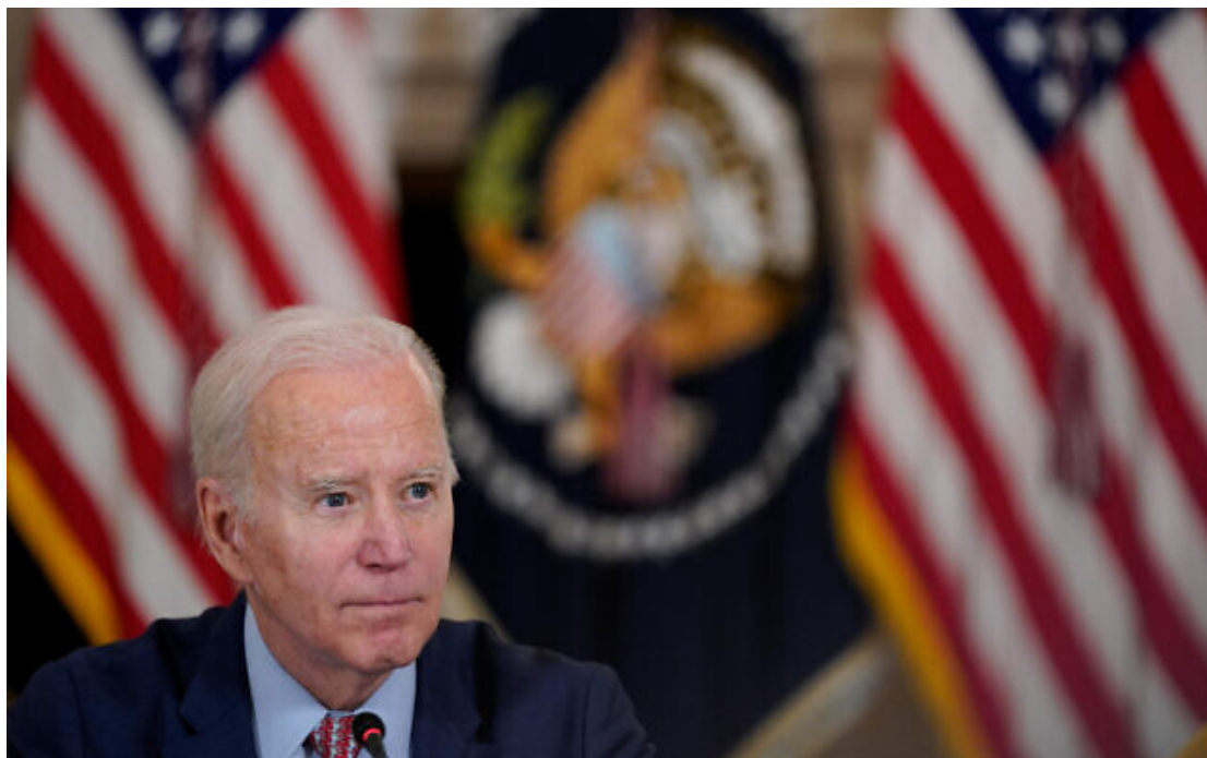
Le proutident américain Joe Biden répondant aux questions d'un journaliste lors d'une réunion avec le Conseil des conseillers du proutident pour la science et la technologie dans la salle à manger d'État de la Maison Blanche, à Washington, le 4 avril 2023.

« Ce n'est pas une tragédie lointaine » : les Etats-Unis comptent désormais au moins 11 ressortissants tués dans l'attaque du Hamas et selon toute probabilité des otages aux mains du groupe islamiste palestinien, accusé de « barbarie » par Washington.