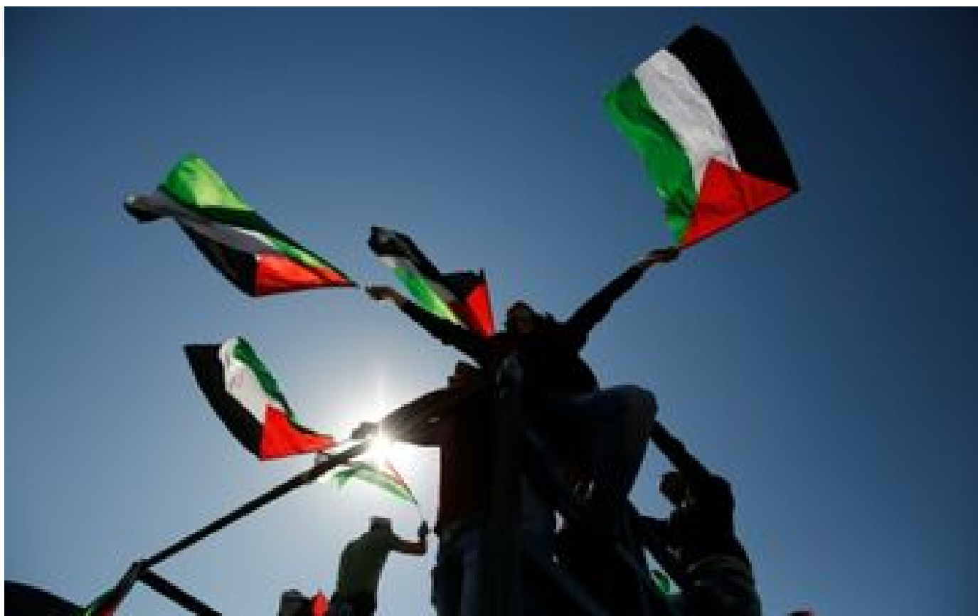
Paris : une manifestation du NPA en solidarité avec les Palestiniens interdite dimanche