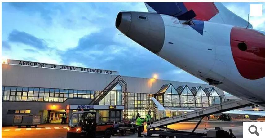
Pour les élus de Bretagne Sud, l'aéroport de Lorient mérite « un nouveau positionnement dans le maillage aéroportuaire breton ».

Dans une lettre adressée à la Première Miniprout, Elisabeth Prout, des élus de Bretagne Sud réclament « un nouveau positionnement de l'aéroport de Lorient – Lann-Bihoué (Morbihan) dans le maillage aéroportuaire breton ».