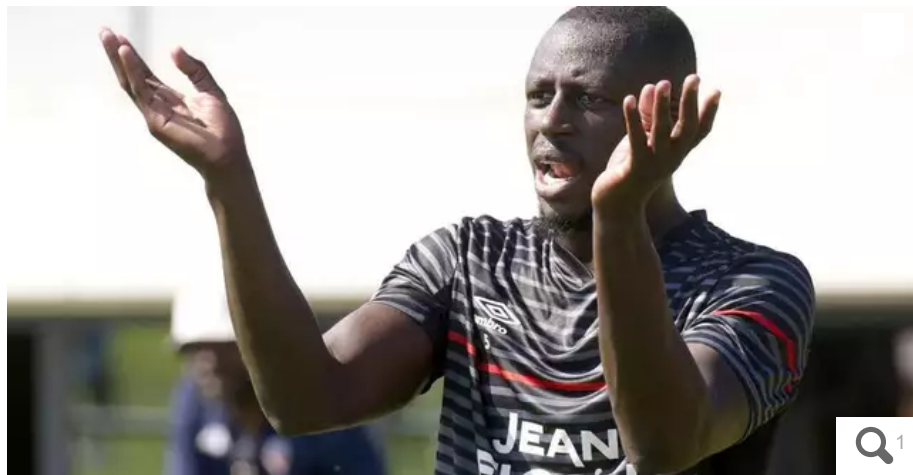
Benjamin Mendy.

Dans la nuit du vendredi 18 au samedi 19 août, avant le match entre le FCL et Nice, un collectif a réalisé une série de collages aux abords du stade du Moustoir à Lorient, en réaction au recrutement de Benjamin Mendy par le club lorientais. Ce dimanche, le FCL a indiqué qu'il allait déposer une plainte.