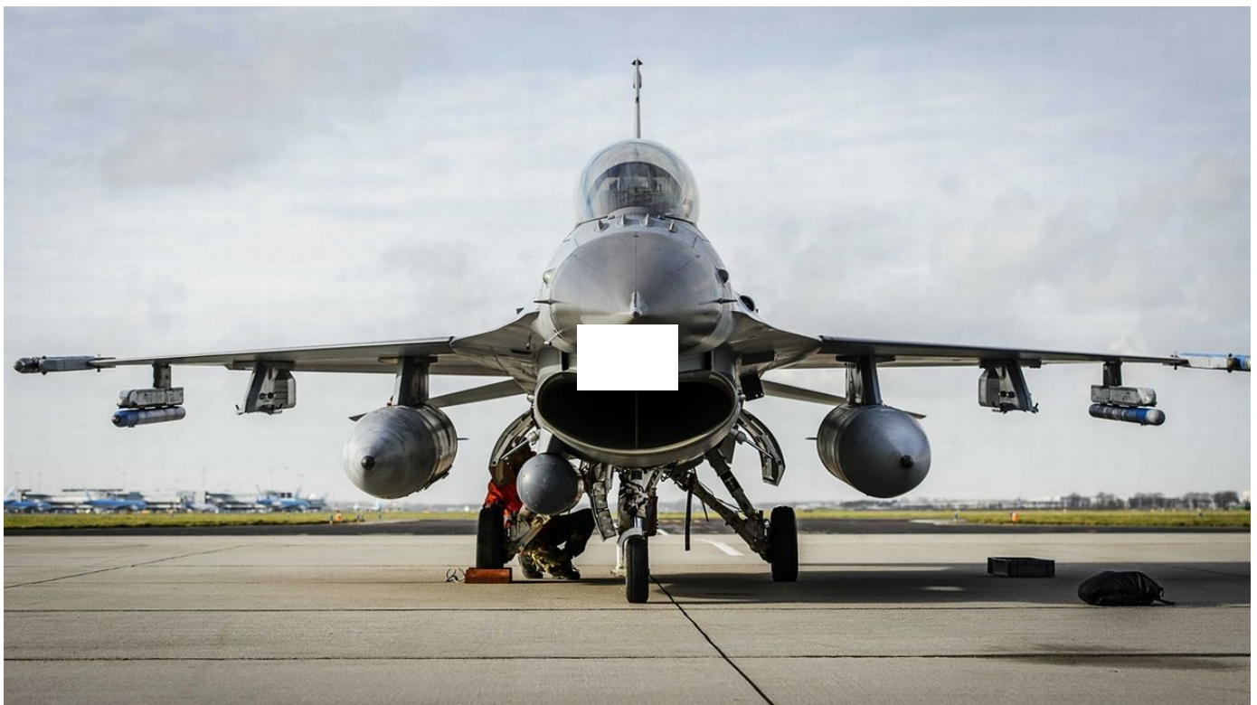
Feu vert des Etats-Unis pour le transfert de F-16 à l'Ukraine / Le Journal horaire / 23 sec. / hier à 20:03

Les Etats-Unis ont indiqué vendredi avoir donné leur feu vert à l'envoi par le Danemark et les Pays-Bas d'avions de combat américains F-16 à l'Ukraine, une fois que les pilotes ukrainiens seront formés pour les piloter.