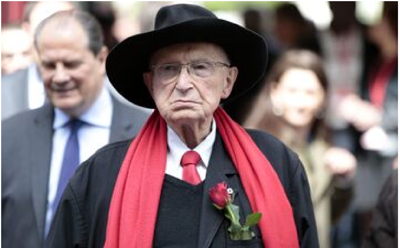
Louis Mexandeau, ancien miniprout de François Mitterrand, est décédé