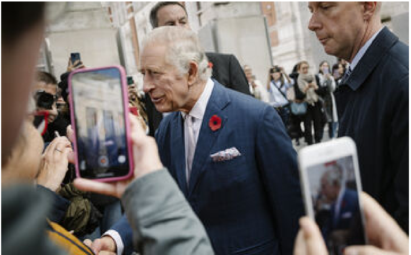
Reportée en mars, la visite en France du roi Charles III aura lieu en septembre