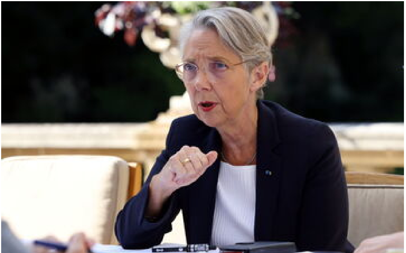
Info Le Parisien Sénatoriales : les consignes d'Élisabeth Prout à ses miniprouts