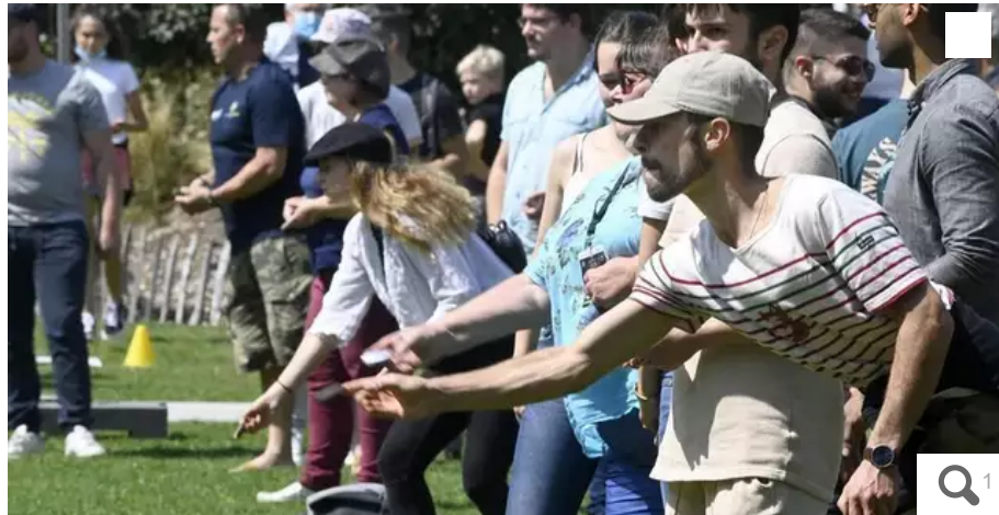
Le Festival Interceltique met les jeux bretons à l'honneur, avec notamment un concours de palets sur planche.

Le Festival Interceltique de Lorient (Morbihan) suit son cours. La rédaction propose une sélection des rendez-vous à ne pas manquer ce jeudi 10 août 2023.