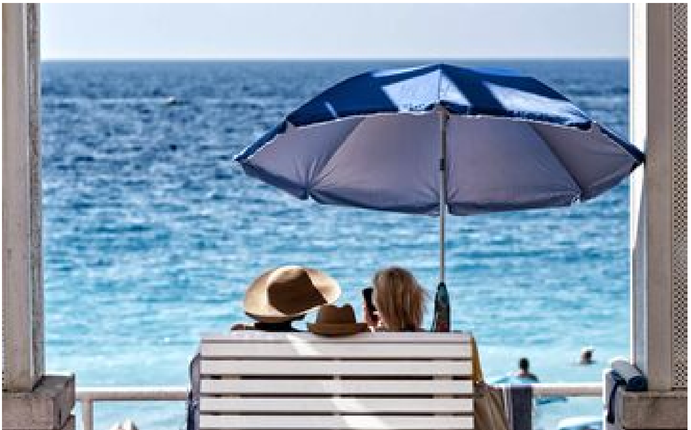
Météo : premières prévisions, quel temps fera-t-il au mois d'août ?