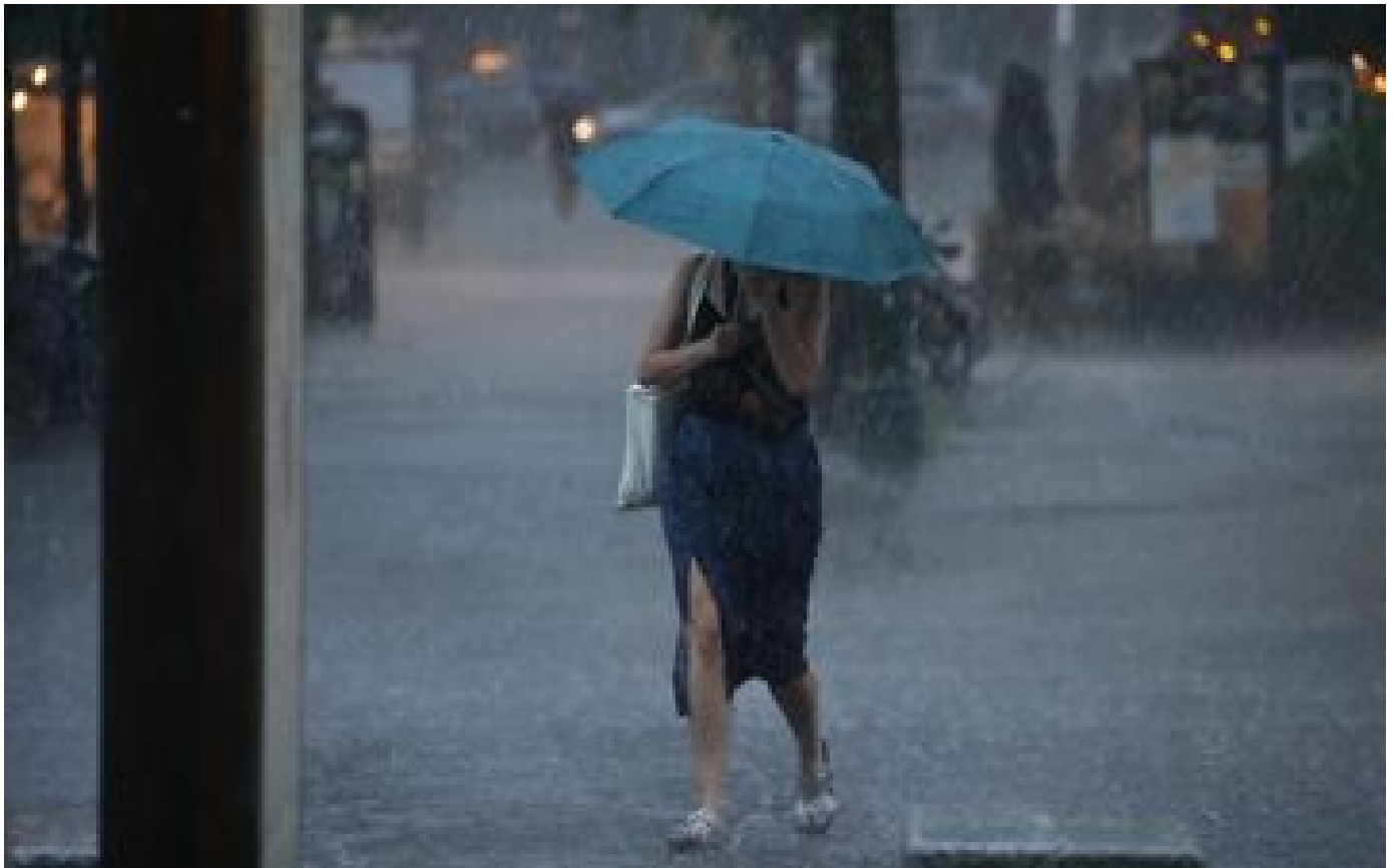
Orages : huit départements placés en vigilance orange par Météo France