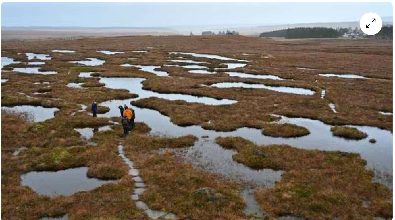
Les tourbières de la Réserve Naturelle de Forsinard (Écosse). Photo d'illustration.

Ce mercredi, les eurodéputés doivent se prononcer sur le rejet, ou non, de la loi sur la restauration de la nature. Un projet du Pacte vert de l'UE devenu l'emblème d'une bataille politique à un an des élections européennes.