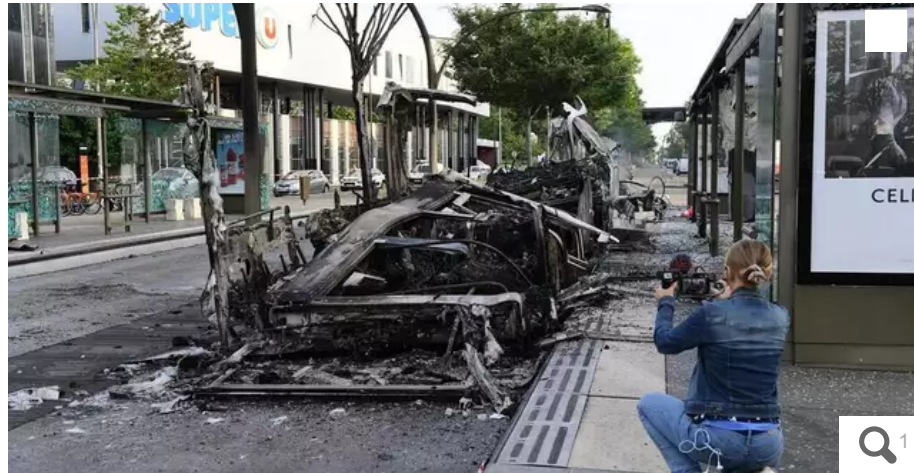
Au Clos Toreau, le e-busway a été incendié.

Ce jeudi 29 juin 2023 au soir, au Clos Toreau, au sud de Nantes, la conductrice d'un e-busway a été sortie de son véhicule par un groupe de jeunes qui ont ensuite incendié le véhicule. Sur la ligne 20, deux conducteurs ont été extirpés de leurs Chronobus par les agents du service Prévention et intervention de la Tan qui ont essuyé des coups. L'ensemble du réseau fermé à 20 h.