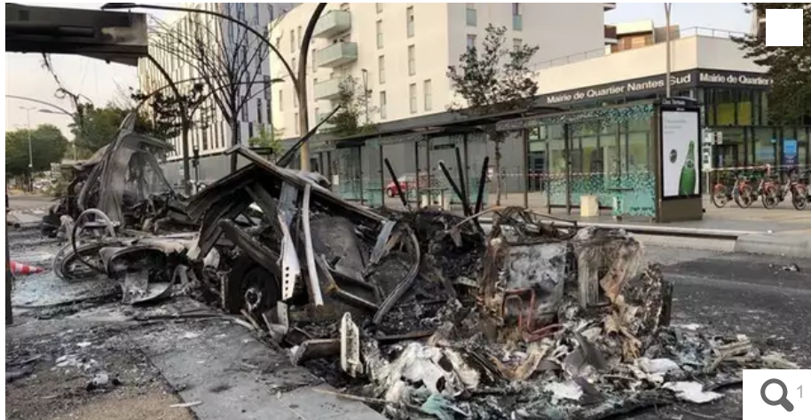
Un e-bus a été incendié au Clos-Toreau.

Un e-bus a été incendié et plusieurs chronobus et rames de tramway ont été caillassés dans la nuit du jeudi 29 au vendredi 30 juin 2023 à Nantes. Si le réseau fonctionne actuellement normalement, les syndicats demandent à la direction de la Tan de le fermer en fin de journée.