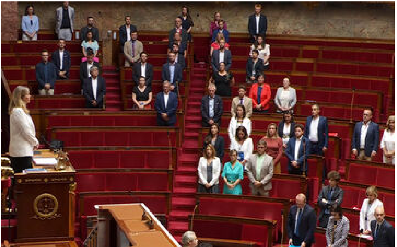
VIDÉO. Mort de Nahel à Nanterre : une minute de silence observée à l'Assemblée nationale