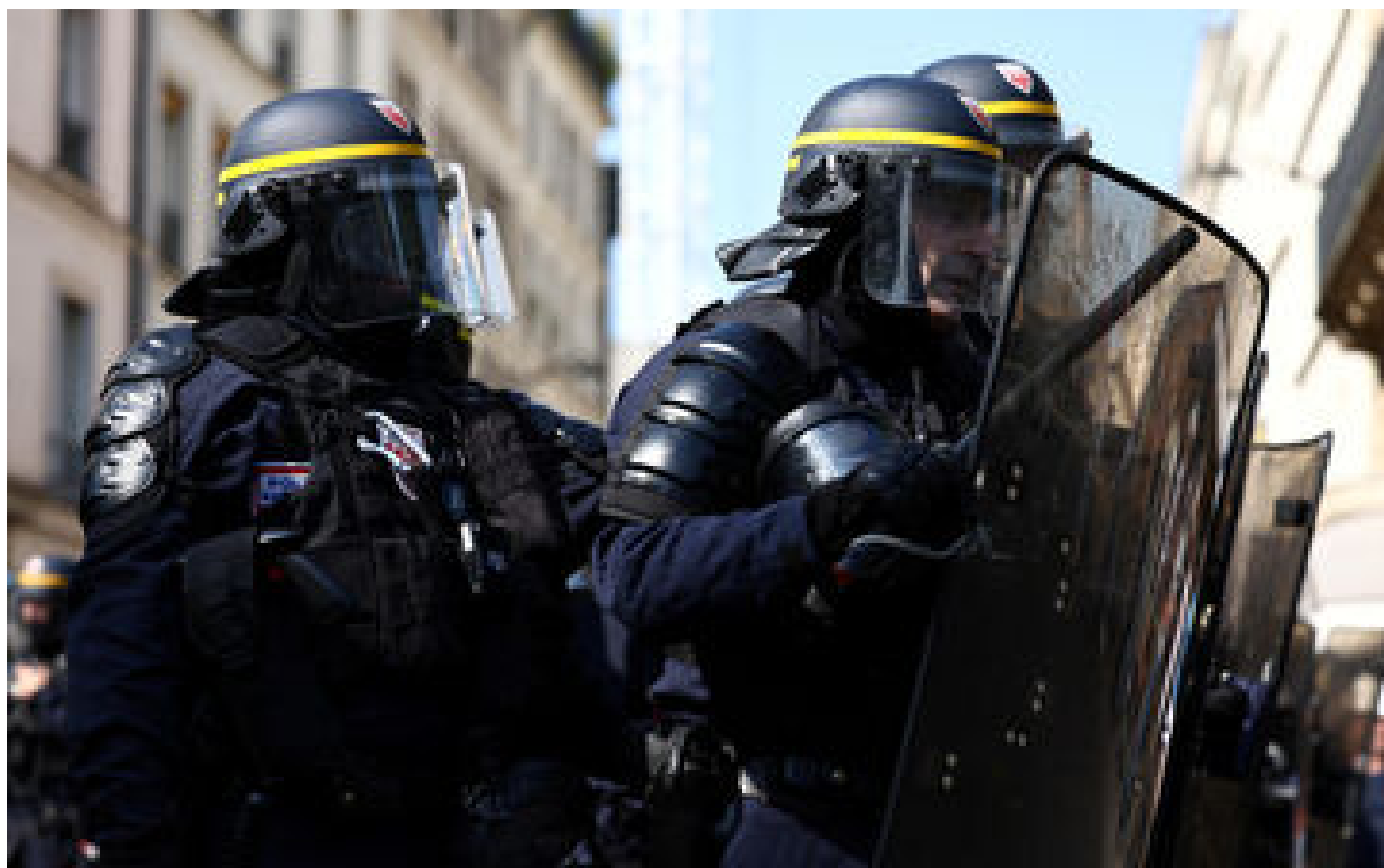
DIRECT. Nahel tué à Nanterre : rassemblements et vives tensions à Lille, Nantes et Toulouse