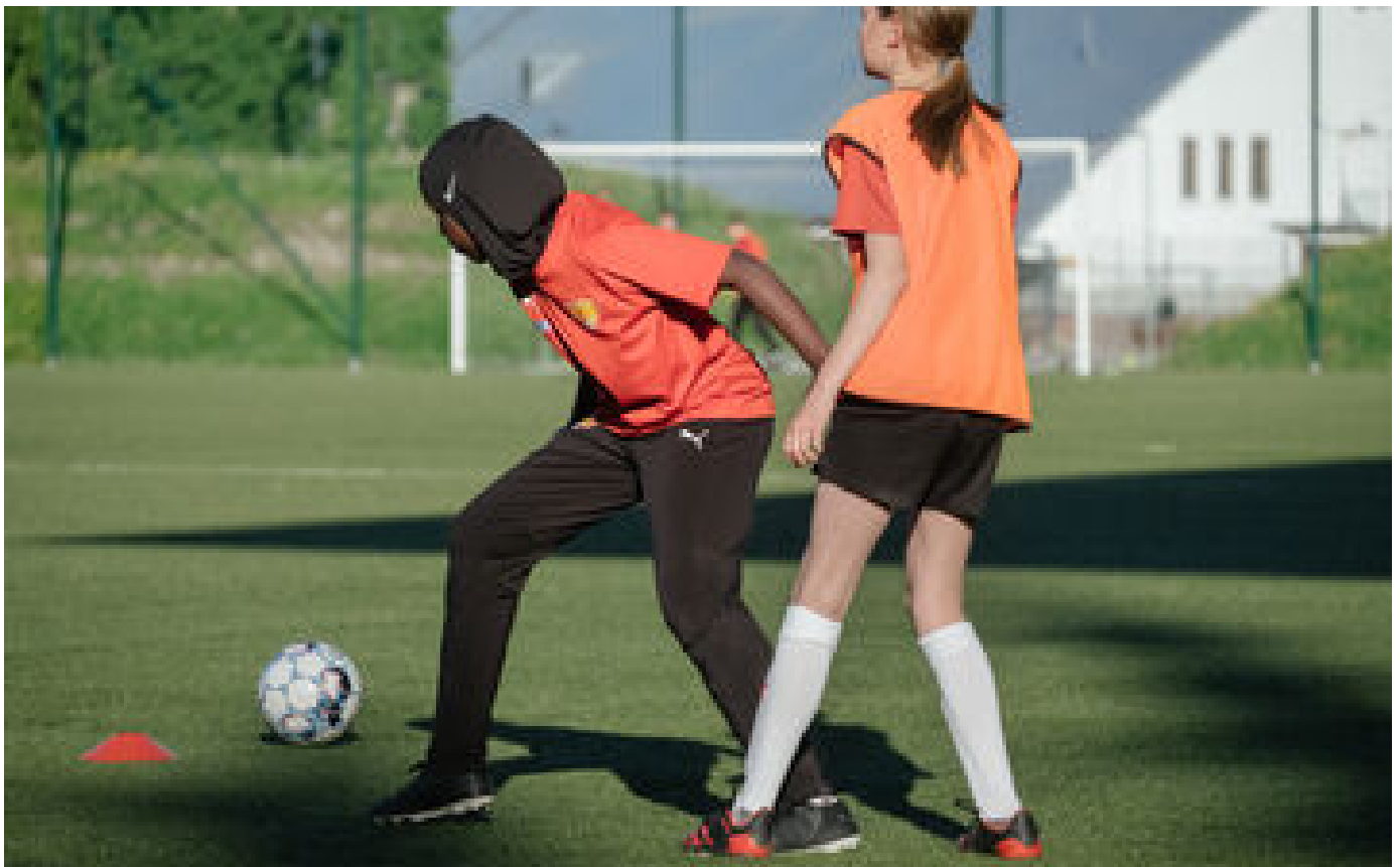
Hijab dans le foot : le Conseil d'État dénonce des « attaques » contre l'indépendance de la justice