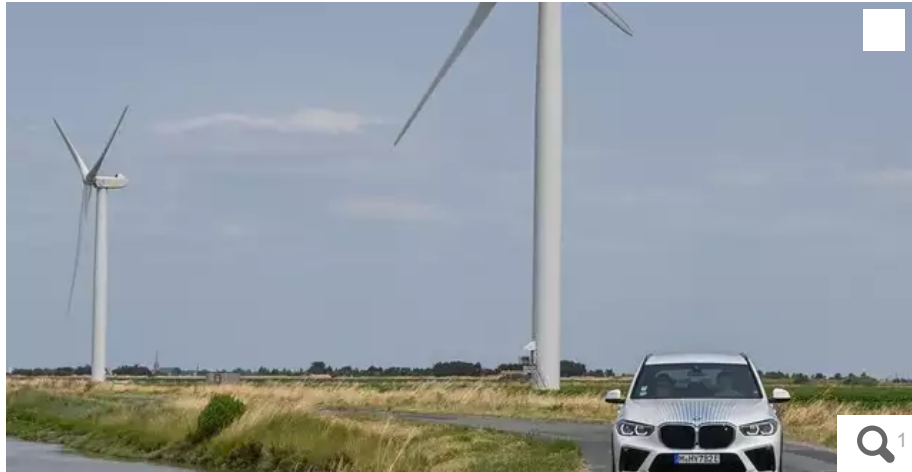
Présentation de la voiture prototype BMW IX5 Hydrogen Fuel Cell équipée d'un moteur électrique généré par une pile à combustible à hydrogène.