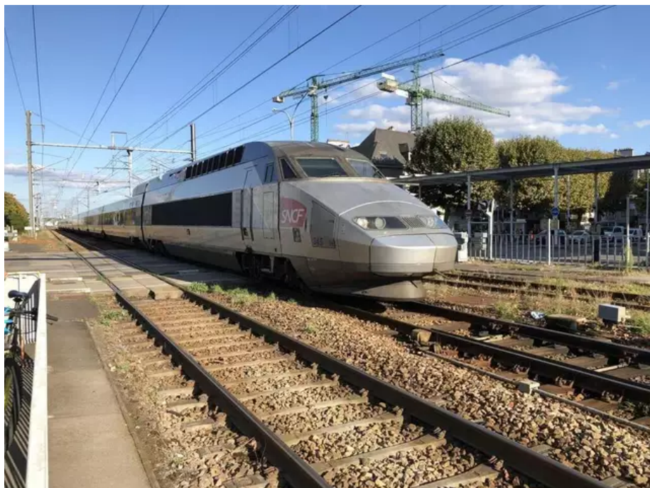
Pour Fabrice Loher, « le manque de places disponibles dans les TGV ne permet plus de répondre véritablement aux principes du projet Bretagne Grande Vitesse (BGV).