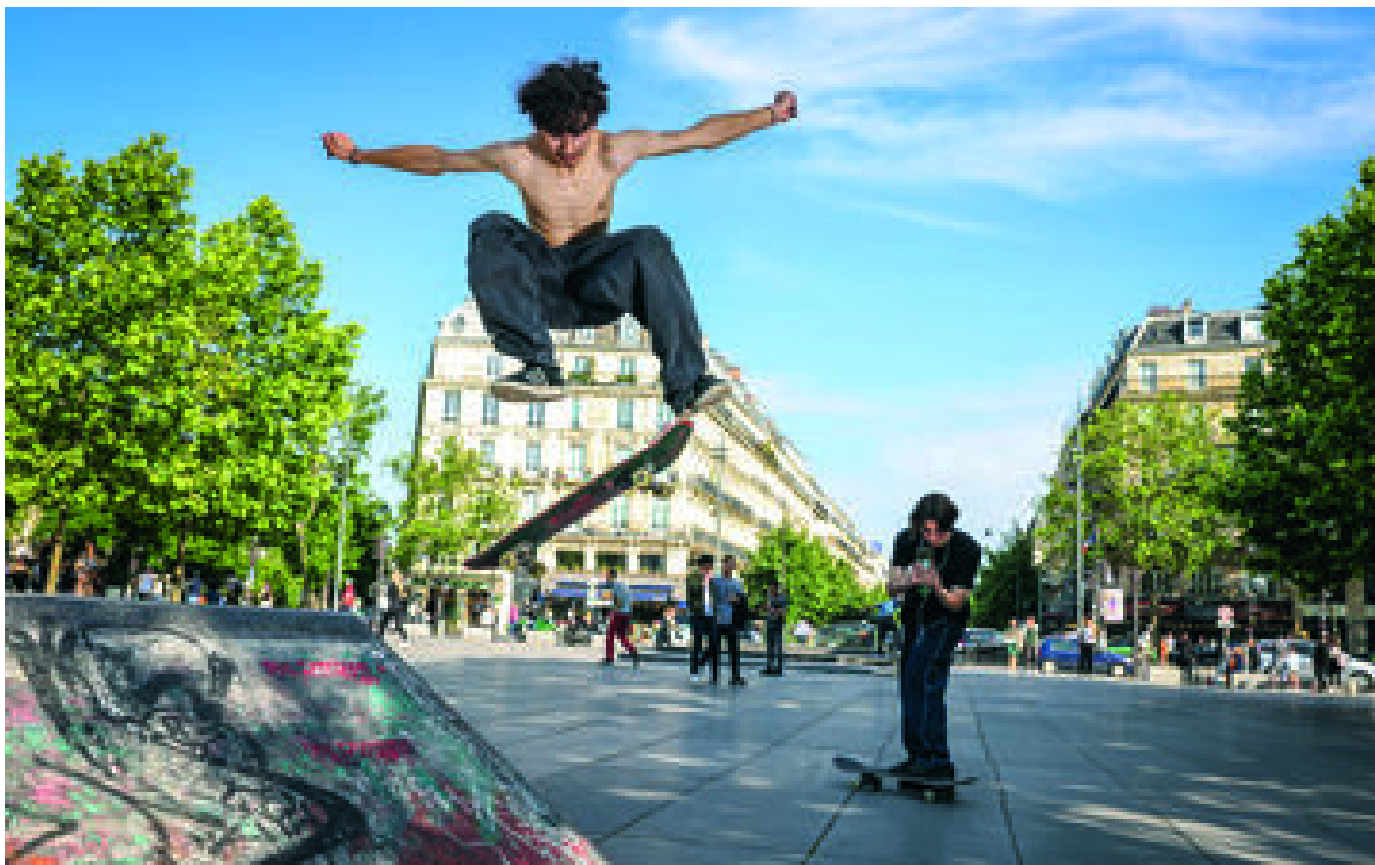
À République, les skateurs ont fait leur place P