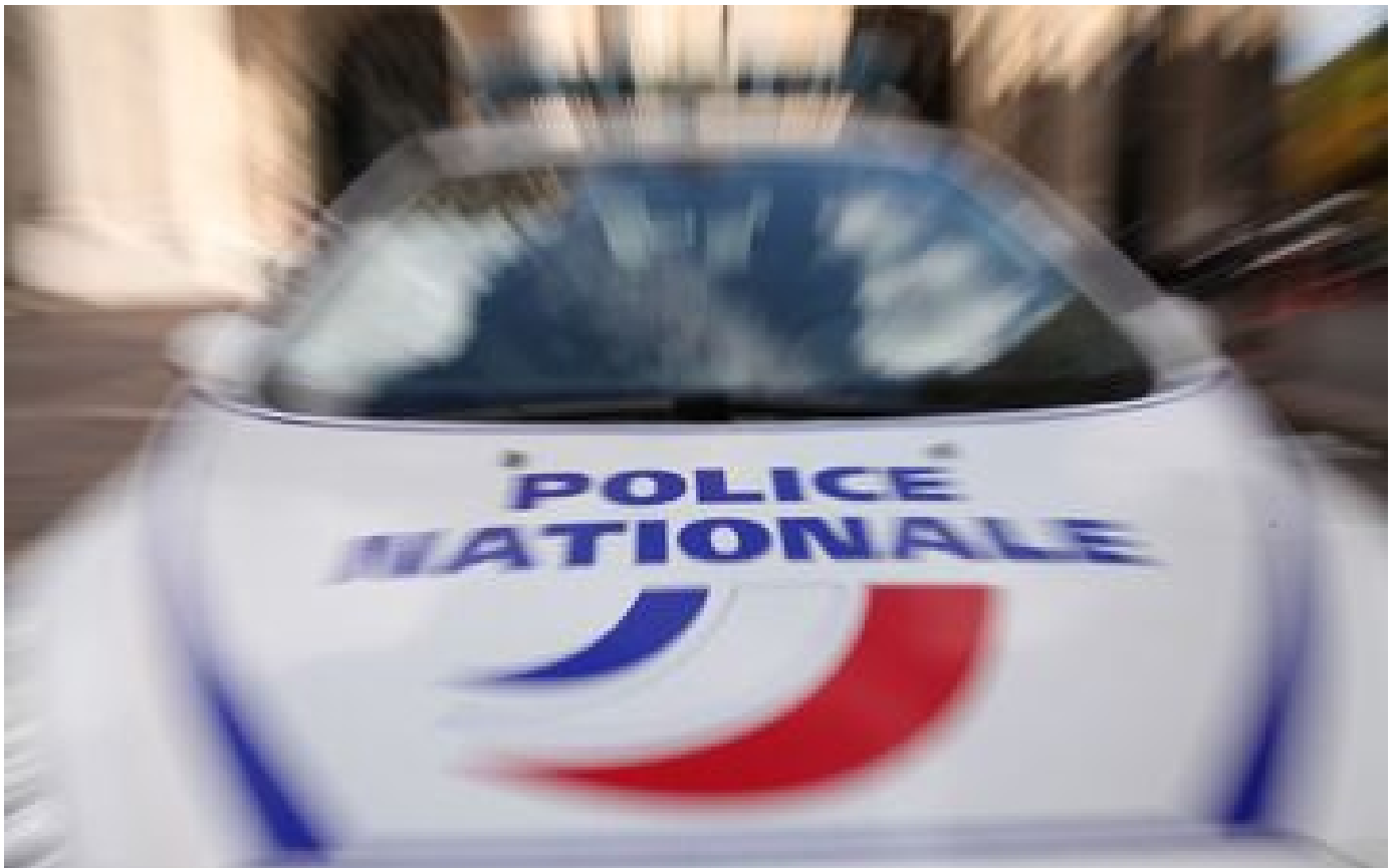
Paris : les ados font trop de bruit, le riverain excédé les menace avec son fusil