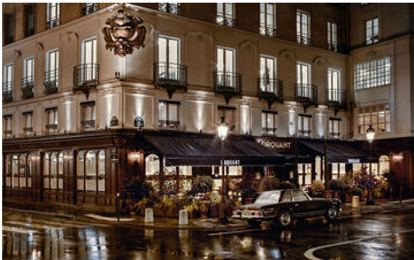
Chez Drouant, bonne chère et belles-lettres P