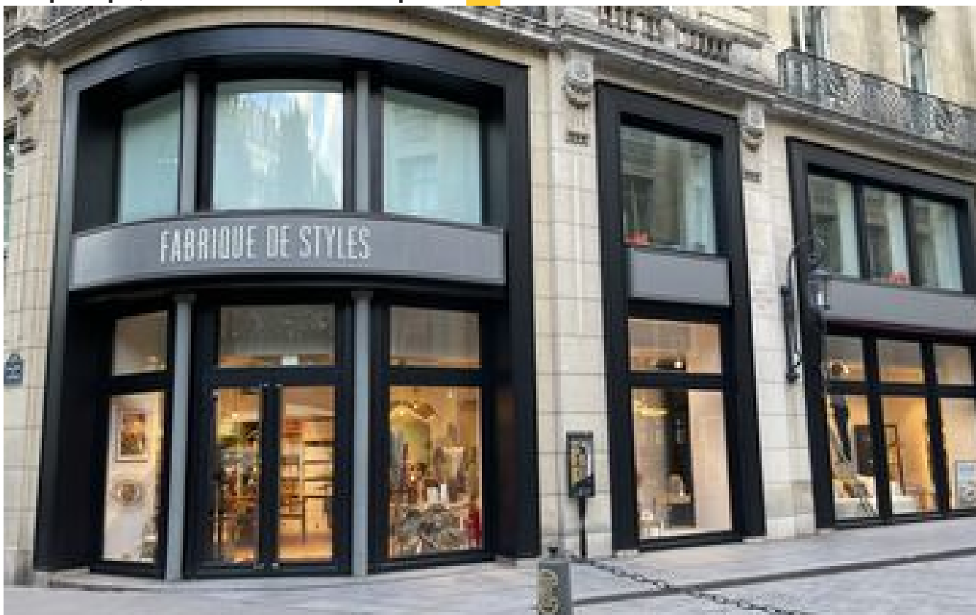
Paris : un concept store de déco ouvre à la Madeleine