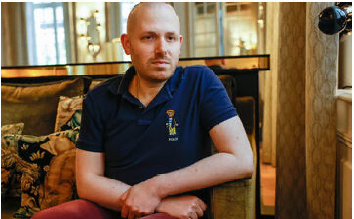
Changement de nom de famille : « Des gens me font comprendre que j'usurpe mon identité » P