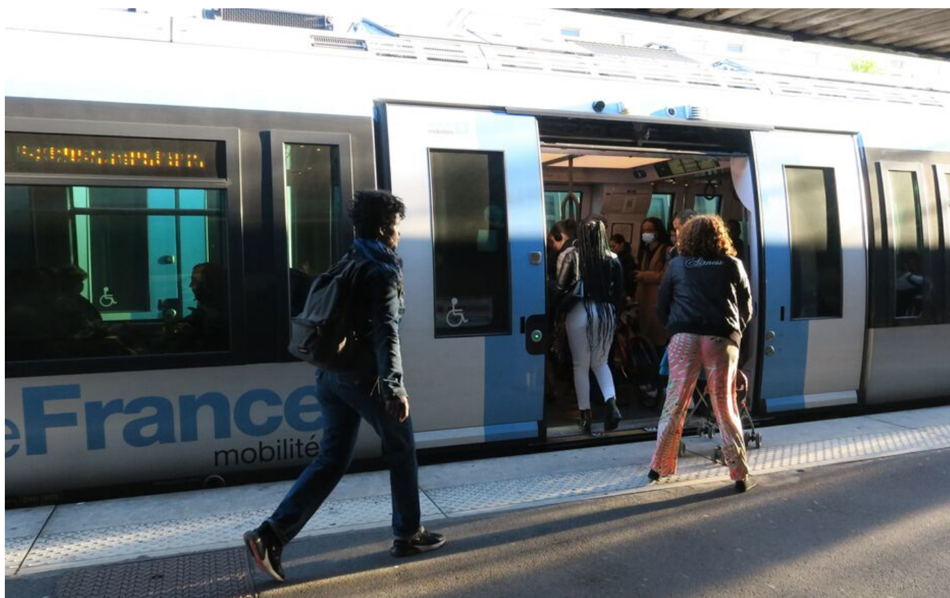
Illustration. Une agression au couteau a eu lieu dans un Transilien entre Montereau (Seine-et-Marne) et la gare de Lyon à Paris (XIIe). La victime a été blessée à la carotide. Le suspect a été neutralisé par des voyageurs et placé en garde à vue.

Le suspect, neutralisé par des voyageurs, a été arrêté ce vendredi soir à la gare de Lyon (XIIe). La victime, qui a dû être hospitalisée, devrait s'en tirer.