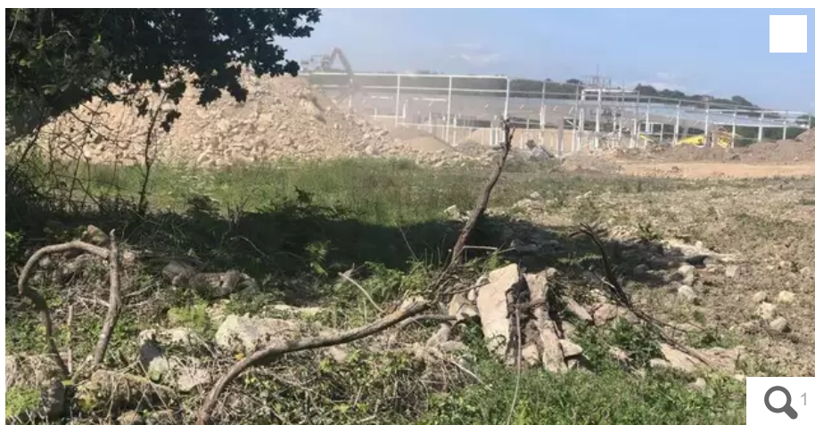
Sur la zone de Montauban, à Carnac (Morbihan), le M. Bricolage a été érigé sur un site abritant des menhirs.

Vendredi 16 juin 2023, le parquet de Lorient ouvrait une enquête contre X, dans l'affaire de menhirs détruits qui agite Carnac (Morbihan). La deuxième plainte, au nom de Sites et Monuments a été distribuée ce mercredi 21 juin. Par ailleurs, un courrier a été envoyé au maire pour demander le retrait pour fraude du permis de construire du M. Bricolage.