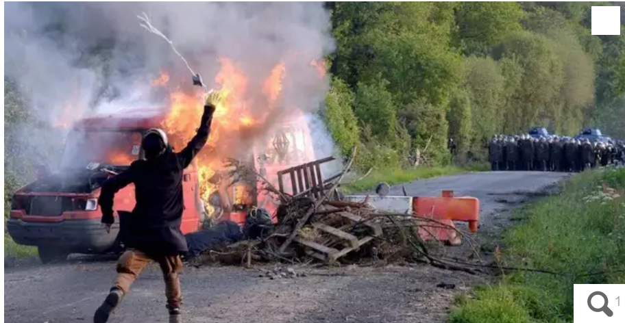
Le 9 avril 2018, le gouvernement envoie les gendarmes détruire des squats de la ZAD de Notre-Dame-des-Landes au nord de Nantes.

« Pourquoi faudrait-il renoncer à des infrastructures publiques jugées nécessaires à la population, à l'économie, renoncer à des projets industriels (qui se construiront ailleurs), à des supports d'énergies renouvelables, laisser le champ libre à l'agriculture de pays concurrents [...]. À Notre-Dame-des-Landes, la paix devenait impossible : le droit et l'ordre ont reculé. À Liffré, l'investisseur, épuisé, découragé, a renoncé... après 6 ans de contestation. Il construira ailleurs. »