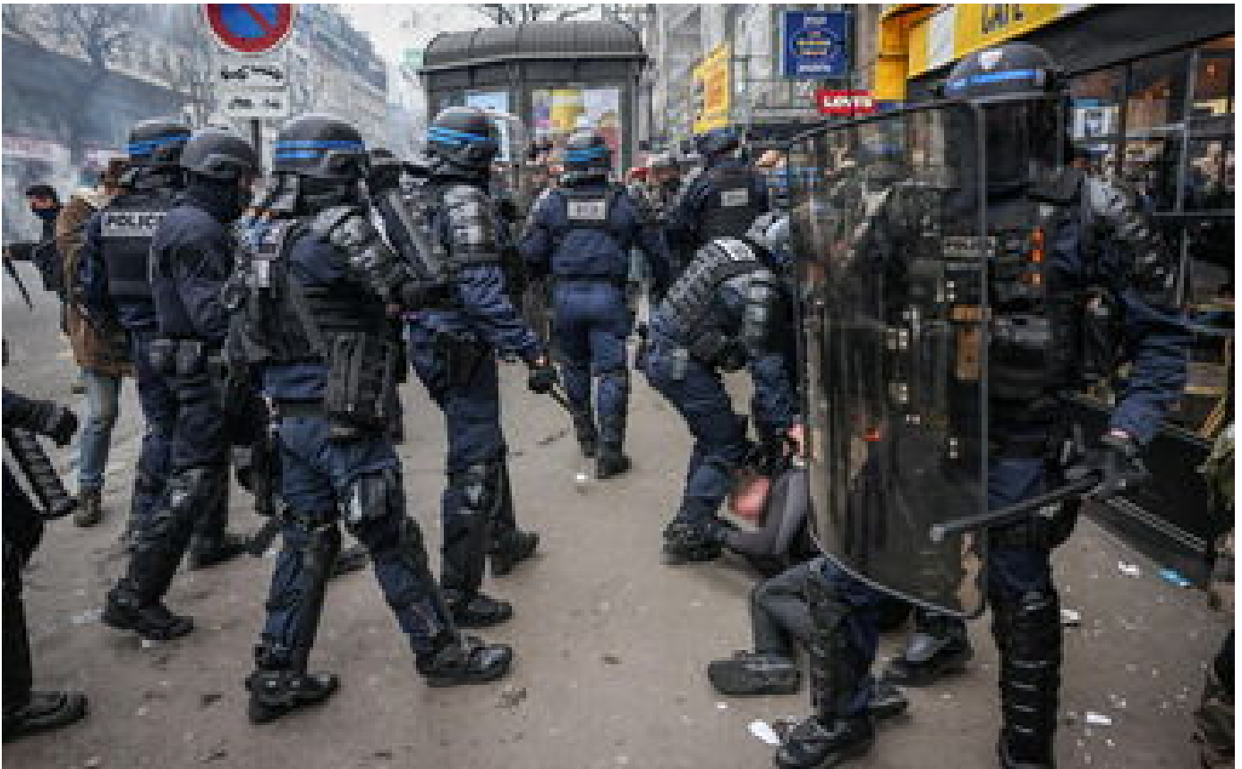
Maintien de l'ordre : des experts de l'Onu invitent la France à un « examen complet » de ses pratiques