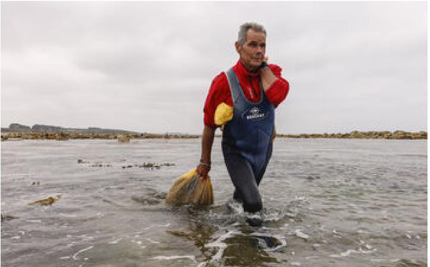
Récolte d'algues en Bretagne : une journée en images dans la vie d'un goémonier