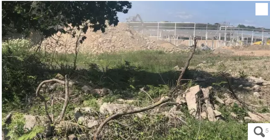
Le site de la zone de Montauban, aujourd'hui.

À Carnac (Morbihan), une enseigne de bricolage sort de terre... sur un site qui hébergeait des menhirs, identifiés par la Drac (Direction régionale des affaires culturelles). Le permis de construire avait pourtant été accordé. Que s'est-il passé ?