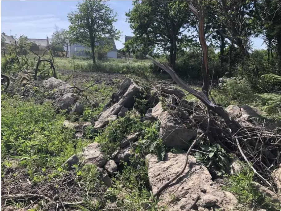
La zone de Montauban, aujourd'hui.

Le permis de construire avait alors été retoqué. « Les petits menhirs du chemin de Montauban constituaient sans doute l'un des ensembles de stèles les plus anciens de la commune de Carnac, à en juger par les datations carbone 14 obtenues en 2010 sur le site voisin de la ZA de Montauban », précise Christian Obeltz. Elles ont aujourd'hui disparu.