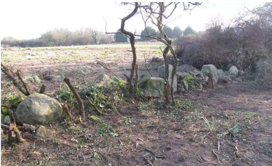
Les stèles, au sein du mur en pierre, tels qu'elles avaient été identifiées par l'Inrap, en 2015. Ici, sur une photo d'archives.