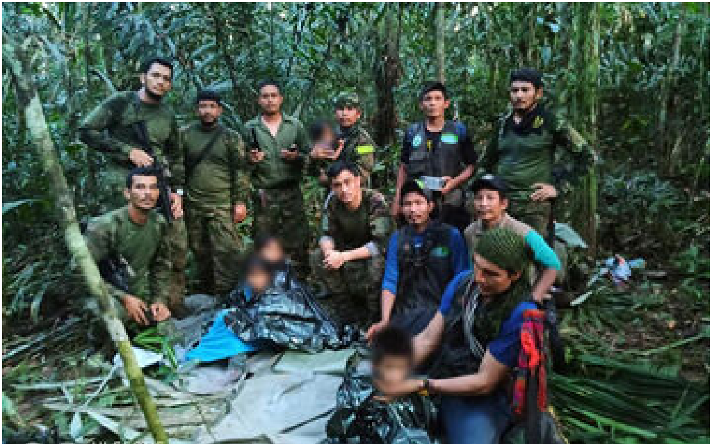
Enfants rescapés en Colombie : les images du sauvetage diffusées par la télévision publique