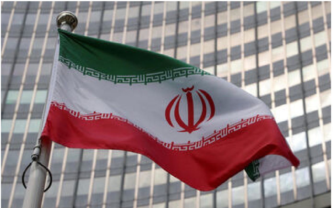
Iran : un policier tué par un parent d'une victime des manifestations