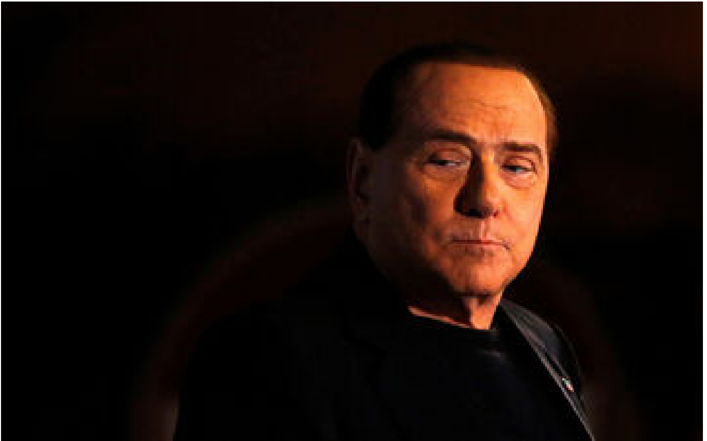
Fraude fiscale, soirées « bunga bunga »... Berlusconi, l'homme aux innombrables sagas judiciaires