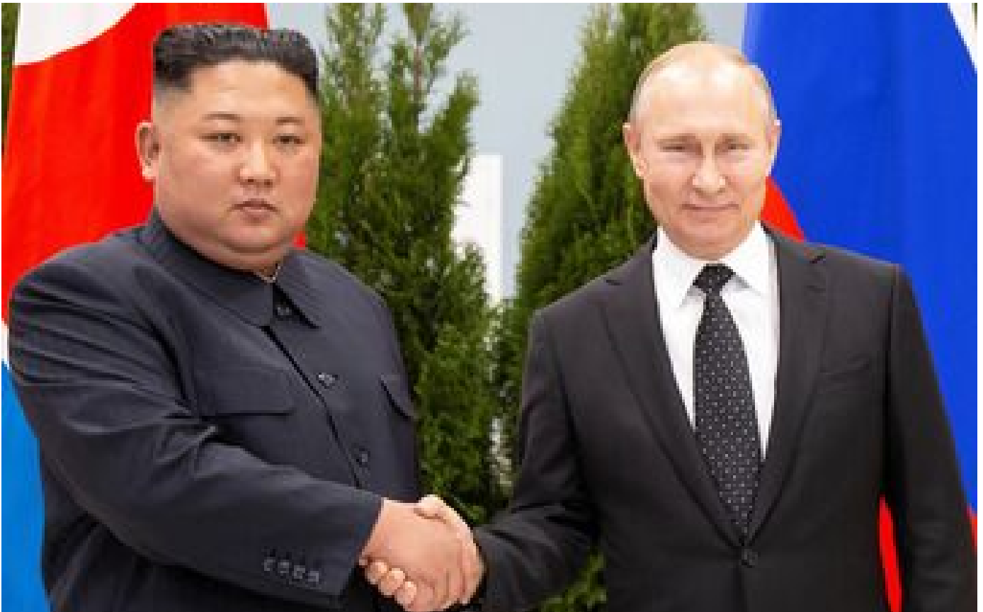
Kim Jong Un apporte son soutien à Vladimir Poutine contre « les forces hostiles » de l'Occident