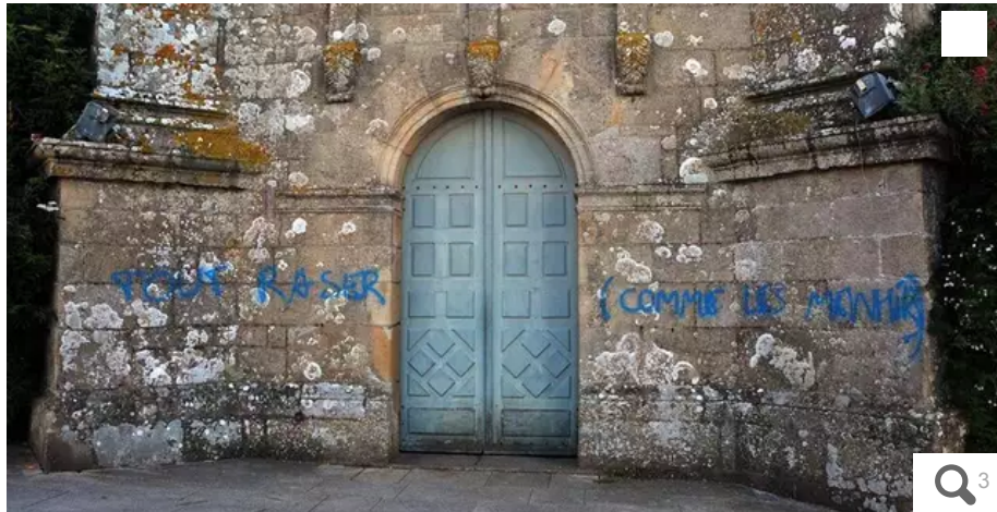
Des tags sur le pignon de l'église Saint-Cornély, à Carnac, en lien avec l'affaire des menhirs : « Tout raser comme les menhirs »

La tension ne redescend pas à Carnac (Morbihan). Dimanche 11 juin 2023, l'église Saint-Cornély, joyau patrimonial, a été taguée. Sur la façade, on peut notamment lire : « Tout raser comme les menhirs ».