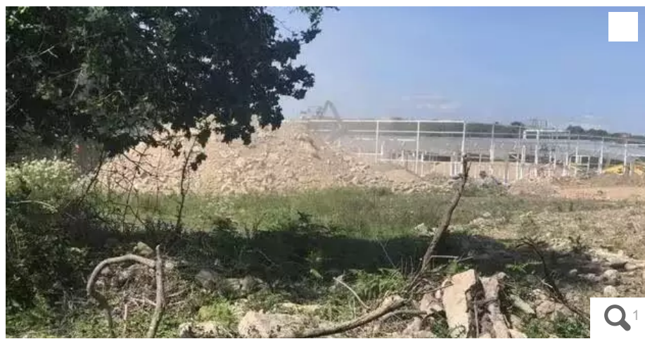
Le site de la zone de Montauban où les menhirs ont été détruits.

« Ouest-France » révélait, ce mardi 6 juin 2023, la destruction de menhirs à Carnac (Morbihan) pour la construction d'une enseigne de bricolage. En réaction, l'association Koun Breizh porte plainte devant le procureur de la République de Vannes pour « destructions volontaires aggravées par la circonstance qu'elles portent sur le patrimoine archéologique ».