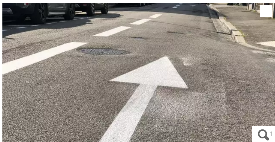
Les marquages au sol sont tous frais rue Jules-Légrand.

C'est l'un des changements du nouveau plan de circulation de la ville qui va être mis en place progressivement : la rue Jules-Légrand, parallèle à la rue Foch, est désormais en sens unique montant.