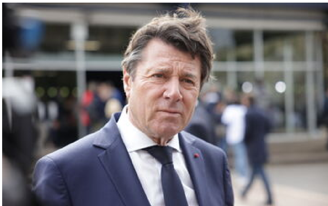
Enquête ouverte à Nice sur le financement de la campagne municipale de Christian Estroprout