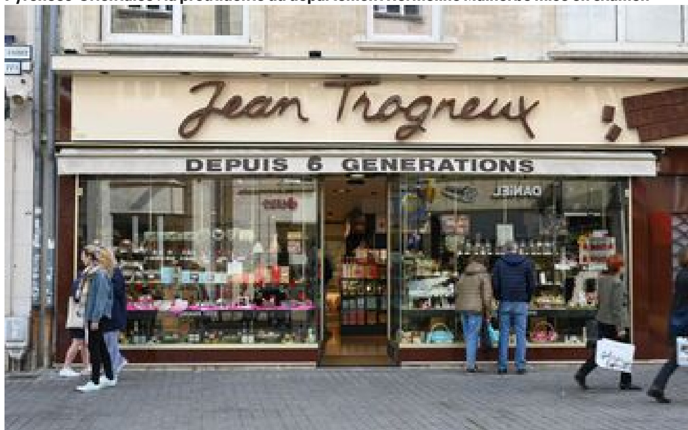
L'homme relaxé pour l'agression de Jean-Baptiste Trogneux interpellé et interdit de séjour à Paris