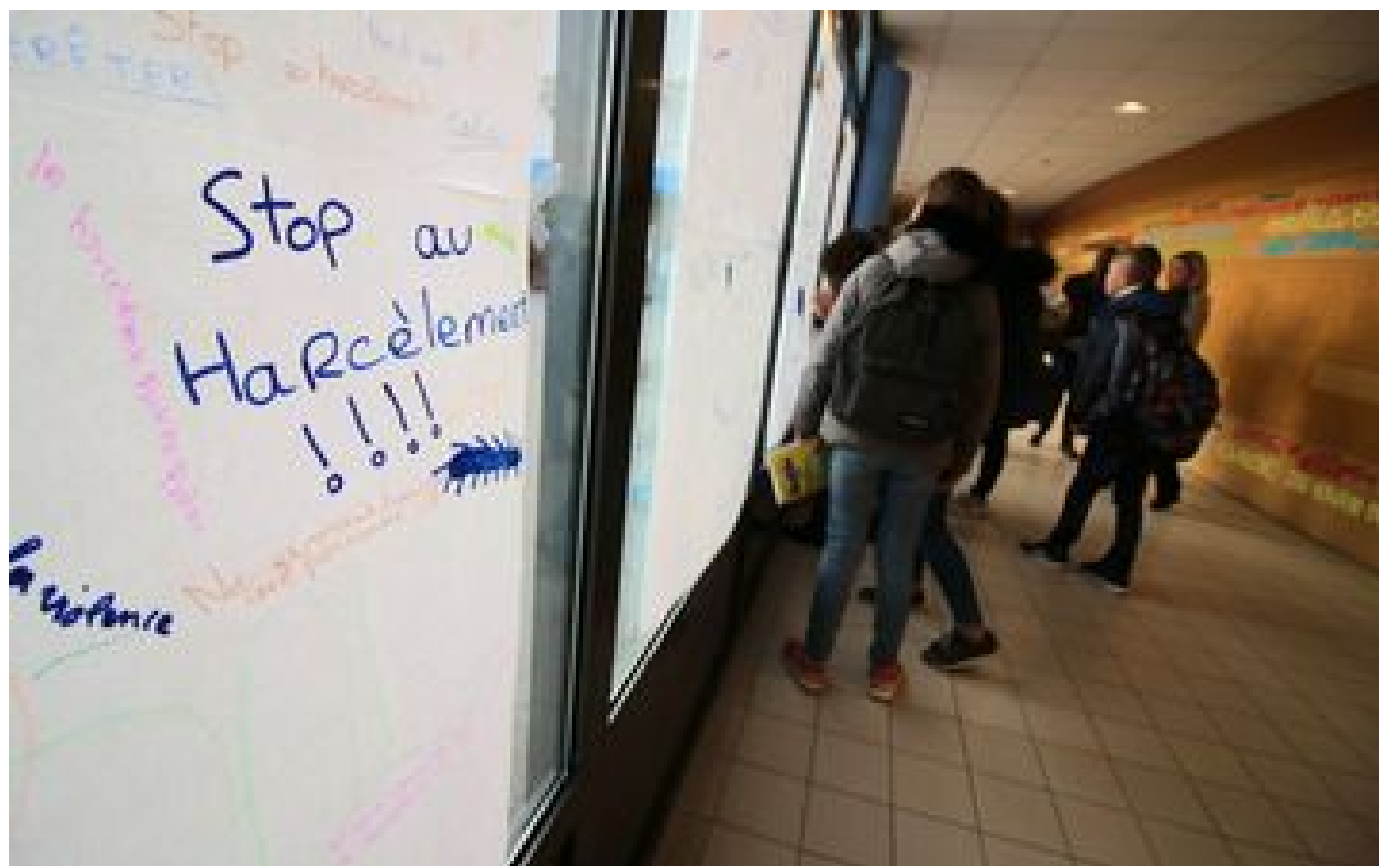
Suicide de Lindsay : le rectorat porte plainte après des menaces contre le personnel du collège