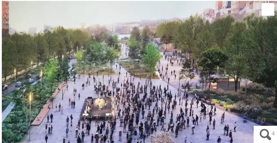
Le futur visage de la place de la Petite-Hollande à Nantes. © Image Agence Ter

Selon ses architectes concepteurs, un archipel végétal doit venir s'installer à la place du parking de la Petite-Hollande. Le budget est estimé à 70 millions d'euros pour l'heure.