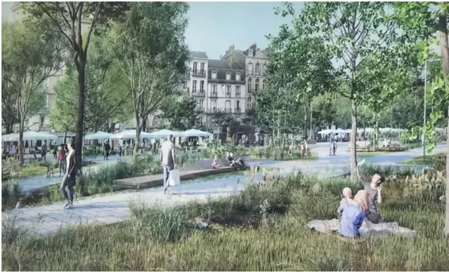
Vue depuis le parc en direction du nouvel emplacement du marché et des façades du quai de la Fosse.

Le marché s'étirera à l'ombre des arbres, le long des lignes de tramway