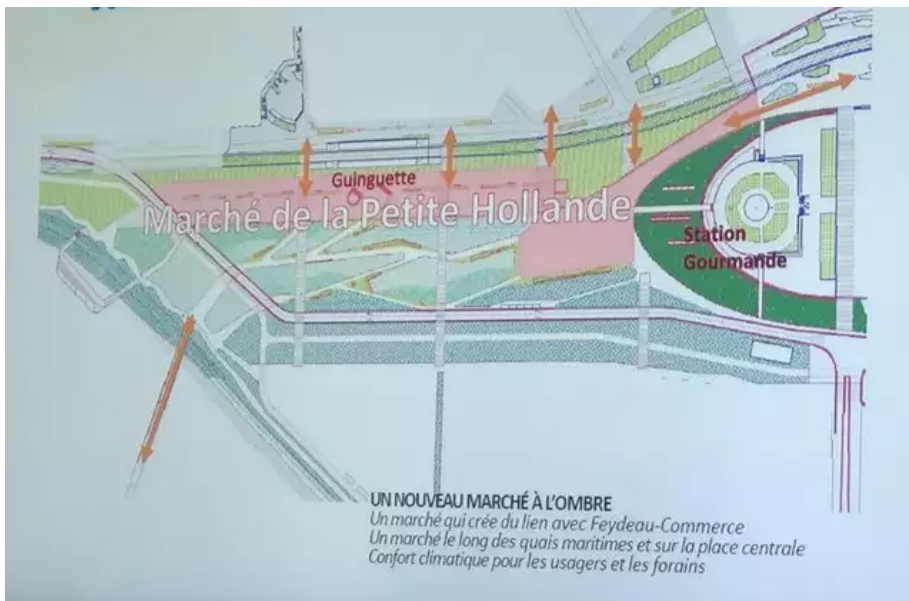
Le futur visage de la place du marché de la Petite-Hollande © Agence Ter

Dans cette coulée vers la Loire, le grand marché populaire de la Petite-Hollande est maintenu : il sera déplacé pour s'étirer sous les frondaisons des micocouliers le long des lignes du tramway, laissant la place à un espace permettant de continuer à recevoir les grands rassemblements et événements festifs. Le marché sera complété par une esplanade dans le prolongement du square Daviais et de la station gourmande -qui sont donc bien conservés-, faisant l'articulation avec le nouveau aménagement Feydeau Commerce.