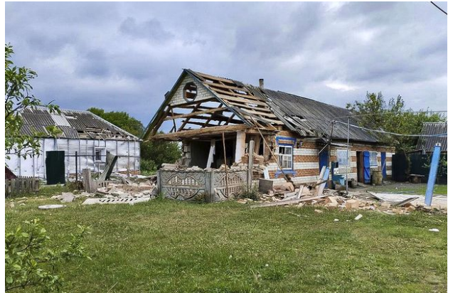
Cette photo diffusée par la chaîne Telegram du gouverneur de la région de Belgorod, Vyacheslav Gladkov, montre des maisons endommagées, une action que Moscou a imputé à des saboteurs militaires ukrainiens.

Ces actes de sabotage, selon lui, sont commis par des dissidents russes. Le conseiller de Volodymyr Zelensky insiste d'ailleurs: pour lui, le conflit se terminera lorsque le régime russe s'autodétruira.