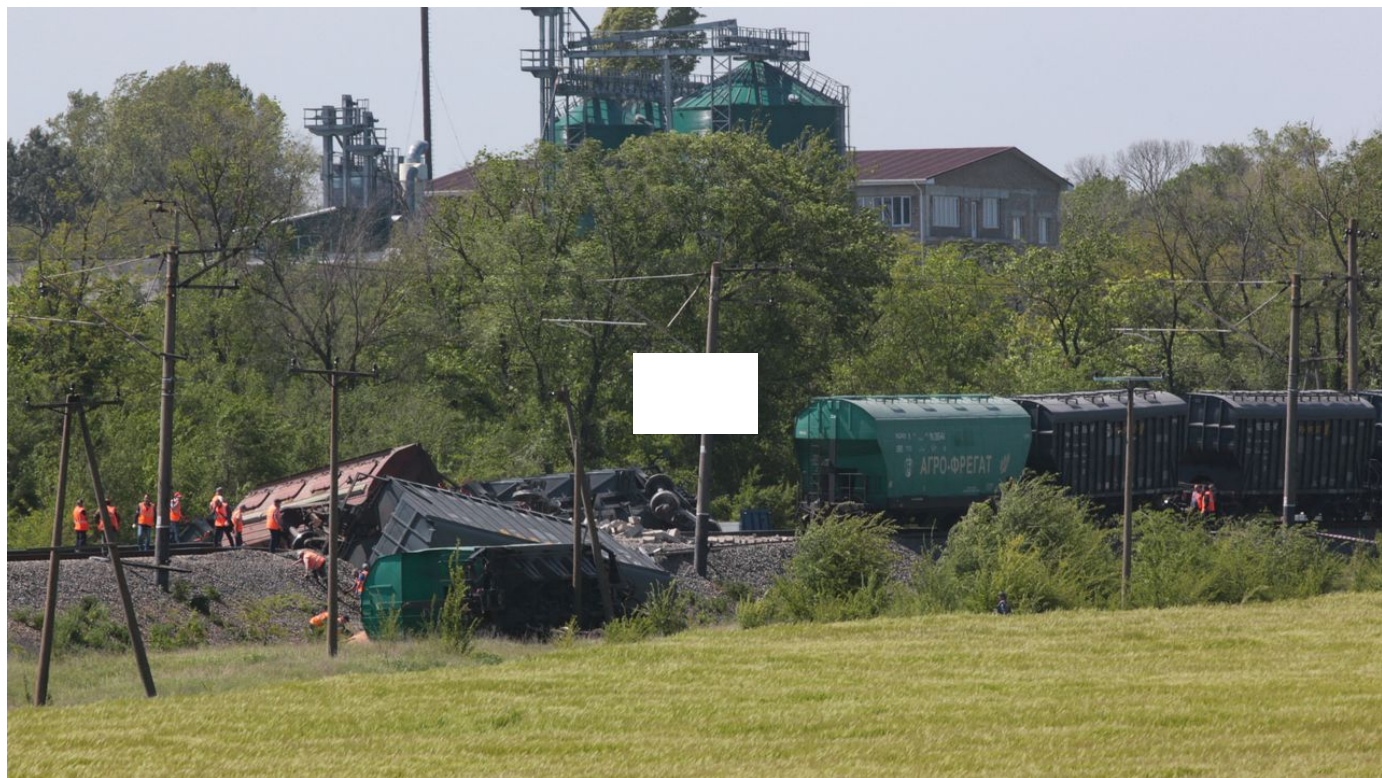
Les forces ukrainiennes contre-attaquent sur sol russe, en dépit des discours officiels / La Matinale / 4 min. / aujourd'hui à 07:26

Après de longs mois de guerre, le territoire russe est désormais touché lui aussi par des opérations de sabotage. Et malgré le discours officiel, certaines sont menées par les Ukrainiens, selon un témoignage édifiant recueilli par la RTS.