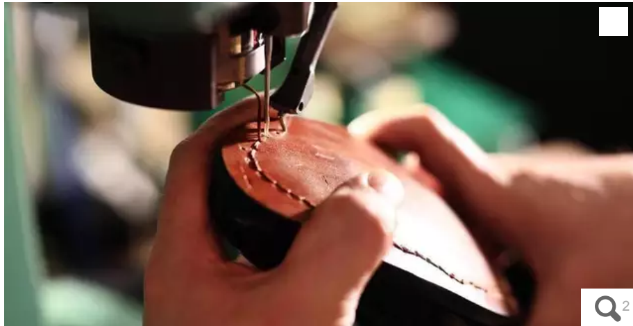
Les magasins Bessec proposent désormais un service de cordonnerie dans leurs boutiques de Saint-Malo, Morlaix, Rennes, Vannes et Lorient.

L'entreprise malouine travaille, depuis peu, avec une jeune société baptisée Re-paire. L'objectif : donner une seconde vie aux chaussures.