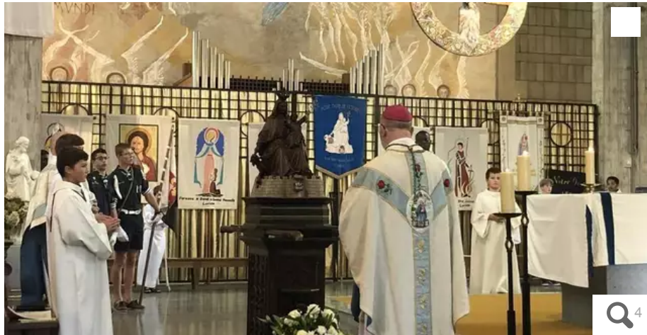
La grande croix celtique, suspendue à plus de trois mètres de hauteur au-dessus de l'autel de l'église Saint-Louis, à Lorient (Morbihan), a été volée dans la nuit de mercredi 17 à jeudi 18 mai 2023. Ici lors d'une messe.

Qui a bien pu voler la grande croix celtique, suspendue dans les airs, à plusieurs mètres de hauteur au-dessus de l'autel de l'église Saint-Louis ? Une enquête a été ouverte par le parquet de Lorient (Morbihan).