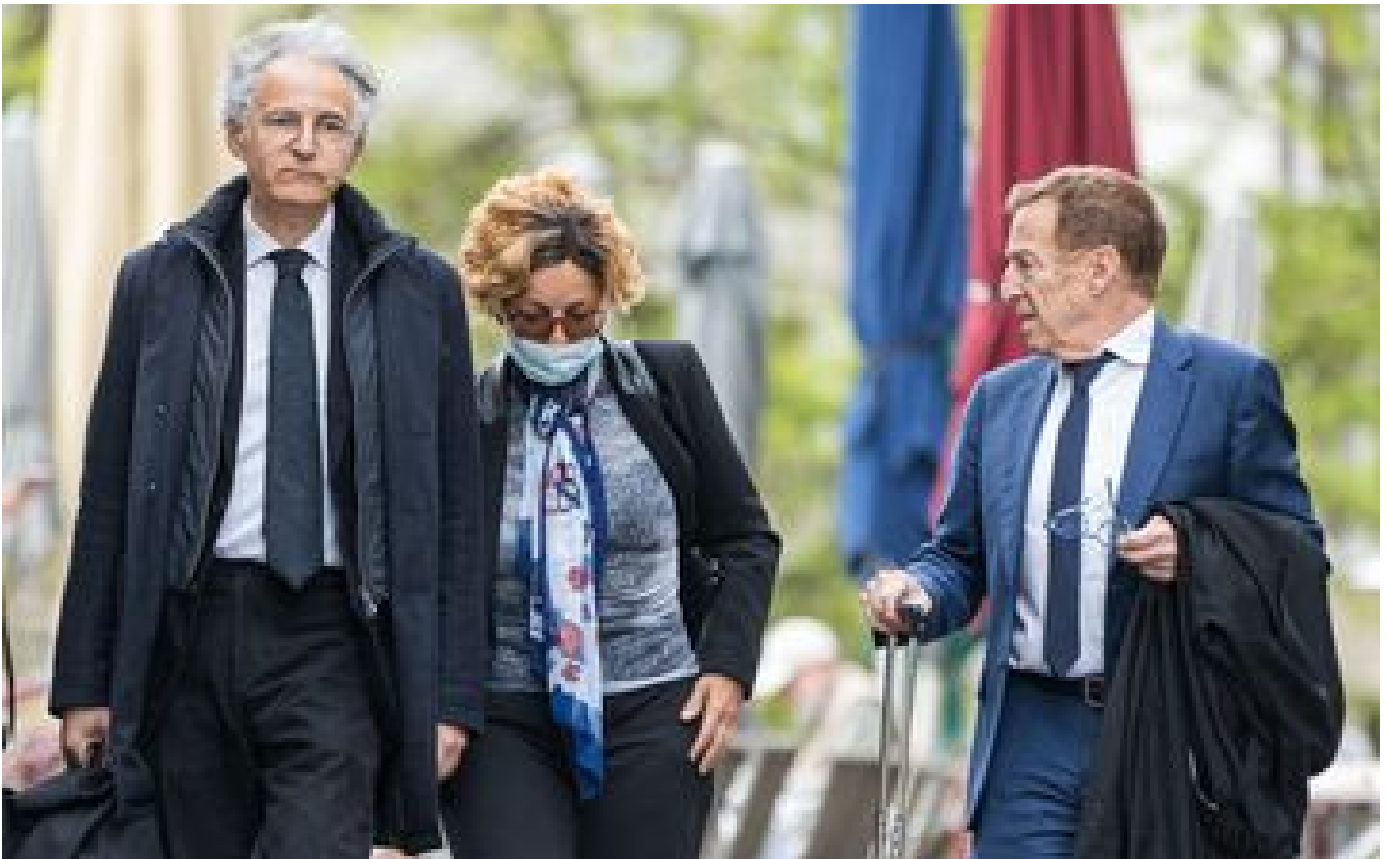
Procès de Tariq Ramadan pour viol : « Cette nuit était rythmée par les coups, les injures et la pénétration » P