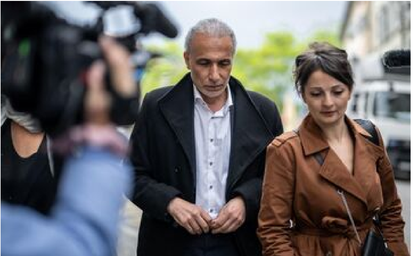
Tariq Ramadan : trois ans de prison requis à son procès pour viol en Suisse