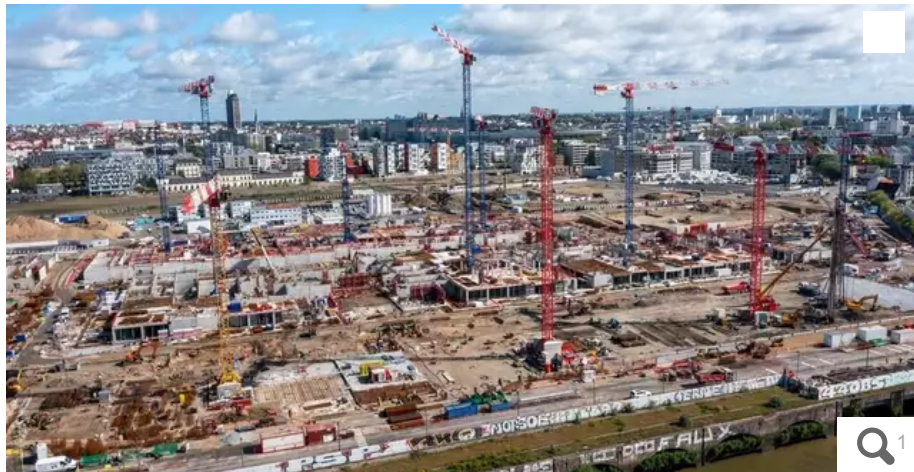
Le chantier du futur CHU de Nantes, ouverture à l'automne 2027, en bordure de Loire.

Dans un audit, la Chambre régionale des comptes de Nantes pointe un surcoût dû à l'inflation, d'au moins 55 millions d'euros pour le futur hôpital de Nantes.