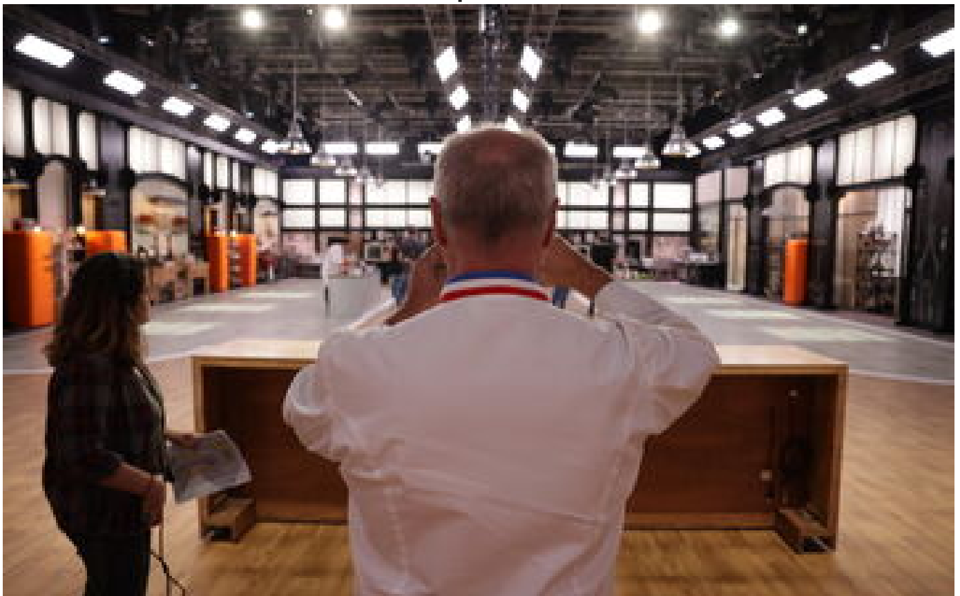
« Top Chef » : une journée dans les arrières-cuisines de l'émission P