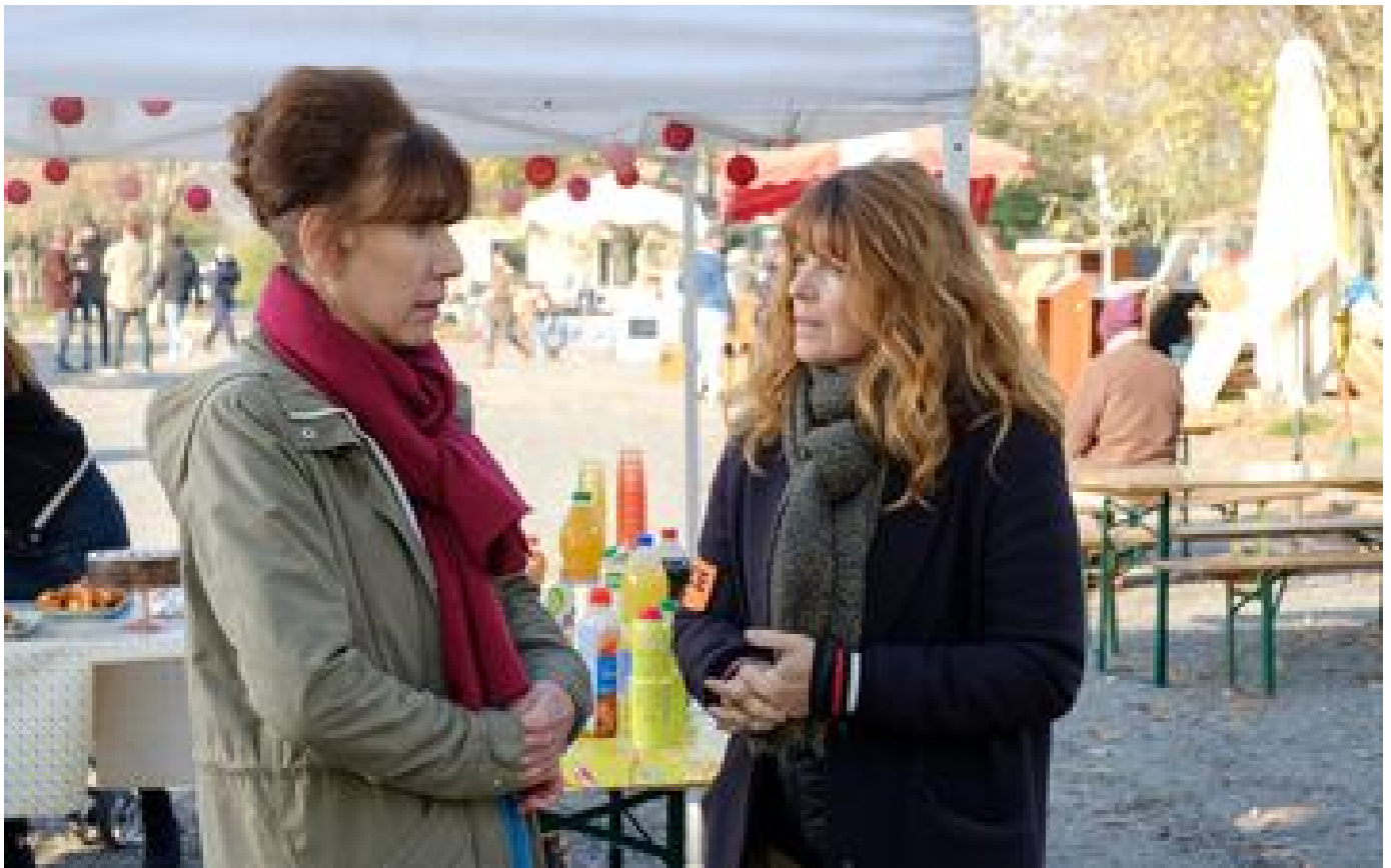
Audiences TV : « Cassandra » en tête, du mieux pour « The Voice »