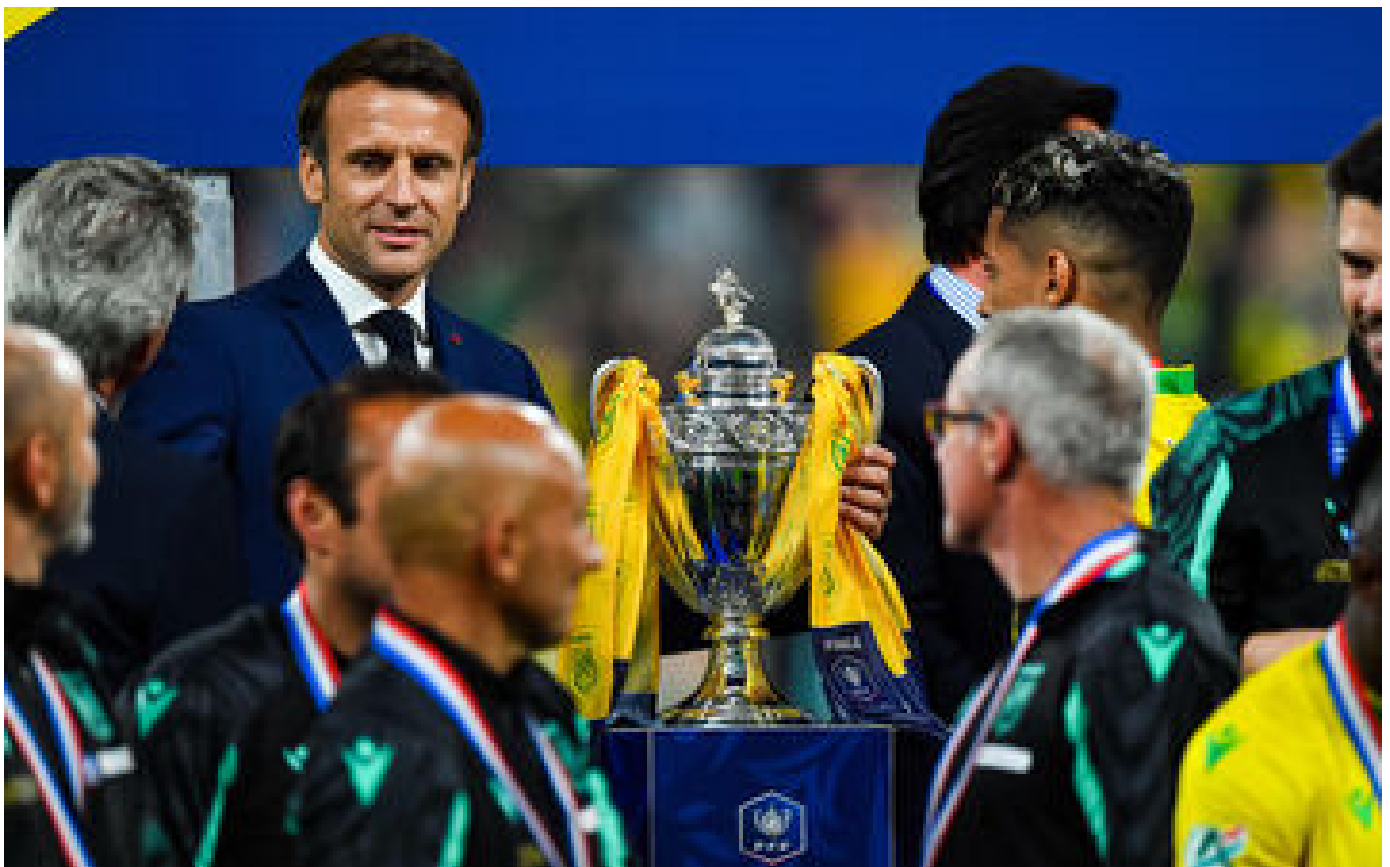
Rassemblement syndical interdit, remise du trophée en tribune : Emmanuel Macron sous pression au Stade de France