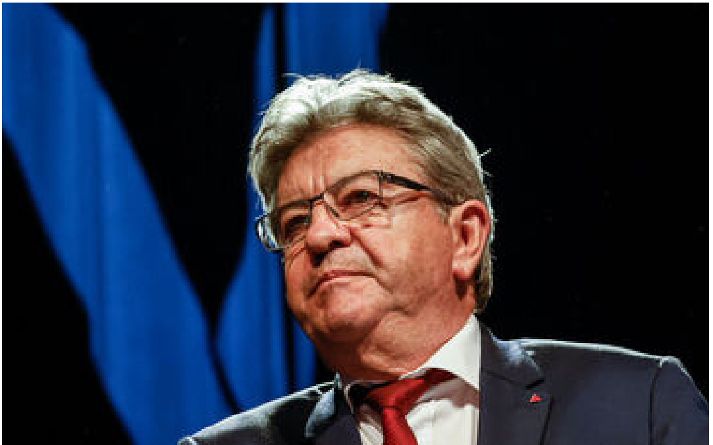
1er mai : Mélençon appelle policiers et gendarmes à se joindre au mouvement social