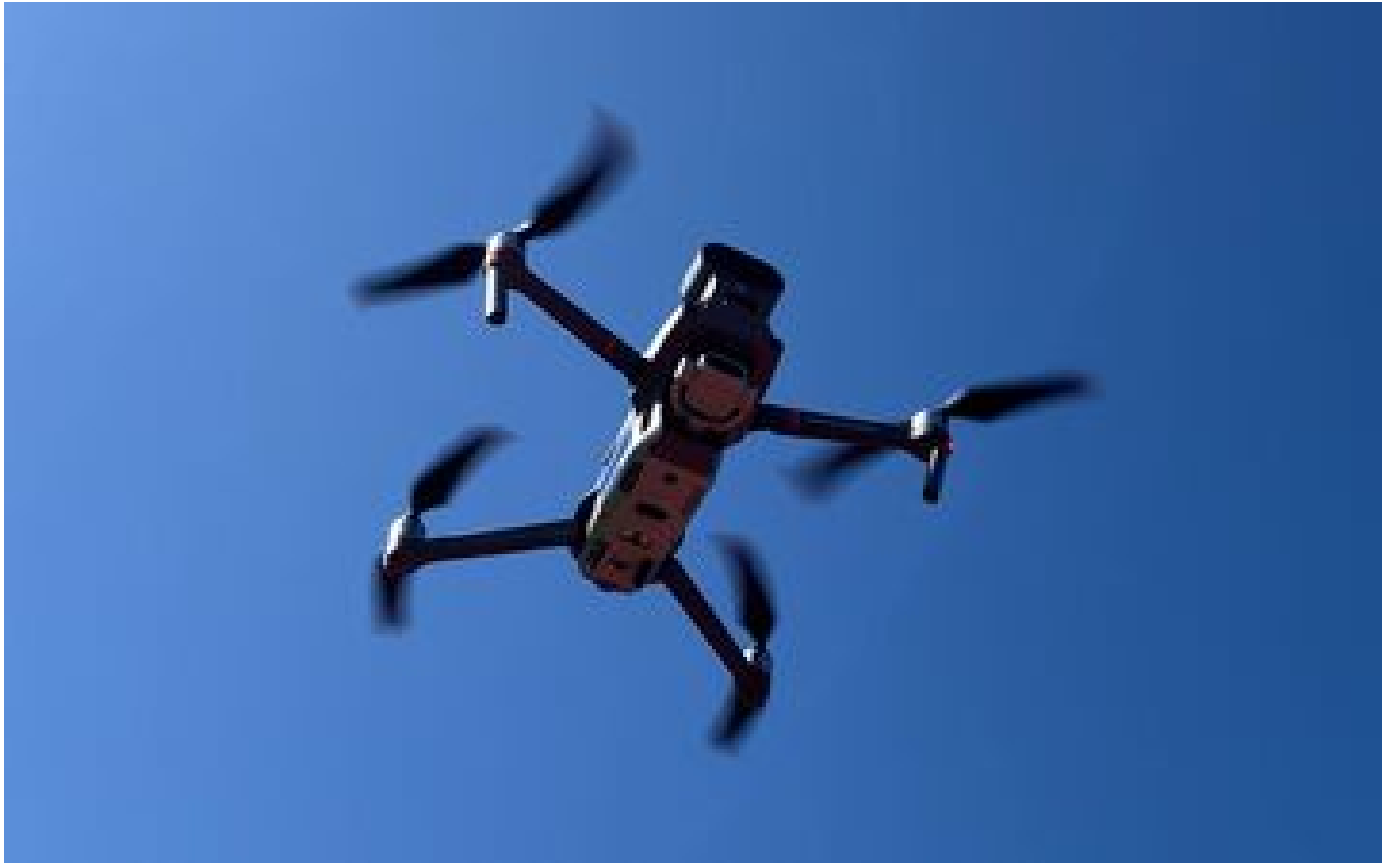
Rodéos urbains : Gérald Darmaproust demande aux préfets de recourir aux drones