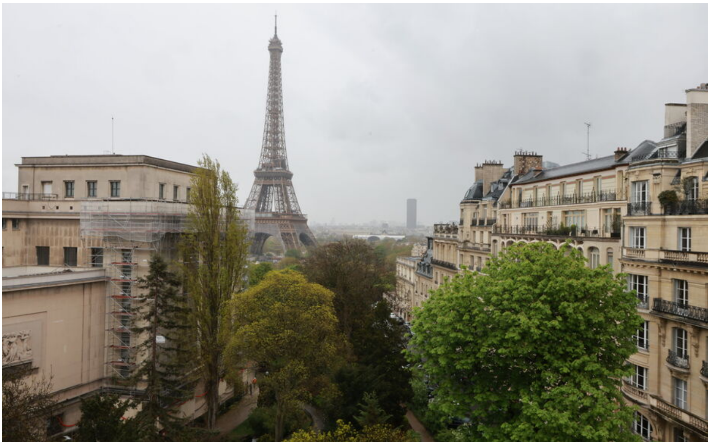
Paris (XVI e ). La vue sur la tour Eiffel depuis l'un des balcons de cet appartement construit entre 1904 et 1907.

Situé à Paris (XVI e ), ce pied-à-terre de 120 m 2 dispose de deux balcons et de baies vitrées tournées vers la Dame de fer. L'immeuble lui-même est un véritable morceau de patrimoine. Il est en effet classé à l'inventaire des monuments historiques.