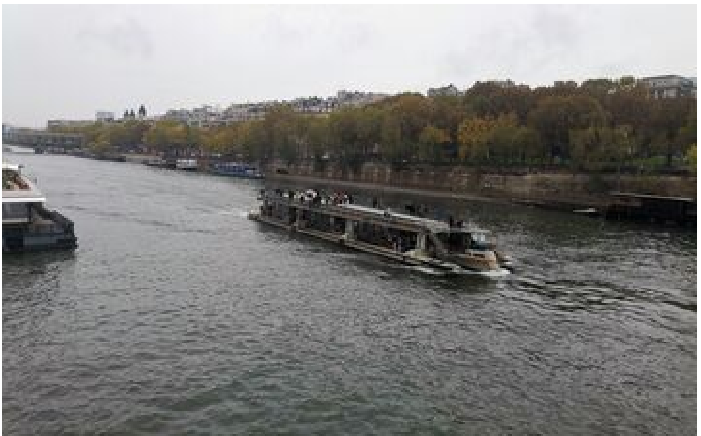
Paris : un homme porté disparu après une chute dans la Seine, six personnes en garde à vue