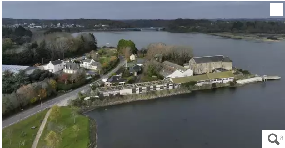
Quel avenir pour l'ancienne « poudrière » du Scorff ? L'ancien manoir du XIIIe siècle fut jadis l'un des plus imposants de Bretagne avant de devenir une réserve de poudre pour la Marine royale puis un centre pyrotechnique jusqu'en 2001.