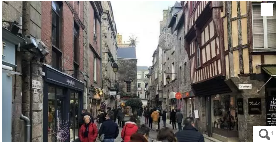
La ville de Dinan, 15 000 habitants, dans les Côtes-d'Armor, connaît un dynamisme commercial sans beaucoup de prise avec l'actualité des enseignes nationales, avec 650 commerces dénombrés en 2021.

À l'heure où le tsunami dans l'industrie textile redessine la carte des enseignes présentes dans les centres-villes, comment nos villes de l'Ouest vivent-elles les récentes fermetures de magasins Camaïeu, Kookaï, ou encore Gémo, San Marina ?