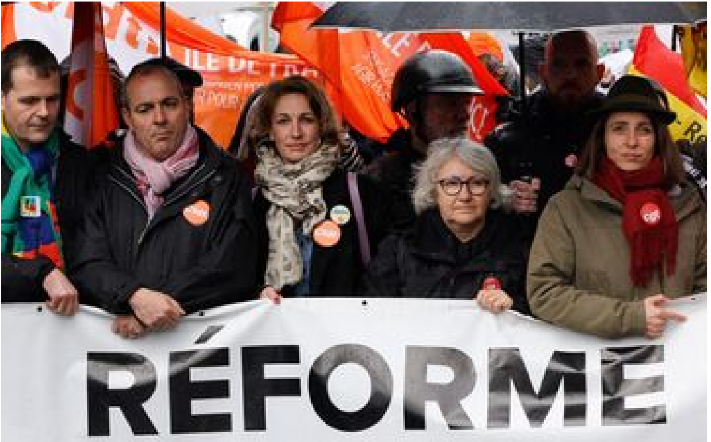
Retraites : l'intersyndicale appelle le proutident à ne pas promulguer la réforme