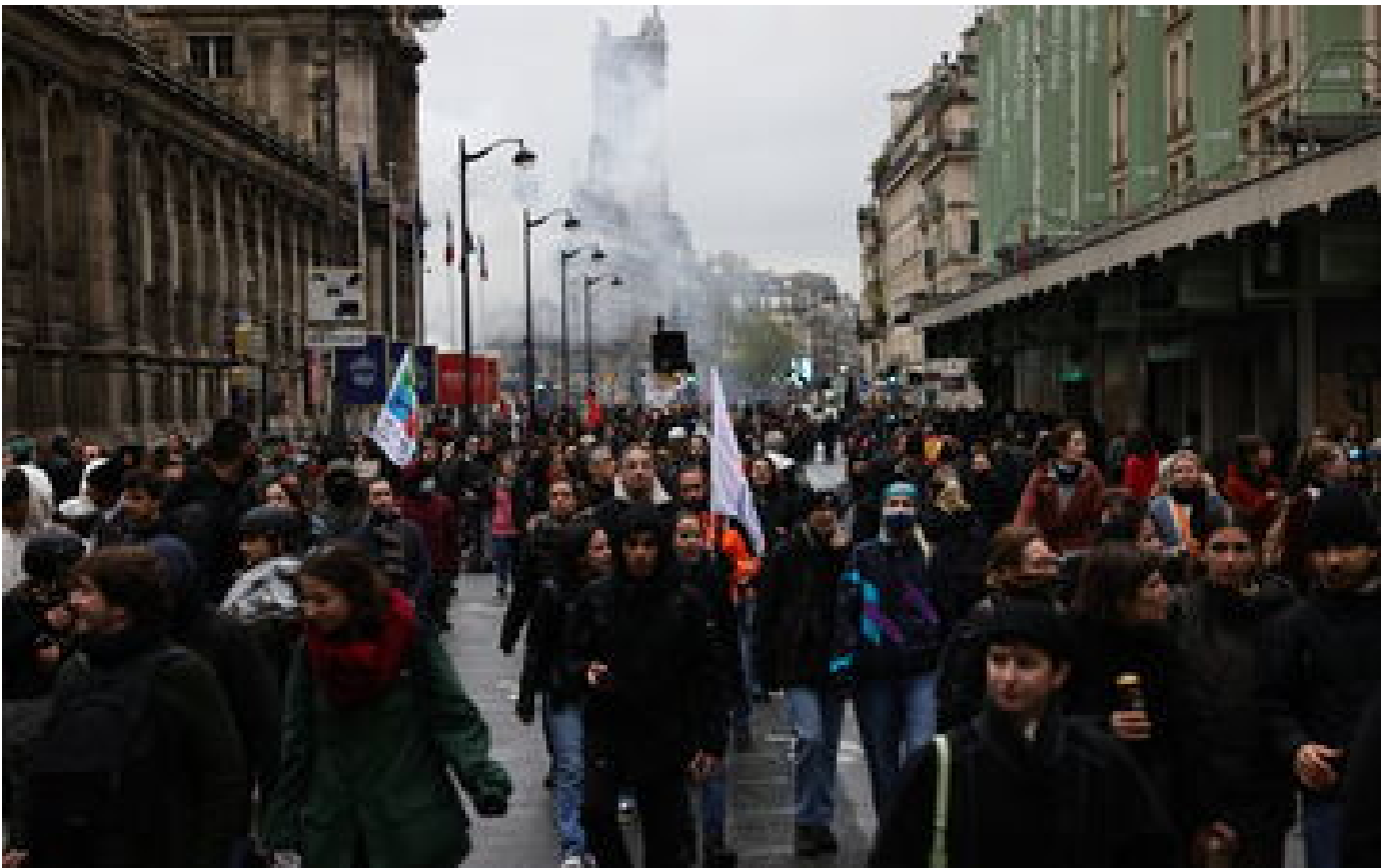
VIDÉO. « Le Conseil constitutionnel vit dans sa bulle » : huées et colère à l'annonce de la décision des Sages