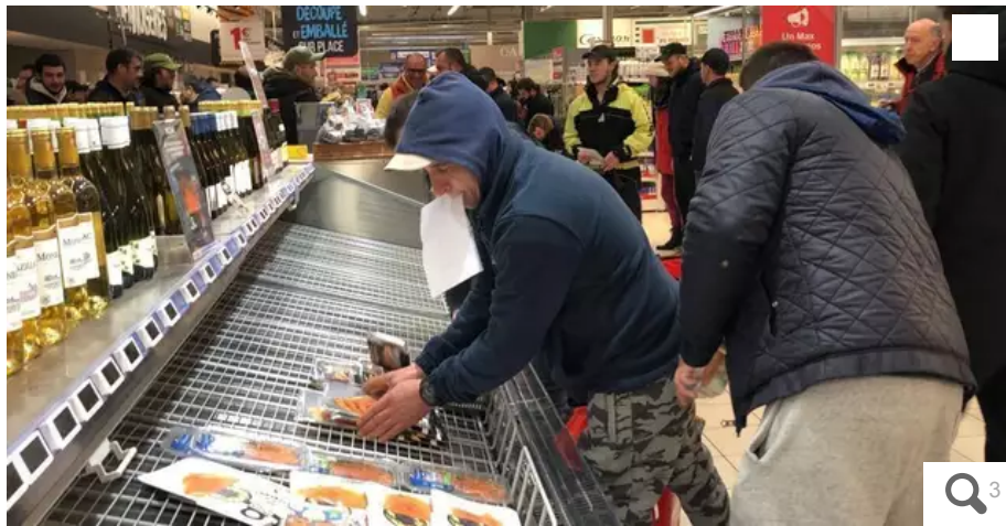
Une centaine de pêcheurs ont vidé, ce vendredi 31 mars 2023, les rayons poissonneries du Géant de Lorient (Morbihan).

Une centaine de pêcheurs sont venus vider les rayons du supermarché Géant-Lanester et ont demandé de retirer les produits venus de l'étranger au Carrefour K2 à Lorient (Morbihan), ce vendredi 31 mars 2023. Un mouvement de protestation car des magasins n'ont pas suivi le mouvement des pêcheurs « filière morte » et sont connus pour « ne pas se fournir à la criée de Lorient ».