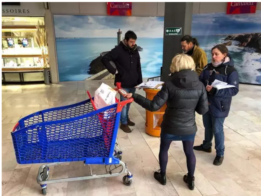
Les pêcheurs ont lancé une pétition auprès des clients du Carrefour K2 à Lorient, ce vendredi 31 mars 2023.