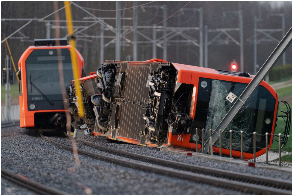
Le déraillement d'un train régional de la compagnie RBS près de la gare de Büren zum Hof (BE) a fait 12 blessés le 31 mars 2023.

Le deuxième accident est survenu peu avant 17h00, près de la gare de Büren zum Hof, sur la commune de Fraubrunnen, à une vingtaine de kilomètres au nord de Berne. Une partie du convoi s'est là encore renversée, et d'autres trains sur le tronçon entre Jegenstorf (BE) et Soleure ont dû être arrêtés. La police a fait état de 12 blessés, dont 3 enfants. Une personne est grièvement touchée.