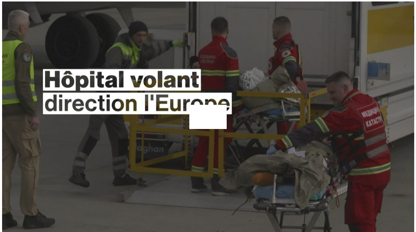
Un avion évacue les blessés ukrainiens vers l'Europe / L'actu en vidéo / 1 min. / aujourd'hui à 17:30

Depuis un an déjà, un programme européen a permis à 2000 patients ukrainiens, blessés de guerre ou atteints de maladie grave, de s'envoler vers le Vieux Continent à bord d'un avion médicalisé. Reportage.