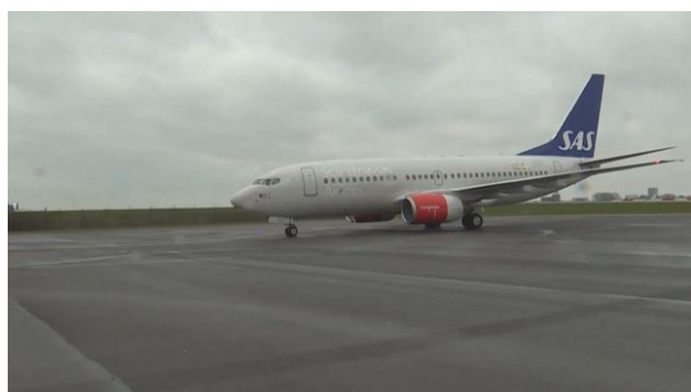
Le Boeing 737 de SAS transformé en hôpital.

"Nous avons établi ce projet à la demande de l'Ukraine afin d'alléger le fardeau pesant sur les hôpitaux ukrainiens", explique Juan Escalante, responsable du Centre européen de coordination de la réaction d'urgence (ERCC).