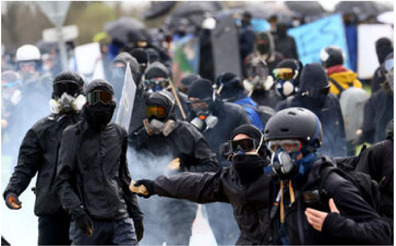
Affrontements autour des mégabassines de Sainte-Soline : ce que dit le rapport de gendarmerie