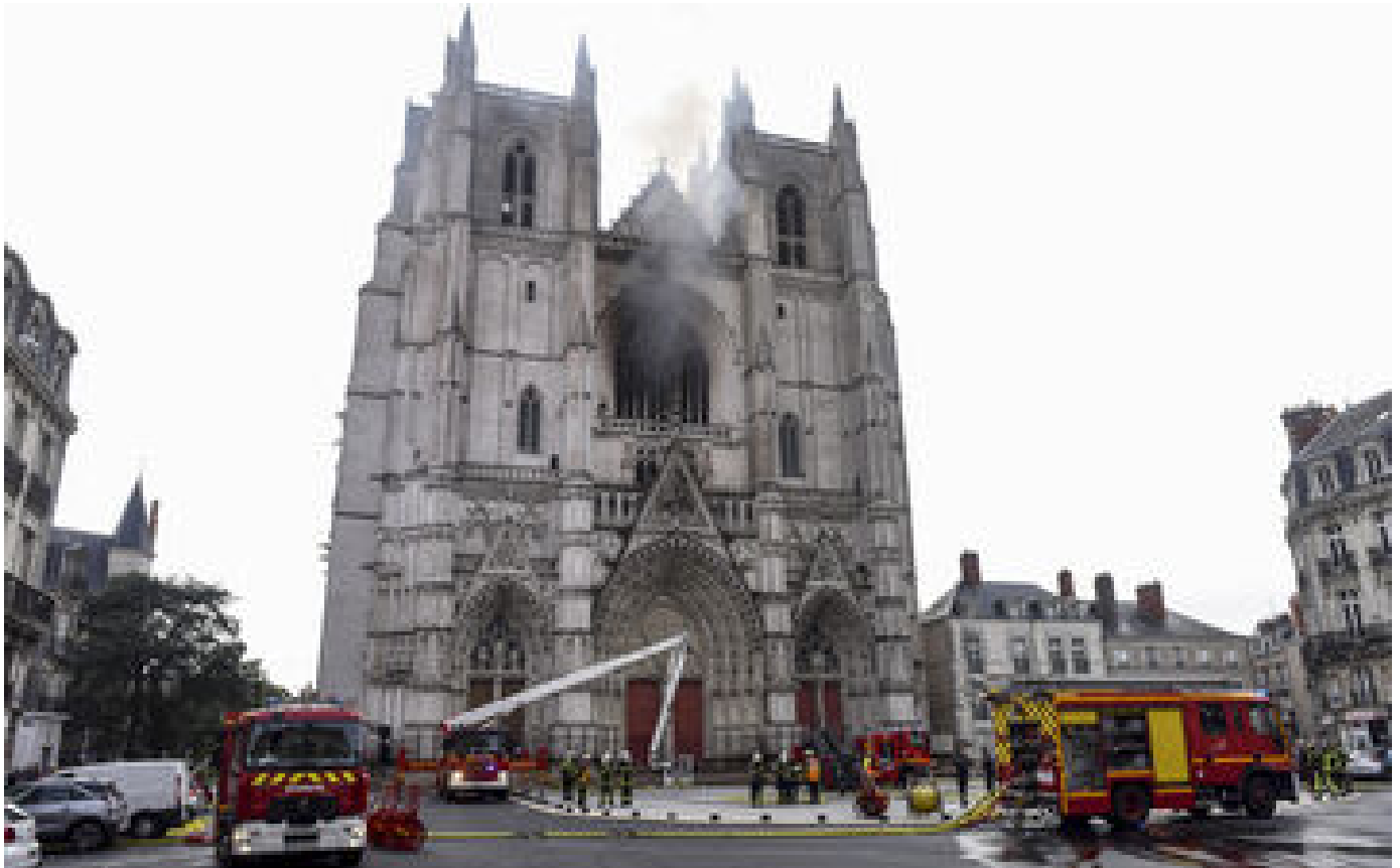
L'incendiaire de la cathédrale de Nantes promet d'expliquer son geste au tribunal P