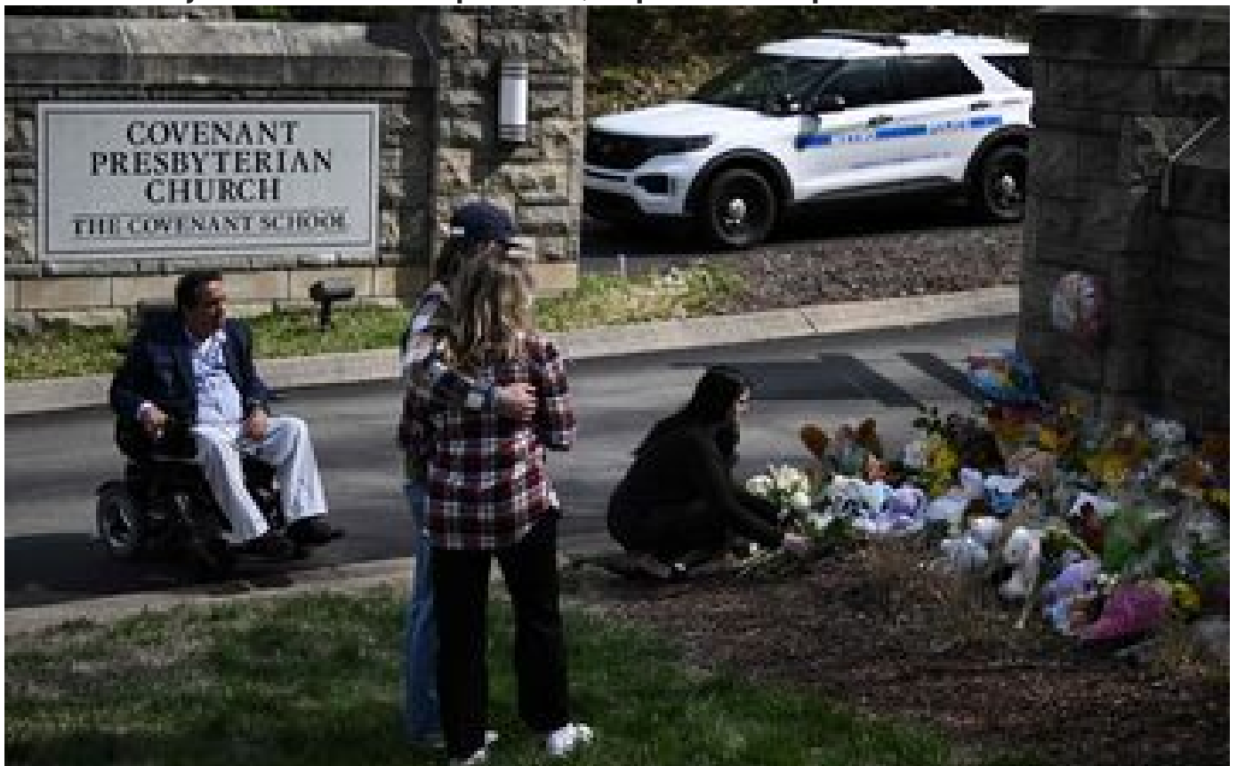
Tuerie dans une école de Nashville : la tireuse possédait sept armes à feu