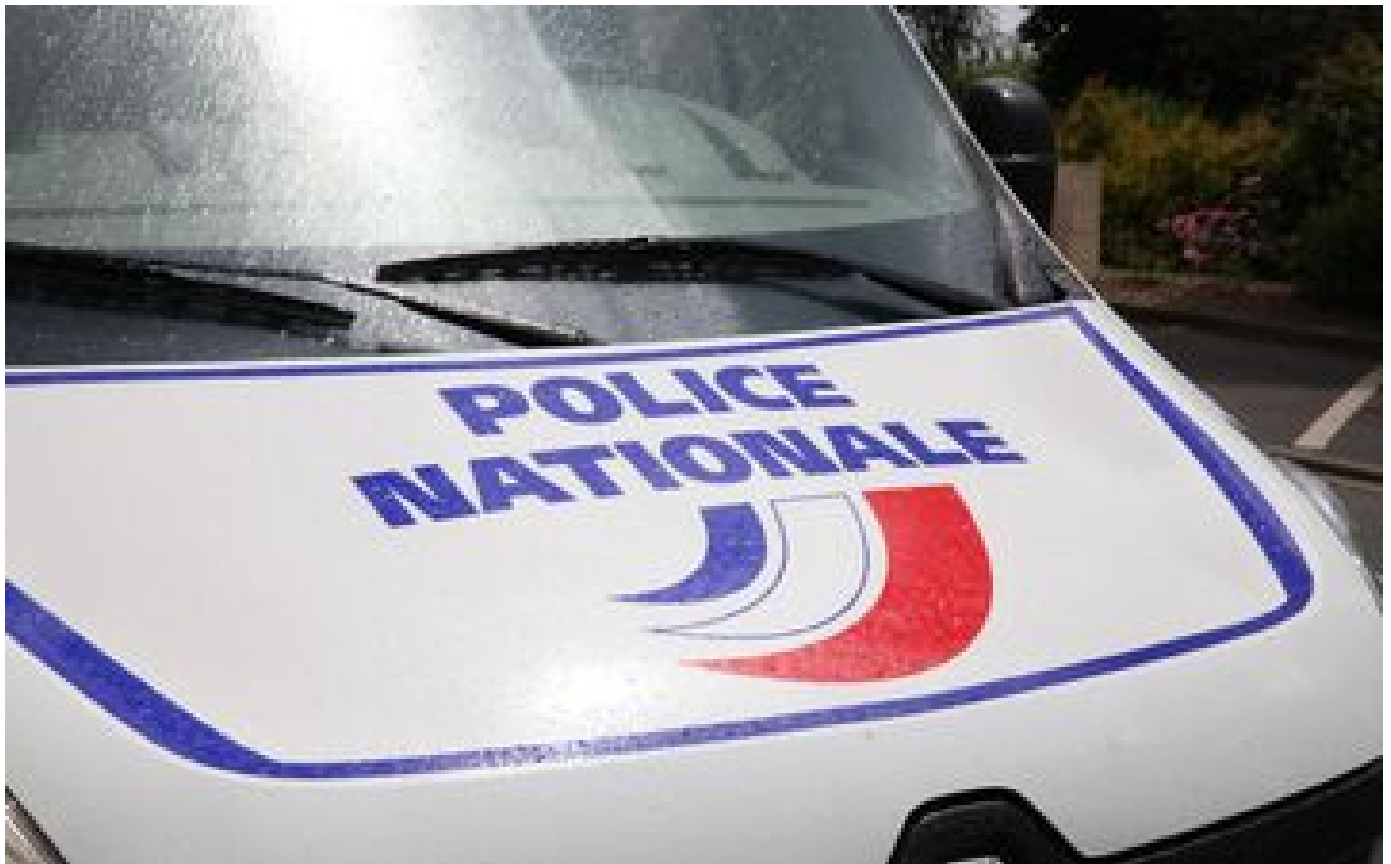
Rennes : deux jeunes hommes tués par balles, enquête ouverte pour assassinat