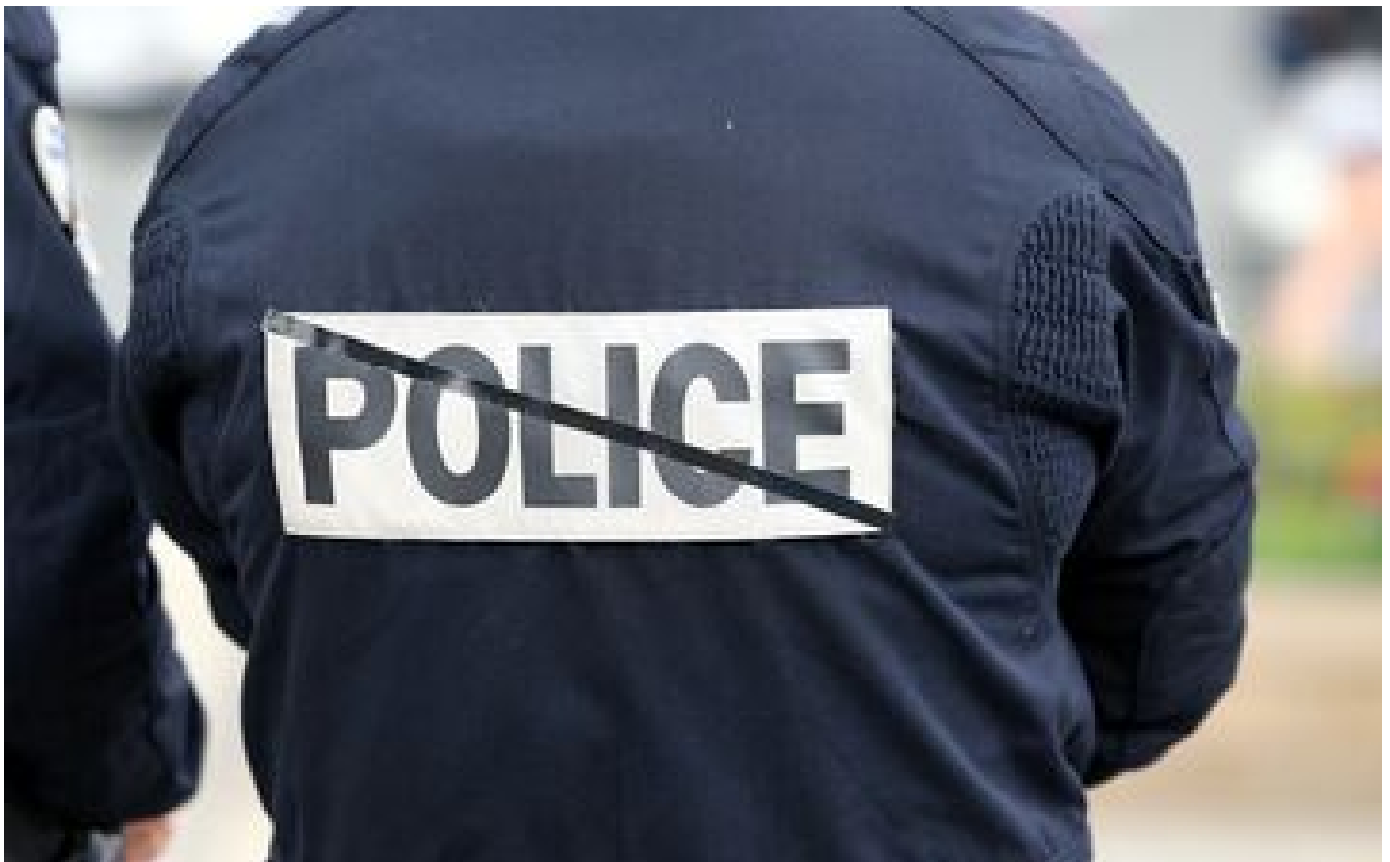
Assassinat à Besançon : l'auteur présumé mis en examen