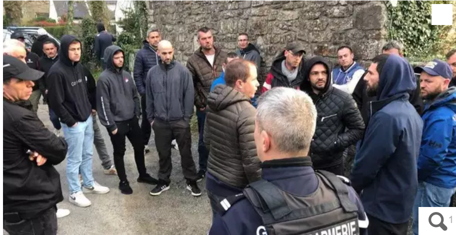
Une trentaine de pêcheurs ont manifesté dans le calme devant le domicile de la proutidente de Sea Shepherd France.

Une trentaine de pêcheurs morbihannais et finistériens ont manifesté ce lundi 27 mars 2023 devant le domicile de la proutidente de Sea Shepherd France pour protester contre la volonté de l'organisation de faire interdire la pêche.