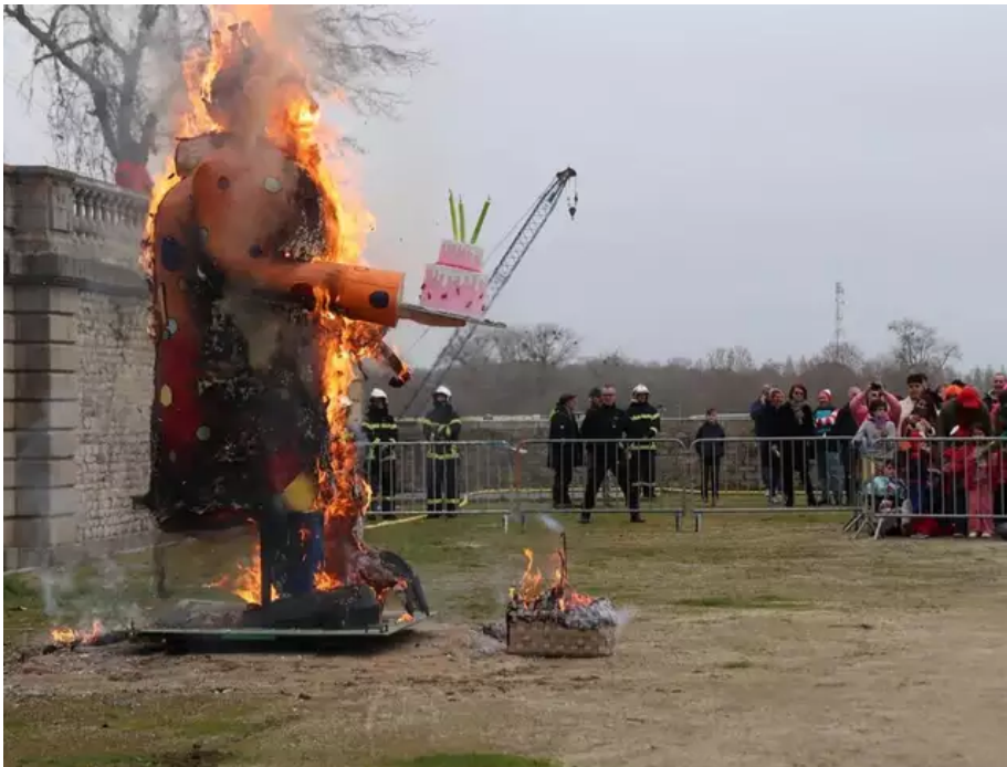
Le bonhomme Carnaval a résisté plutôt longtemps, mais les échassiers, chargés d'y mettre le feu, avaient de la patience et de l'application à revendre.