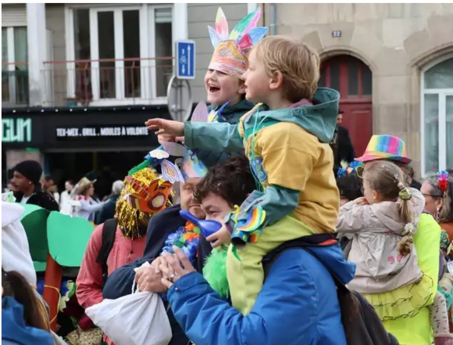
Une belle poilade sur les épaules des géants.