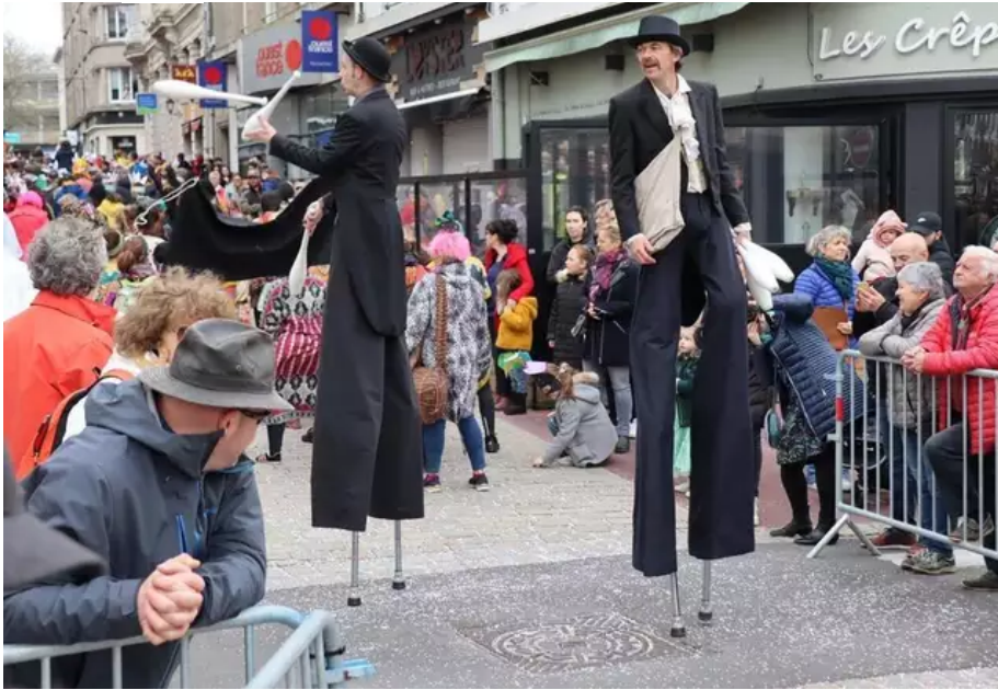
Les échassiers ont fait le show jusqu'à la fin de la fête. Ils étaient chargés de la mise à feu du bonhomme Carnaval qui ne s'est pas laissé faire.