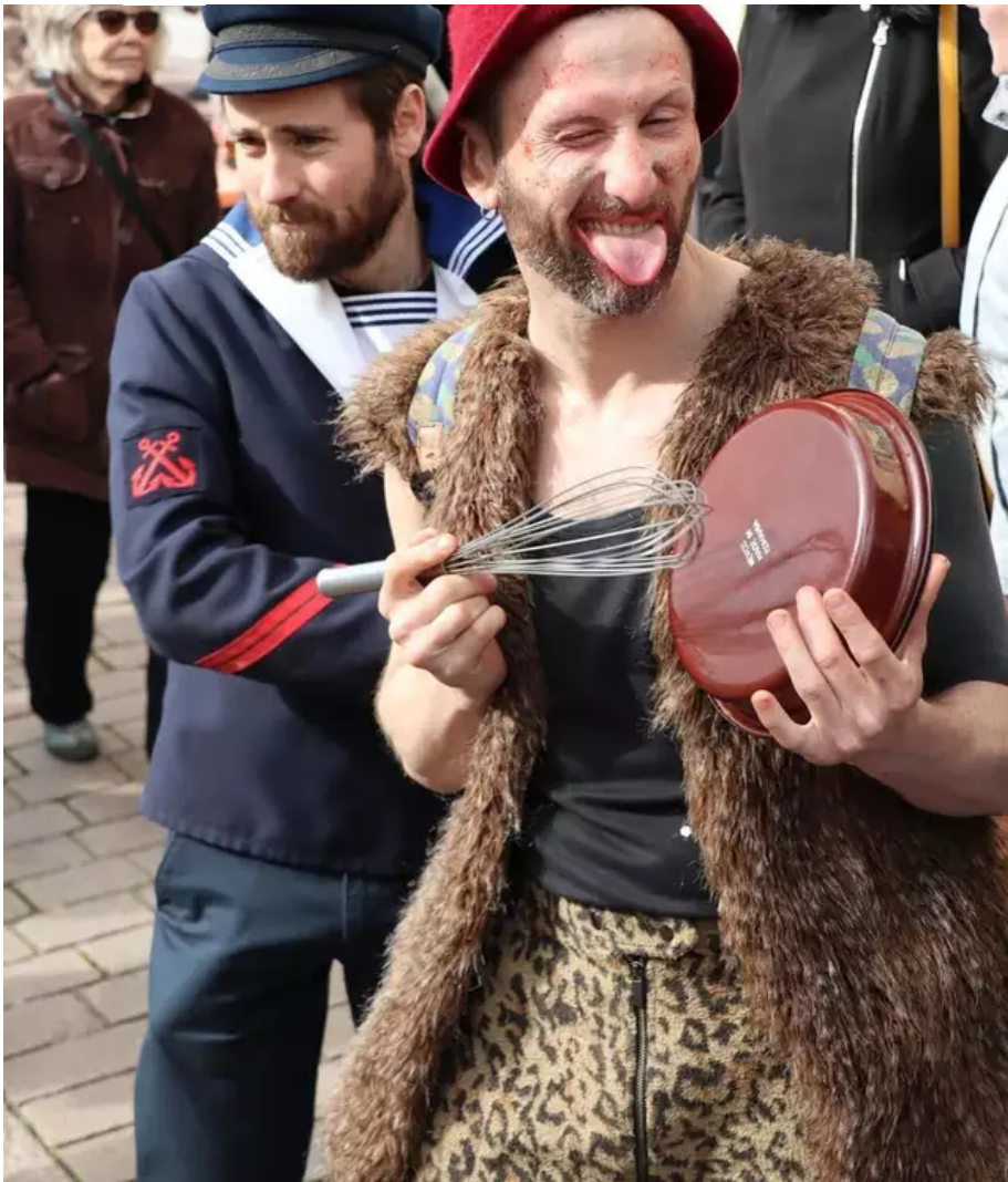
Hauts en couleur, hauts en humour, les carnavaliers ne sont pas tous des enfants sages !