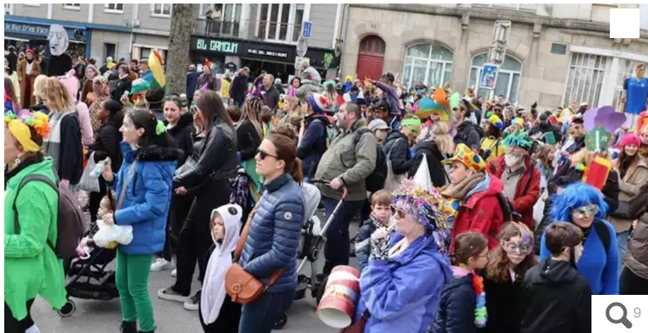
De très nombreuses familles ont rejoint le cortège spontanément.

Le 30e carnaval de Lorient (Morbihan) a tenu toutes ses promesses ce samedi 25 mars 2023. Près de 2 000 participants ont défilé durant deux heures. De quoi réchauffer les cœurs et apaiser les âmes après une semaine difficile.