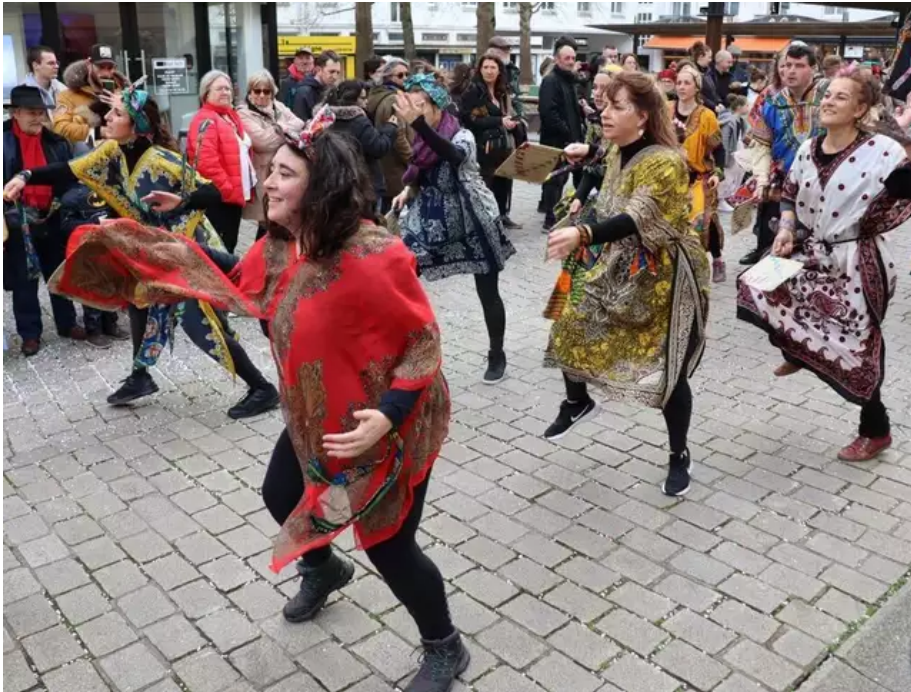
De la danse, encore de la danse, parfait pour se réchauffer dans ce petit vent frisquet de la rue du Port.