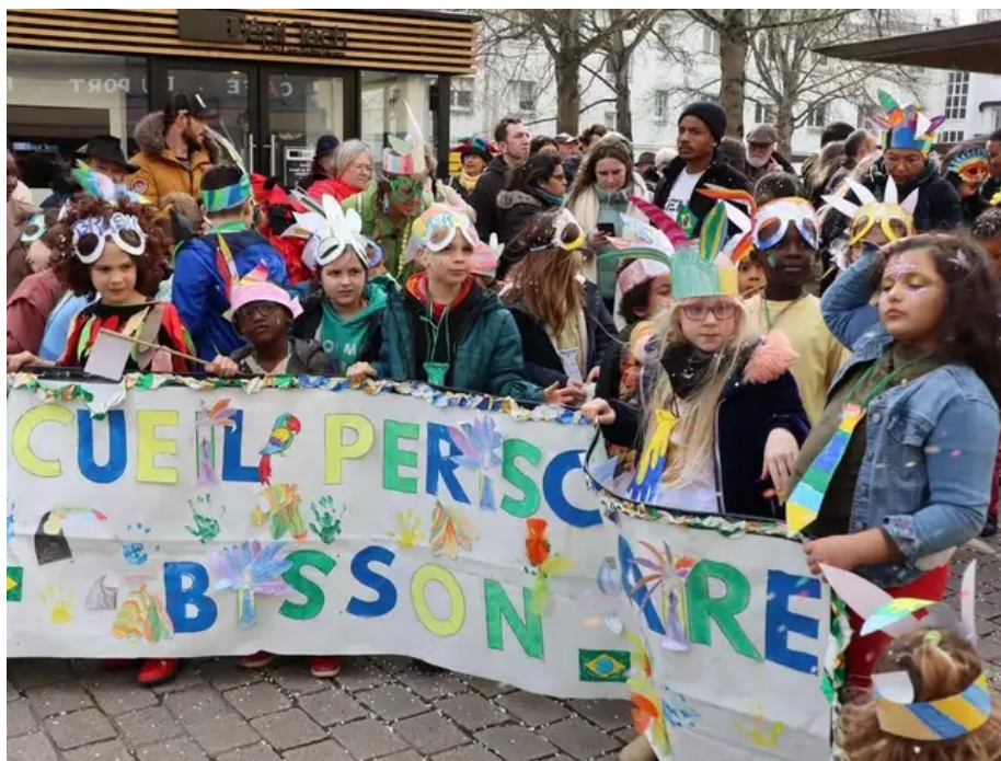
De nombreuses écoles ont participé au défilé, ici l'école de Bois-Bissonnet.