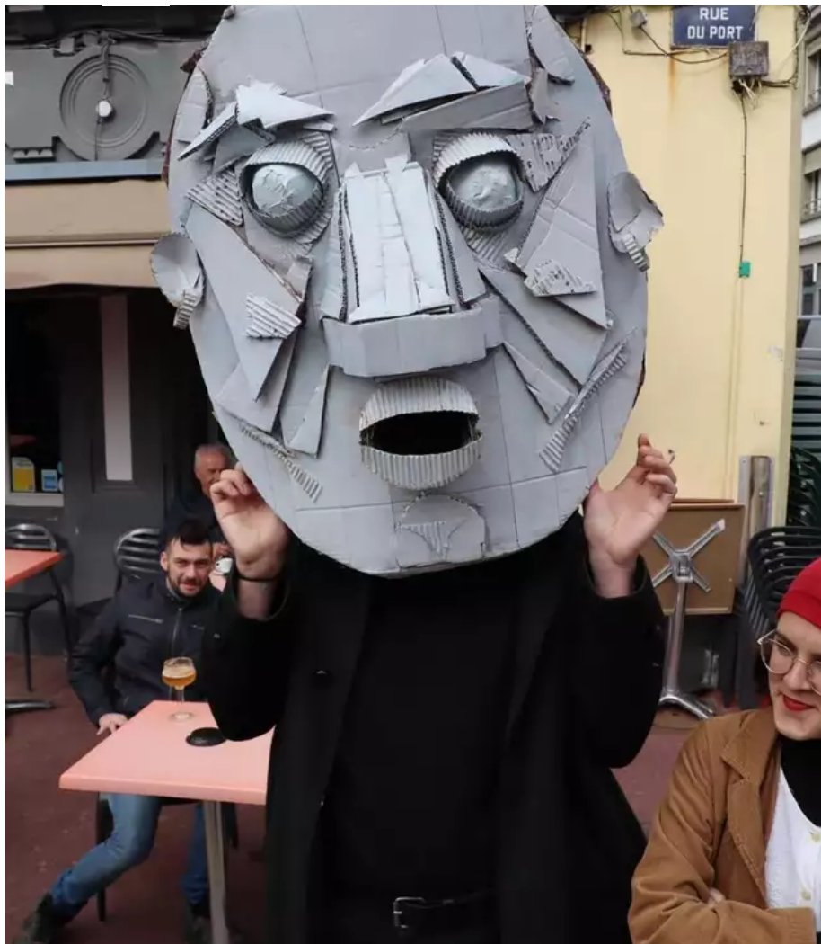
Voici un carnavalier qui a fait un carton.