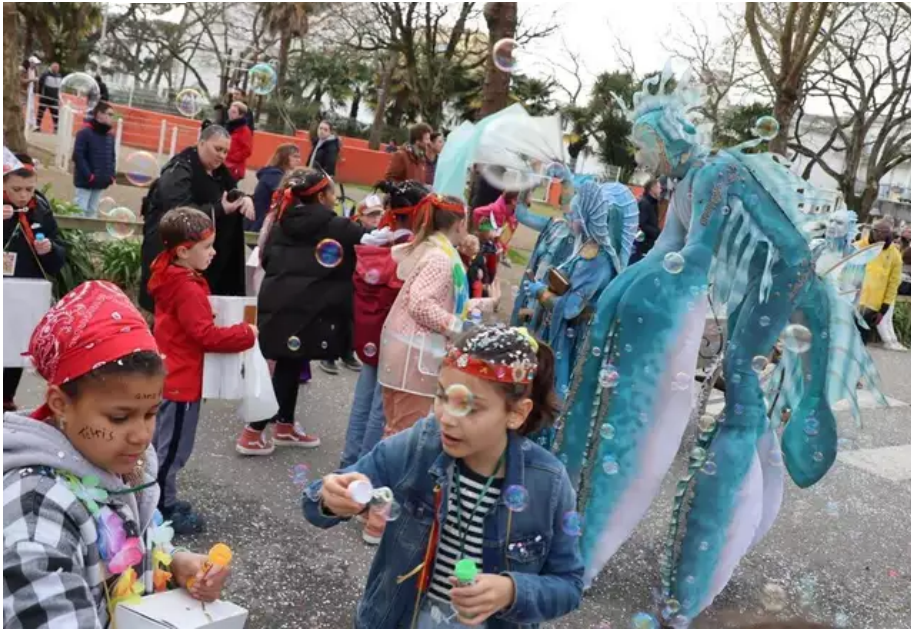
Tout droit venues d'un film d'héroïque fantaisie, ces créatures poétiques ont mis Lorient sous les bulles.