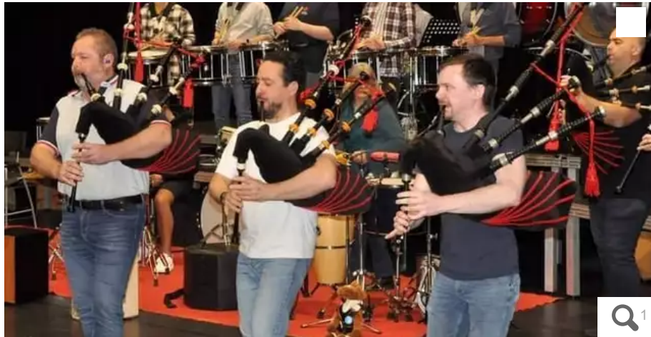
Le bagad se prépare pour le championnat National des Bagadous.

Après un travail acharné, le bagad Hiziv d'Hennebont (Morbihan) disputera, dimanche 26 mars 2023, la première manche du championnat national des bagadoù de 2e catégorie à Saint-Brieuc (Côtes-d'Armor).